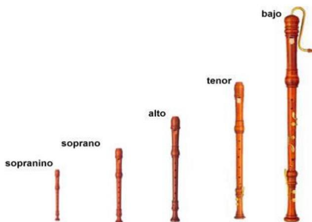
Figura 2. Familia de las Flautas de Pico. Castillo, 2017, p. 19.