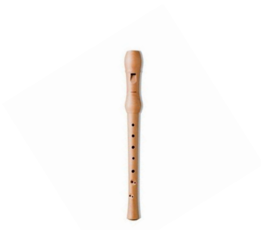
Figura 4. Flauta dulce soprano barroca.

En lo referente al debate sobre una digitación u otra, es posible afirmar que, para el principiante, la digitación alemana es más cómoda y permite rápidamente poder tocar canciones infantiles en tonalidades simples. Pero si uno planea tocar en el futuro obras más exigentes, es recomendable empezar con la digitación barroca. Parece más incómoda en un principio ya que la escala de do M (flautas en do) se toca con una digitación en horquilla. A cambio, permite tocar todos los semitonos en una tesitura de más de 2 octavas sin ningún problema de afinación.