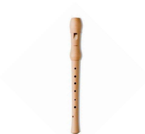
Figura 3. Flauta dulce soprano alemana.