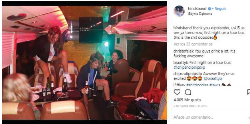
Ilustración 10. Imagen extraída de la cuenta oficial de Instagram de Hinds. https://www.instagram.com/p/BJ1GS0kjORl/?taken-by=hindsband

En las entrevistas que contestaron algunos seguidores de Hinds, la gran mayoría explicaron que parte de su interés y empatía por la banda se debía a que sentían que Hinds transmitían diversión, veían que se lo pasaban bien en todo momento, y en numerosas ocasiones mencionaron la palabra “autenticidad”. Es decir, muchas personas explican que les gusta Hinds porque son ellas mismas, no se esconden, son cercanas con la gente y hacen siempre lo que quieren. Este es uno de los aspectos que más aprecia el público, obviando lo musical, y por tanto se potencia constantemente en las redes sociales.