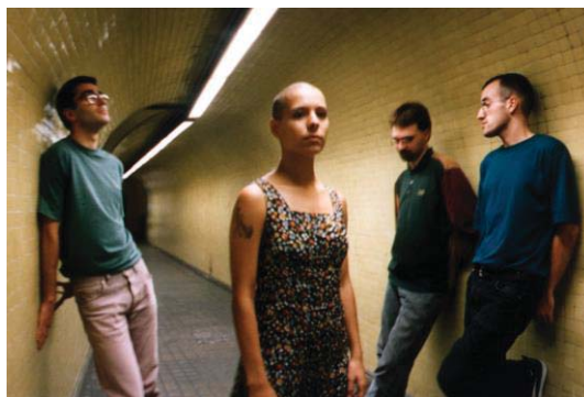
Ilustración 4. From Head to Toe.

Por otro lado, se observan ejemplos en los que se crea una forma distinta de representar la feminidad en estos mismos contextos. Algunos de los grupos de hardcore punk y post-hardcore que más trascendieron en la escena española fueron Wallride (Valencia, 1994) o From Head to Toe (Barcelona, 1995).