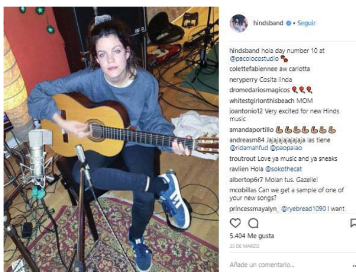
Ilustración 9. Imagen extraída de la cuenta oficial de Instagram de Hinds: https://www.instagram.com/p/BSEC0W2gPOX/?taken-by=hindsband

Hinds suben numerosas imágenes personales: grabando en el estudio, saliendo de fiesta, haciendo la maleta o comiendo antes de un concierto. Siempre ofrecen una imagen alocada, de chicas jóvenes que visten desaliñado y que se lo pasan bien continuamente. Es su marca, y con ello han atraído a una gran parte del sector joven y adolescente.