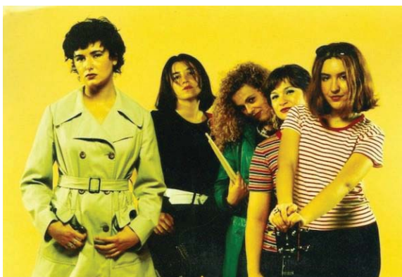
Ilustración 5. Undershakers.