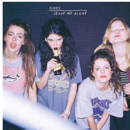
Ilustración 16. Ilustración 1. Portada del álbum Leave Me Alone .

Con el análisis de la grabación se pretende mostrar la importancia de la pieza musical desde el punto de vista sonoro, ya que el análisis musical y del sonido son esenciales para poder entender otros aspectos de origen social. De este modo, el estudio de Leave Me Alone permitirá aportar información acerca del indie rock como género musical, que complementan su configuración como “escena”, y comprender algunas cuestiones relacionadas con la performance, la recepción de los temas y entender en mayor profundidad todas aquellas cuestiones sobre género que se han tratado en los capítulos anteriores.