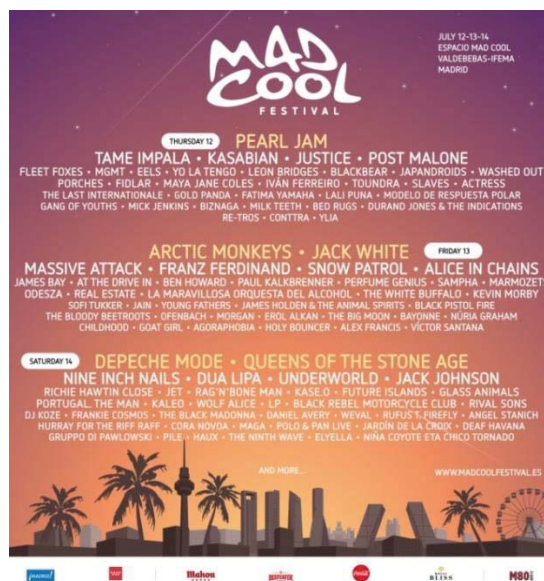
Ilustración 7. Cartel del FIB 2018. Imagen extraída de la página web https://fiberfib.com/

Si nos fijamos en los festivales de música independiente en España, estos se han convertido en grandes eventos de masas a los que asisten artistas con una gran repercusión mediática. Además, casi no actúan grupos españoles, mucho menos como cabezas de cartel. Este año el FIB cuenta con The Killers, Liam Gallagher y The Pet Shop Boys como los grandes fichajes. Hay que puntualizar que, aunque el indie fue un movimiento en el que hubo un mayor número de mujeres, como todos los géneros dentro del rock las grandes figuras son, en su mayoría, grupos integrados por hombres, y ocasionalmente mixtos. De hecho, en estos dos carteles, los principales referentes son masculinos, excepto alguna excepción como Wolf Alice o Dua Lipa, aunque esta última está mucho más vinculada a la industria del pop más comercial y no al indie .