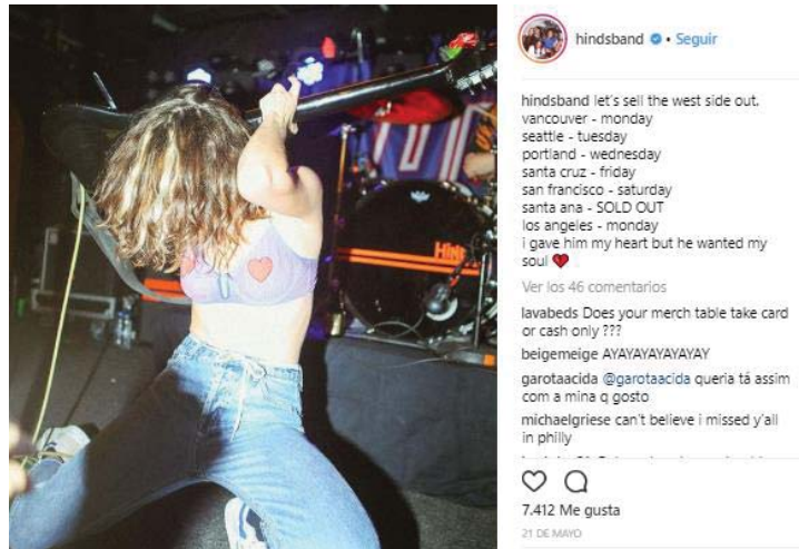
Ilustración 14. Imagen extraída de la cuenta oficial de Instagram de Hinds: https://www.instagram.com/p/BjBK3r_hlyX/?taken-by=hindsband