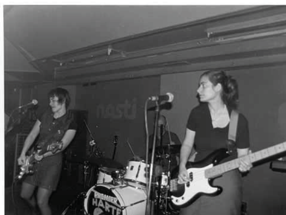
Ilustración 2. La banda Hello Cuca en directo.

“Aguacate Nena”, lanzado en 1998 en el EP Amor y Cohetes , es uno de los temas más representativos de la banda. En él se puede escuchar un sonido que recuerda al punk con guitarras distorsionadas, progresiones de acordes sencillas, un tempo rápido y una voz agresiva y potente. Al mismo tiempo, en la mayoría de sus canciones se aprecian unas características sonoras que recuerdan al surf rock y al rock de garaje, siempre con una producción lo-fi . La primera vez que tocaron fue en Bullas (1998) en el festival que organizaron Iluminados, un grupo de la escena indie española, que se convirtió en un referente para festivales posteriores como el FIB. Aunque las principales influencias de Hello Cuca fueron grupos relacionados con el riot grrrl , en España casi nadie se definía como tal. No había un movimiento riot grrrl consolidado e incluso mucha gente no quería que se la definiese así, pues tenía unas connotaciones políticas determinadas. Lo que había era una pequeña red de contactos que compartían gustos como el interés por los fanzines y por grupos como Bikini Kill. Algunos fanzines españoles fueron Neurótica y Miau! 49