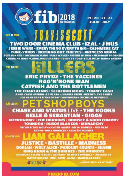
Ilustración 6. Cartel del Mad Cool Festival 2018.

The Beatles establecieron un nuevo modelo y cambiaron el mapa por completo. Entusiasmados con la posibilidad de capturar una mínima parte del poder (musical, sexual) que proyectaba el cuarteto de Liverpool, un número incalculable de adolescentes varones se lanzaron a la aventura de formar sus propias bandas. Muy pronto, esta se convirtió en una actividad eminentemente masculina: el grupo moderno de pop quedó definido como un club cerrado, destinado a canalizar las fantasías de los chicos de clase media.