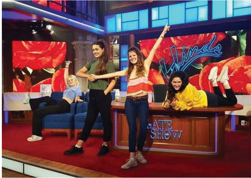
Ilustración 8. Hinds en The Late Show.

En cuanto a su estilo, han sido definidas con numerosas etiquetas como garage rock , garage pop , surf rock o indie rock . Como mencioné al principio de este trabajo, siempre han optado por un sonido lo-fi en sus temas y por la ideología del DIY. Además, han citado a Black Lips, Ty Segall, The Strokes, The Vaccines, Juan Wauters y Mac DeMarco como sus principales influencias, y a dos bandas amigas de la escena madrileña de garaje: Los Nastys y The Parrots.