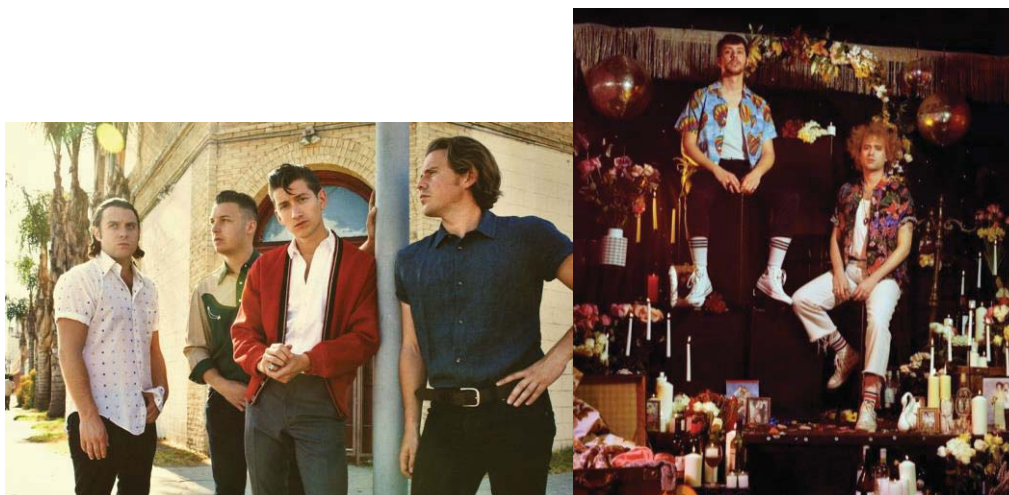
Ilustración 12. Arctic Monkeys y The Parrots.

Sin embargo, al mismo tiempo, ese concepto de hípster se basa en la construcción de una identidad marcada por lo que se consume, y por supuesto, esto está estrechamente relacionado con las redes sociales y el hecho de mostrar una imagen determinada caracterizada por la individualidad estética en un intento de dissociarse de la masa. Por supuesto, estas características no son un denominador común, y es algo más complejo que todo esto. Sin embargo, estos planteamientos tienen relación con ese cuidado por lo estético que se aprecia en muchos artistas del indie rock, que obviamente se puede extrapolar a Hinds, pero también a muchos otros grupos integrados por hombres de la escena de garaje madrileña como The Parrots, y a otros más internacionales como The Growlers o los propios Arctic Monkeys.