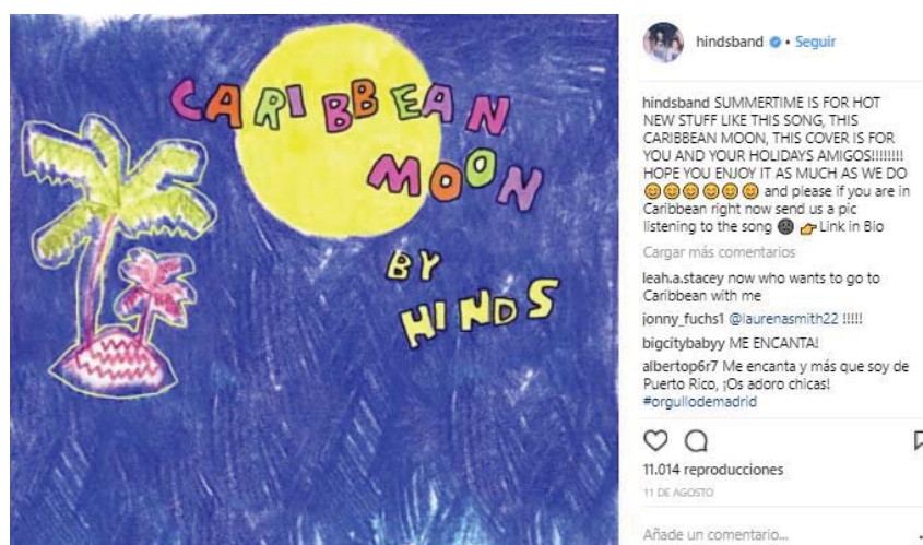
Ilustración 11.

Además, aprovechando estas publicaciones de Instagram Hinds avisan a sus fans de los próximos conciertos o del lanzamiento de un nuevo single, y a menudo utilizan lo que se conoce como CTA ( Call to Action ). Es decir, se trata de hacer participe al público para que a partir de la interacción a través de las redes sociales se sienta cercano a la banda y a la “comunidad Hinds”. Por ejemplo, en esta imagen invitan a sus seguidores a grabar un video mientras escuchan su nuevo single “Caribbean Moon”: