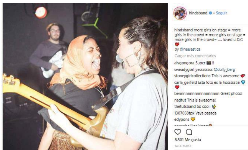
Ilustración 15. Imagen extraída de la cuenta oficial de Instagram de Hinds: https://www.instagram.com/p/BivP4yphHy0/?taken-by=hindsband

se ha generado por el resurgir cada vez más fuerte en la sociedad de una mentalidad feminista que trae consigo la evolución de los presupuestos de la Tercera Ola. La peculiaridad es que está determinada por el uso de la tecnología que ha permitido la construcción de un movimiento global y popular y la conexión e intercambio de información desde diferentes partes del mundo. Ya se está empezando a teorizar sobre un feminismo de la era digital y las nuevas generaciones que está estrechamente ligado a cuestiones de género, sexualidad y en el que se aboga por la interseccionalidad, aunque con él también aparecen nuevas problemáticas como la capitalización del feminismo o nuevas formas de machismo digital. En las redes sociales de Hinds vemos un claro ejemplo de cómo este pensamiento está calando en la sociedad, en este caso en un grupo musical. Y es que, aunque Hinds es la banda de la escena de Malasaña que más repercusión ha tenido y pueda parecer que su género no supone un impedimento para ello, tienen que rodearse de un sexismo todavía latente dentro de la industria musical.