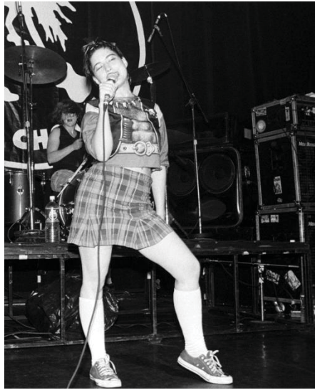
Ilustración 3. Kathleen Hanna.

their body. Hanna wonders, “If you wear a dress that says ‘kill me’ on it, does that mean you’re asking for it?” 50