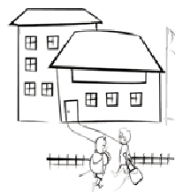
Ceip Castilla y León