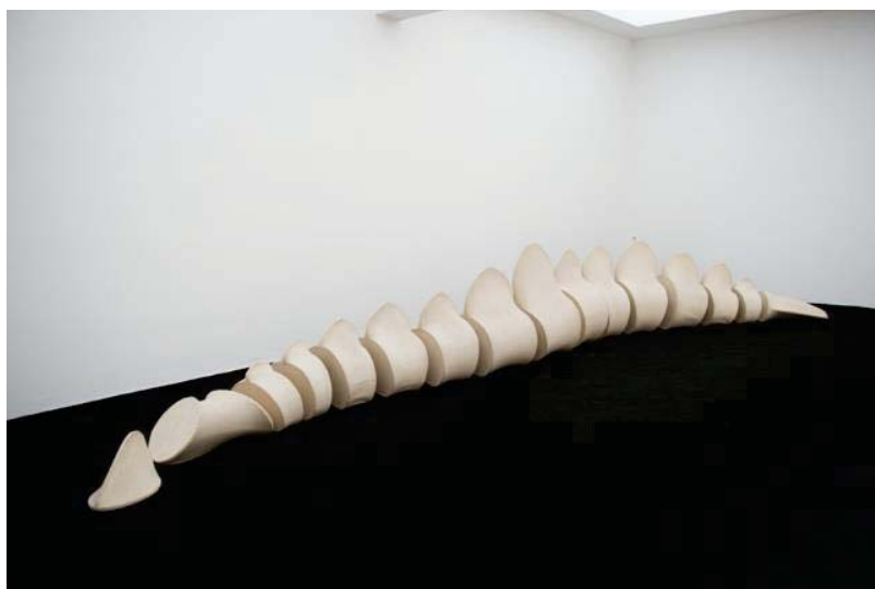
Figura 2. Ricostruzione del dinosauro (1966) de Pino Pascali.