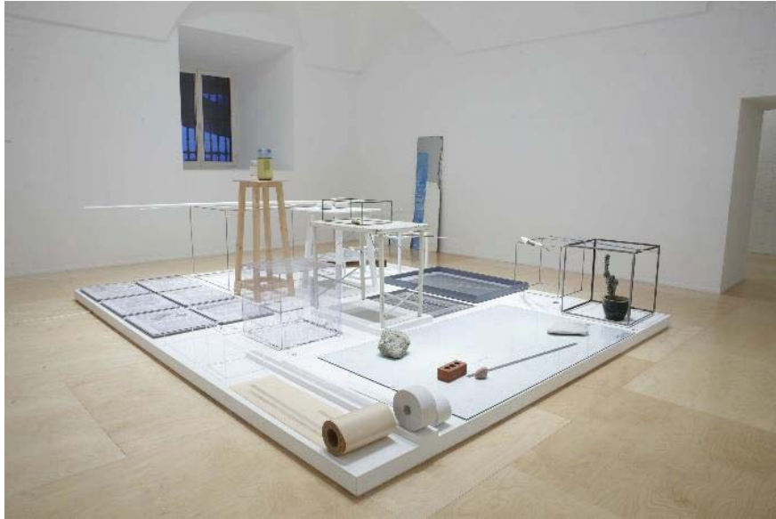
Figura 3. Peana Crystal times (2009) de Joelle Tuerlinckx