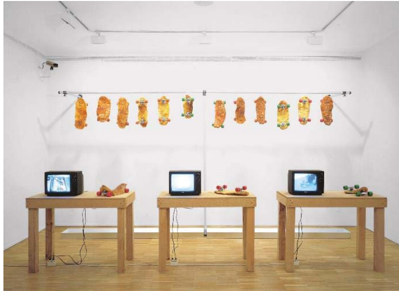
Figura 4. La Hermandad (1994), José Antonio Hernández Díez.