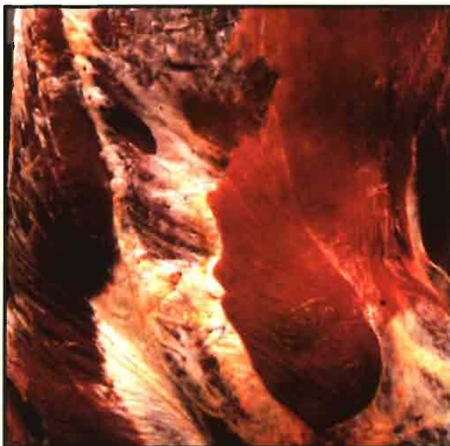
Varios factores determinan la coloración de la carne.

El estrés va a repercutir negativamente sobre el pH final (medido a las 24 h post-sacrificio), así como en la velocidad de descenso, y como se comentará más adelante, va a ser un condicionante clave en otros