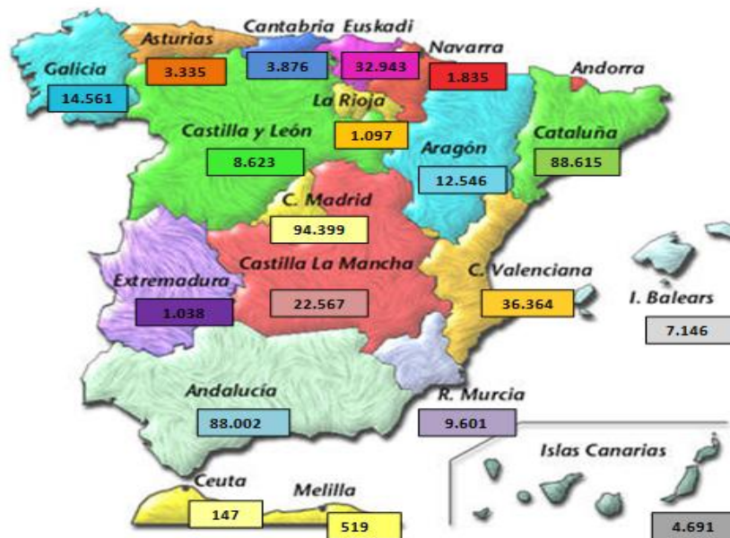
Figura 3: alumnado total matriculado de 0 a 3 años de edad en centros privados y públicos.