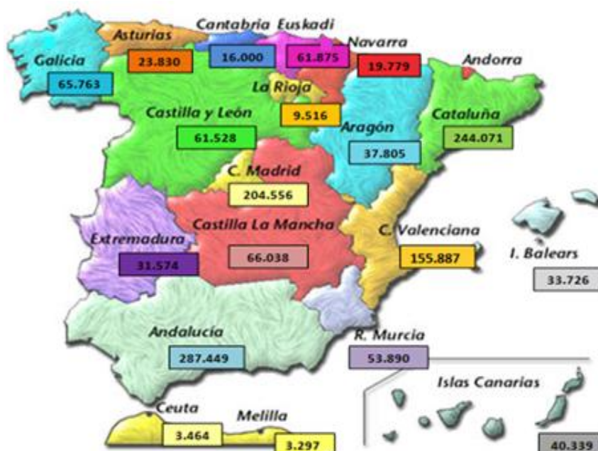
Figura 4: alumnado matriculado de 3 a 5 años de edad en centros privados y públicos