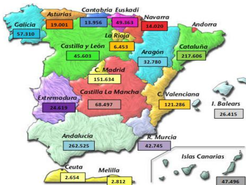
Figura 1: alumnado matriculado en el curso 2010-2011 en centros públicos.

Fuente: Elaboración propia a partir de las Estadísticas del Ministerio de Educación Cultura y Deporte 2013.