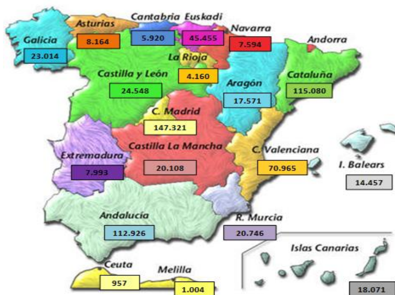
Figura 2: alumnado matriculado en el curso 2010-2011 en centros privados.

Fuente: Elaboración propia a partir de las Estadísticas del Ministerio de Educación Cultura y Deporte 2013.