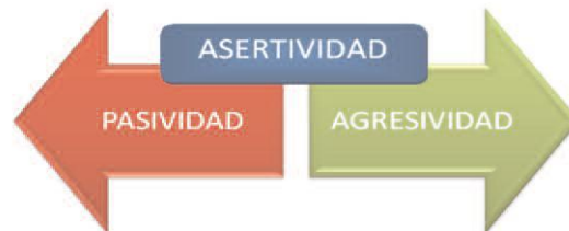
Figura 3. Estilos comunicativos.