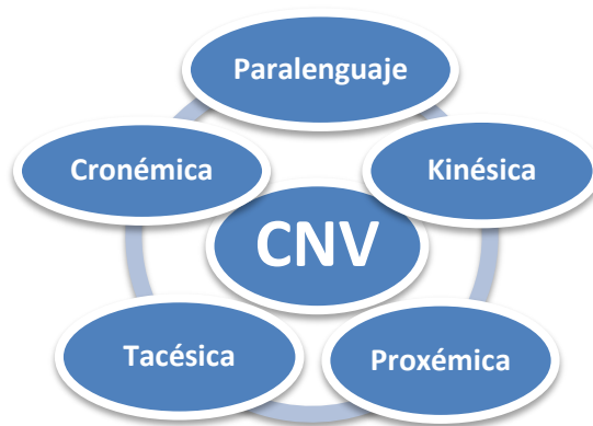
Figura 2. Ramas de comunicación no verbal.