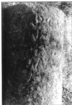
LÁMINA I.1,2,3. Fragmento A del miliario n° 2 hallado en la localidad de Prado del Río.