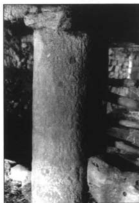
LÁMINA II. 1) Miliario n° 3 hallado en la localidad de Prado del Río; 2) Miliario n° 7 (Milla CXXXVII) del Prado del Regajo; 3) Miliario de Peromingo (Milla CXXI).