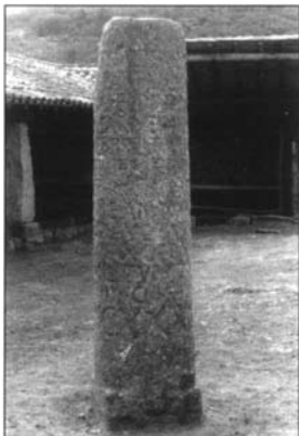
LÁMINA III.1 y 2. Miliario del Puente de la Magdalena (Milla CXXXVIII).