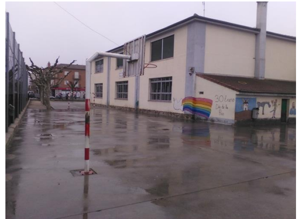
Cancha de fútbol

Este centro carece tanto de biblioteca, como de sala multiusos, por lo que diversos acontecimientos, como por ejemplo el teatro de navidad, se celebran en una sala multiusos cedida por el ayuntamiento situada a unos 600 metros del colegio.