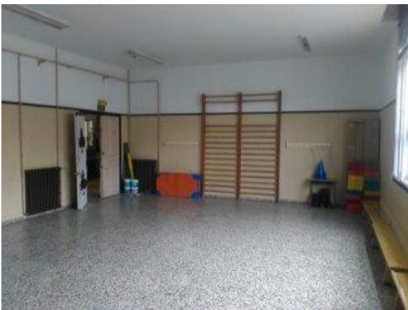
Aula adaptada a modo de gimnasio

1° Edificio. En este edificio se encuentran las aulas de los cursos de 4°, 5°, 6° A y 6° B de Educación Primaria. Por otra parte, en este edificio encontramos un aula que ha sido adaptada para ser usada a modo de gimnasio, un aula de música, además de dos despachos para los profesores y diferentes cuartos de baño tanto para profesores, como para alumnos. Es el edificio más antiguo de los dos.