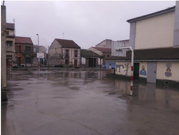
Cancha de baloncesto

- El resto del patio posee una cancha de futbol, otra de baloncesto y una zona de arena. En esta zona se encuentran los alumnos de Educación Primaria