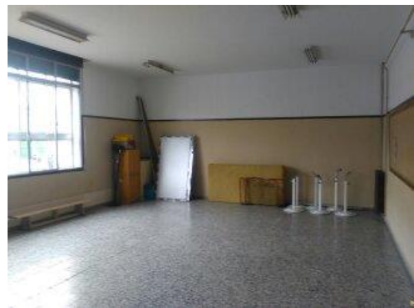
Aula adaptada a modo de gimnasio

2° Edificio. En este edificio se encuentran las aulas de 1°, 2° y 3° de Educación Infantil, y las de 1°, 2°, 3° A y 3° B de Educación Primaria. Por otra parte, este edificio cuenta con una sala de ordenadores, un aula para PT, AL y compensatoria, despacho de profesores y diferentes cuartos de baño, tanto para profesores, como para alumnos de Primaria e Infantil. Es un edificio de reciente construcción que satisface todas las necesidades de un colegio.