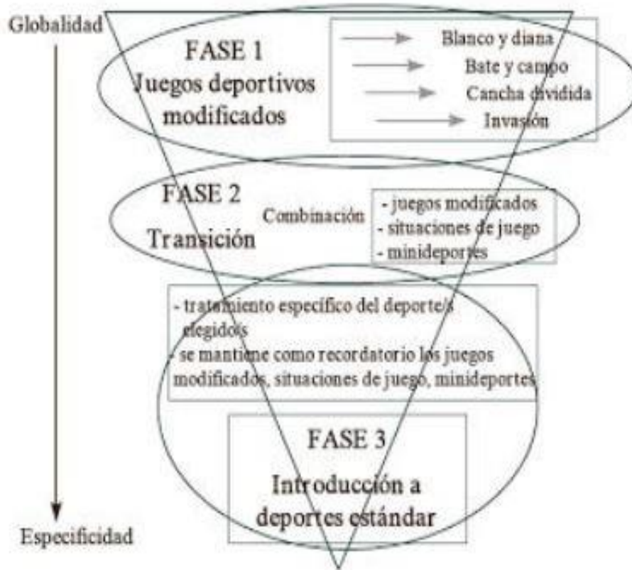
Figura1: Progresión de los juegos (Devís y Sánchez, 1996, p. 15).