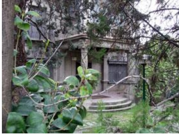
Figura: Mansión de la Malvaloca.