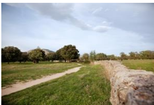
Figura: Barrera de piedra divisoria entre la zona ganadera y la zona recreativa de la Dehesa Boyal.

Actualmente, la Dehesa Boyal se ha visto reducida notablemente en cuanto a extensión a causa del crecimiento urbano, y sigue en pie la práctica de la ganadería tradicional, aunque no supone una fuente de ingresos para el municipio desde el desarrollo industrial a mediados del siglo XX. Los pastos están ahora divididos en dos zonas, una para uso ganadero; y la otra como parque forestal de uso recreativo, con parques infantiles, parques de mayores, zonas de descanso y picnic y caminos para andar y hacer deporte.