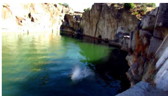
Figura: Las Canteras.

Actualmente es frecuente visita de jóvenes para bañarse en ella, aunque recientemente ha sido estipulada la prohibición de baño, pero aun así hay gente que sigue bañándose. Cuentan las leyendas urbanas que en el fondo del lago formado en la cantera hay un autobús escolar hundido.