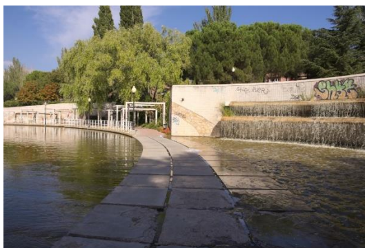
Figura: Mitad artificial del Parque de la Laguna del Carrizal.