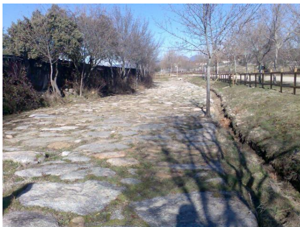
Figura: Antigua calzada romana en Galapagar.

romana, que data del siglo III d.C. y que unía Zaragoza con Mérida; y una antigua alcantarilla romana.