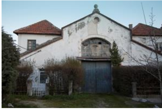
Figura: Fonda de la Trinidad.