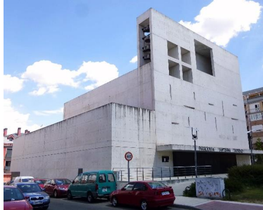
Figura: Santísima Trinidad.

La Iglesia Santísima Trinidad fue inaugurada en el año 1997, proyectada por los arquitectos Vicens Hualde, José Antonio Ramos y María Ángeles Hernández Rubio. Es un edificio de estilo contemporáneo, que destaca principalmente por su forma cúbica, sus formas abstractas, su color blanco en el exterior y su iluminación interior.