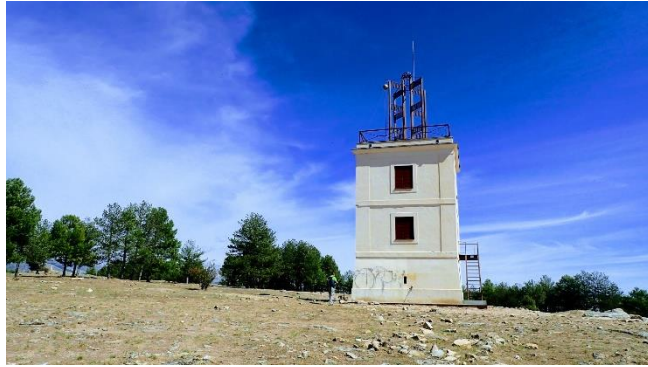
Figura: Telégrafo tras restauración.