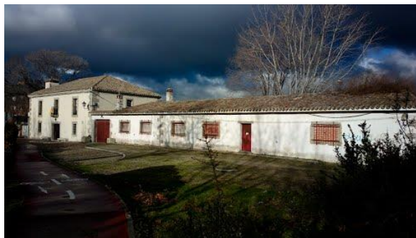
Figura: La Venta.

Actualmente no se encuentra en buen estado y no está permitido cruzarlo. Se está estudiando elaborar un plan de recuperación del puente.