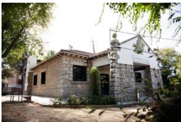
Figura: Biblioteca Sancho Panza.

Hoy en día, además de la función que cumple de biblioteca, también se realizan numerosas actividades en las salas infantil y juvenil, la sala multimedia y el jardín de los cuentos. En ellas se realizan actividades pensadas principalmente para la diversión de los más pequeños, como por ejemplo talleres, teatros al aire libre o sesiones de cuentacuentos.