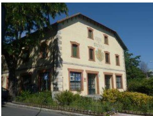
Figura: Casa de la Cultura.