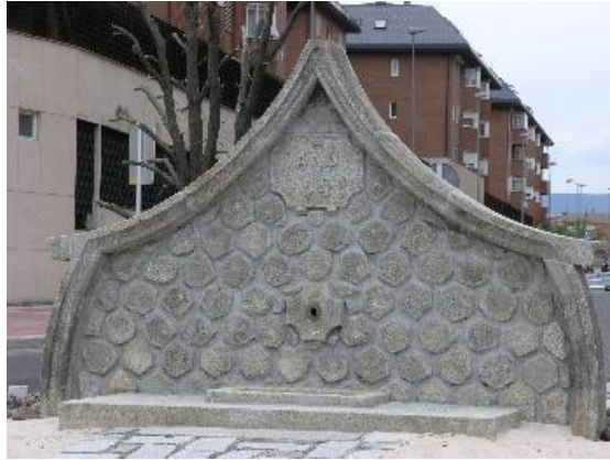
Figura: Fuente de La Reina.