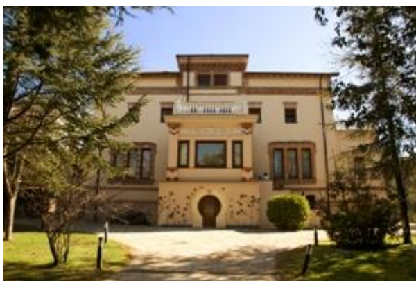
Figura: Residencia de Mariano Benlliure.