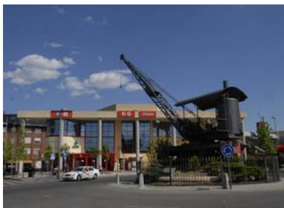
Figura: Grúa de la Estación y Estación de Collado Villalba.

Además del barrio urbano, podemos encontrarnos con varios monumentos de gran interés de los que ya hemos hablado anteriormente, como la Ermita de Santiago, la Iglesia de La Santísima Trinidad y la Fuente de la Reina, muy próximos entre sí. También podemos observar en la puerta de la estación la “Grúa de la Estación”, un monumento que hace referencia a la importancia que tuvo el ferrocarril en nuestra ciudad en estos dos siglos pasados.