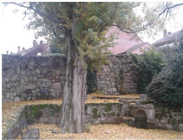
Figura: Chopo y Fuente del Caño Viejo.

Acompañando a la antigua fuente desde mediados del siglo pasado nos encontramos con un chopo, pero no es un chopo cualquiera. Este árbol fue incorporado en el año 2004 en el Catálogo de Árboles Singulares de la Comunidad de Madrid, por lo que el grado de protección que lleva consigo es máximo.