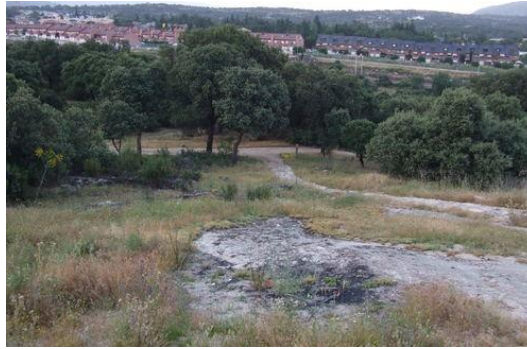
Figura: Coto de Las Suertes.