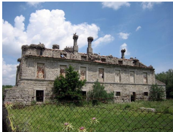
Figura: Palacio Monasterio abandonado de El Escorial.

En cuanto a las especies animales que podemos observar durante el camino, destacan principalmente las reses bravas y las vacas, de las que estaremos rodeados prácticamente en todo el trayecto sin ningún tipo de peligro, ya que hay vallas de por medio; y las cigüeñas blancas mencionadas anteriormente, que las encontraremos concretamente en el antiguo Palacio Monasterio y que, si están en época de celo y tenemos suerte, podremos escuchar su crocoteo. Además, se observan frecuentemente especies de aves muy bonitas, tales como jilgueros, verdecillos y zorzales. En lo que se refiere a vegetación, disfrutaremos del paisaje adehesado característico de la zona, con grandes praderas de pasto a nuestro alrededor acompañado de encinas y fresnos.