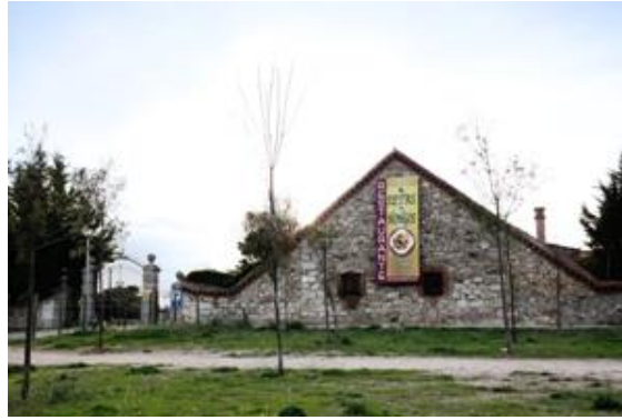
Figura: Restaurante “El Gallinero”