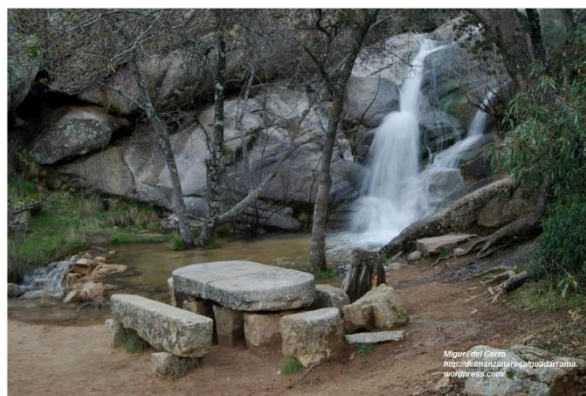
Figura: Cascada del Covacho.

Este rodeo está diseñado sobre el Parque Regional de la Cuenca Alta del Río Manzanares, que como su propio nombre indica, es un espacio protegido, por lo que tenemos que respetar y cuidar el medio ambiente que nos rodea. Podemos observar, y sobre todo respetar, una bonita variedad de flora y fauna ya mencionada anteriormente, y tener cuidado con algunas de esas especies.