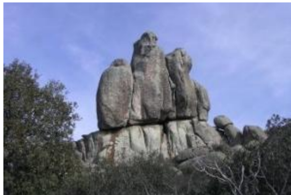
Figura: Peña del Águila.

La ruta de la Peña del Águila y el Canto Hastial no destaca por su vegetación, ya que es escasa y predomina el monte bajo; sino por sus figuras rocosas. Estamos rodeados de pequeñas aglomeraciones de piedras o pedrizas, y destacan varias de ellas por sus peculiares formas, que son de las que hemos hablado. Además, hay varios espacios aptos para la práctica de escalada. En cuanto a la fauna, destacan las diferentes especies de aves rapaces sobrevolando el monte, que son el milano real, el milano negro, el buitre leonado y el águila calzada. También podemos cruzarnos con algún mamífero, como zorros o jabalís, con los que hay que tener precaución.