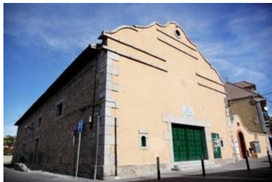
Figura: El Capricho.

El edificio se encuentra en la zona de Villalba Pueblo, para hacernos una idea entre el Ayuntamiento y la Iglesia del Enebral. Está compuesto de una única nave y rodeada por gruesos muros de mampostería. En el interior se siguen realizando actividades culturales y lúdicas.