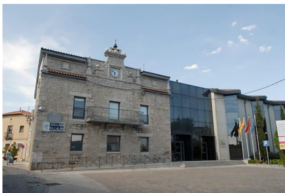
Figura: Ayuntamiento de Collado Villalba.

El edificio antiguo ha sido ampliado recientemente por una parte nueva acristalada de arquitectura moderna. El edificio del Ayuntamiento lleva cumpliendo su misma función desde su construcción, no ha habido otro edificio que la haya desempeñado.