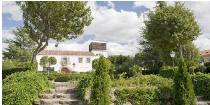
Figura: Casona y Jardín Histórico de Peñalba.

recibe frecuentemente excursiones organizadas de escolares, pero también se puede ir en familia a disfrutar, tomar algo, relajarse y aprender.