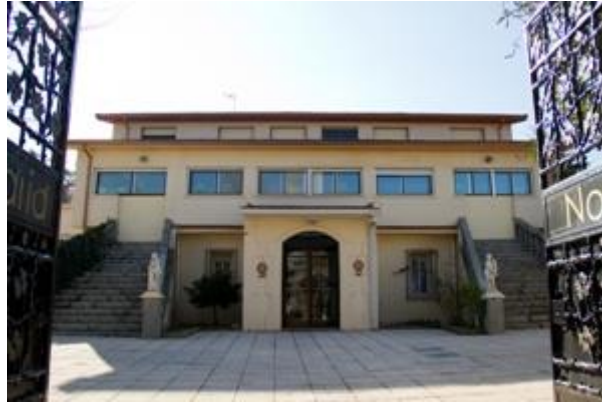
Figura: Casa de vacaciones de Don Manuel Azaña.