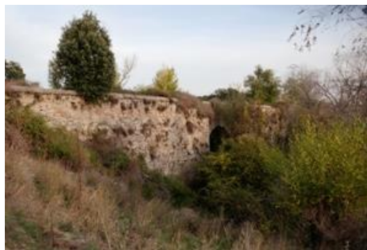
Figura: Puente del Enebral

Su nombre lo debe a los peregrinos que se dirigían hacia Santiago de Compostela desde el sur de la Península, ya que debían atravesarlo para continuar su trayecto. Sus principales rasgos son el arco de medio punto y la anchura de sus paredes.