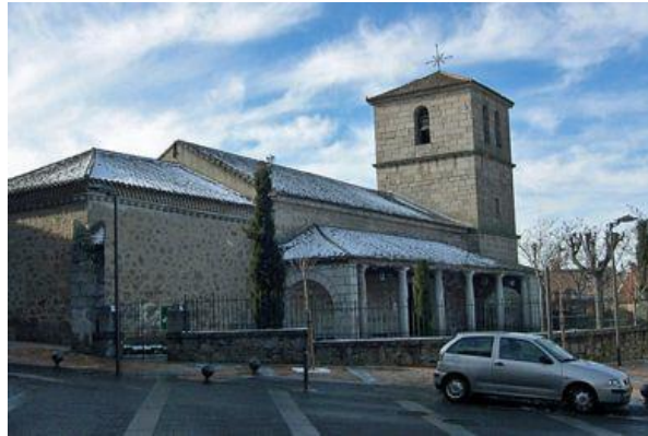
Figura: Iglesia del Enebral.

Durante el período de la Guerra Civil, la iglesia sufrió varios daños. Fue utilizada para varios usos a parte del de iglesia, entre ellos estaba el de garaje, y quedó parcialmente destruida fruto de la guerra. Afortunadamente fue restaurada años después por la Junta Nacional de Reconstrucción de Templos Parroquiales, dando lugar a la iglesia definitiva que perdura en nuestros días.