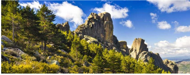
Figura: Parque Regional de la Cuenca Alta del Río Manzanares.