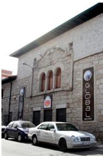
Figura: El Paraíso.

En cuanto a la construcción, está asentada sobre granito blanco total y en la fachada tenemos la entrada formada por tres puertas de acceso adinteladas.