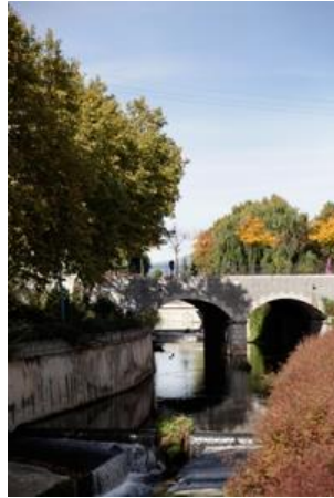
Figura: Puente del Río Guadarrama.