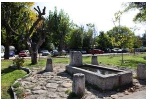
Figura: Pilón de granito.