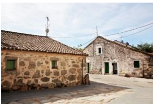
Figura: Casco Antiguo de Collado Villalba.

Merece verdaderamente la pena pasear por las calles del Casco Antiguo villalbino evocando a los antepasados ganaderos del pueblo de ese pasado no tan lejano. Además, hay una amplia y muy buena oferta de bares por las calles que rodean el centro histórico ideales para tomar un aperitivo y/o complementarlo con unas buenas tapas.