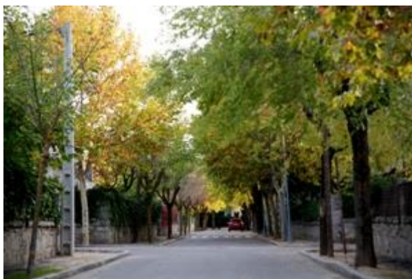
Figura: Colonia del Pilar.