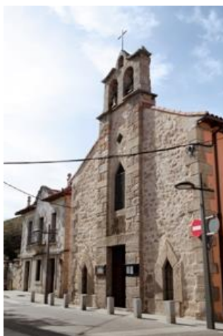
Figura: Ermita de Santiago.