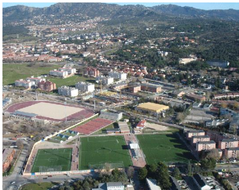
Figura: Ciudad Deportiva de Collado Villalba.

de semana es todo un espectáculo acudir aquí. Podemos disfrutar de muchas competiciones a la vez de distintos deportes sin parar desde la mañana hasta la noche. Es común ver gente de fuera que viene a animar a su correspondiente equipo que compite contra algún club de nuestra localidad. En Collado Villalba tenemos varios clubes y representantes de élite prácticamente en todas las categorías de todos los deportes. Destacar que el equipo de baloncesto jugó en la primera división española en la década de 1950, el de fútbol del club “CUCV Villalba” estuvo cerca de ascender a 2ª División B y los equipos de voleibol masculinos y femeninos compiten en las máximas categorías de la Comunidad de Madrid.