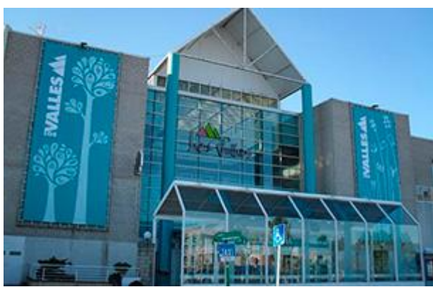
Figura: Centro Comercial “Los Valles”

Actualmente sigue atrayendo a muchos clientes. Y es que, a diferencia del caso anterior, la especialidad de este centro comercial son las tiendas y no el ocio y restauración. Aunque tenga una sección dedicada a la restauración, la mayor parte de negocios son tiendas, mayoritariamente de ropa, destacando algunas como Springfield, Inside o Amichi, entre otras. Tenemos como principal foco el Carrefour, y otro tipo de tiendas que también registran muchas ventas como GAME, Afflelou, una farmacia y negocios de estética y belleza.