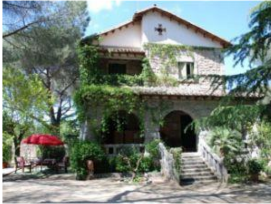
Figura: Mansión de la Colonia Mirasierra.

Merece la pena dar un paseo por esta antigua, lujosa y tranquila colonia para desconectar una mañana; y terminar visitando la Fuente del Caño Viejo y el chopo para enriquecerse culturalmente.