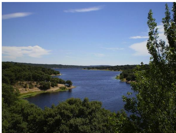
Figura: Embalse de Valmayor.

de alta calidad y popularidad, llamado “La Casona del Pastor”, donde es recomendable comer a mediodía tras haber pasado la mañana en la ruta.