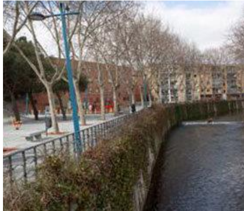
Figura: Parque de Las Bombas. El gorrional.