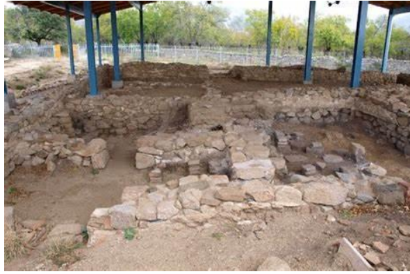
Figura: Yacimiento Arqueológico Miaccum, Collado Mediano.