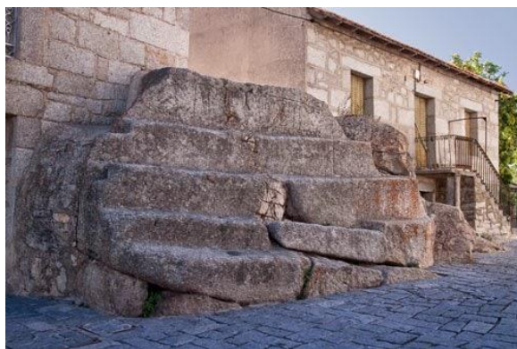
Figura: Piedra del Concejo.

Hoy en día, la roca sigue situada en su posición original, en un rincón de la Plaza de la Constitución al lado del Ayuntamiento. En 1991 fue declarada Bien de Interés Cultural con denominación de Sitio Histórico.