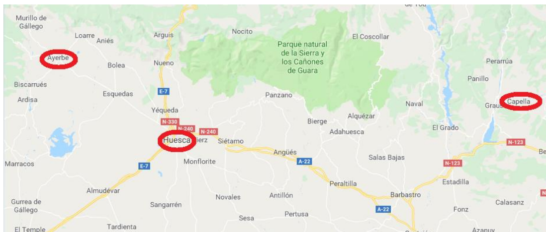
Ilustración 5 Mapa desde google maps que muestra la ubicación de los centros educativos encuestados (elaboración propia).

La encuesta realizada consta de siete preguntas que ayudan a dilucidar si en los centros educativos de la provincia de Huesca ha habido cambios con la incorporación de la LOMCE o no. Los resultados provienen de un centro concertado y dos de carácter público (todos ellos se pueden observar desde el Anexo II hasta el Anexo V).