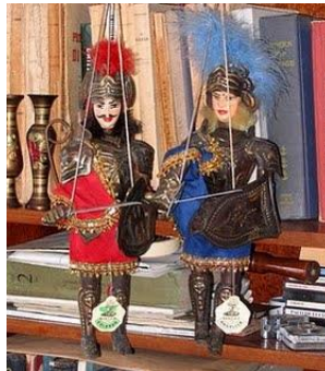
Fig. 5. El Pupi.

Las cabezas y los cuerpos están fabricados con madera y revestidos con armaduras de metal, capas de terciopelo y yelmos emplumados. Protagonizan historias de violencia y venganza referenciadas desde el siglo XVI.