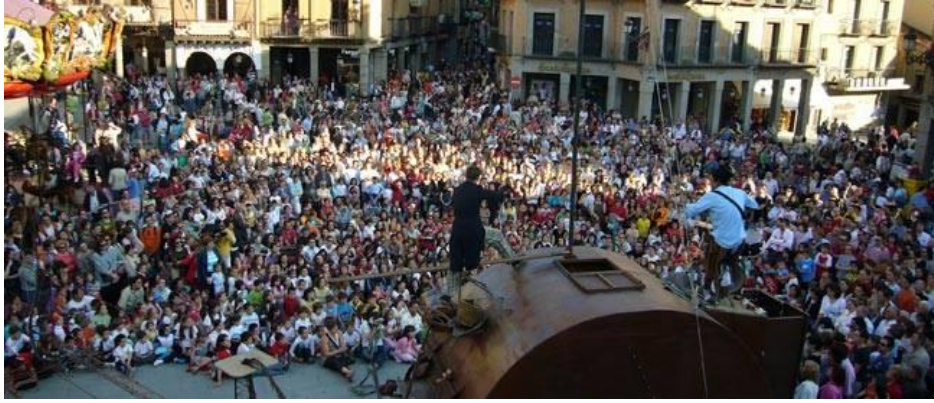
Fig. 14: Plaza del Azoguejo durante el festival.

La contratación de personal en cada edición supone un gran impacto económico directo, entre estos contratos están las compañías, la producción y las empresas de servicios. Además de los contratos hoteleros que se realizan para alojar y proveer a la familia Titiritera. Según la Federación de Empresarios Segovianos (FES) la ocupación hotelera durante el periodo de Titirimundi es del 100%. Además, los estudios confeccionados por el Observatorio Socioeconómico de Segovia atestiguan que Titirimundi es una de las tres demandas principales de Segovia y que es el festival más conocido por los ciudadanos.