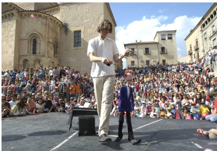
Fig. 11: Función de la edición de Titirimundi 2018.