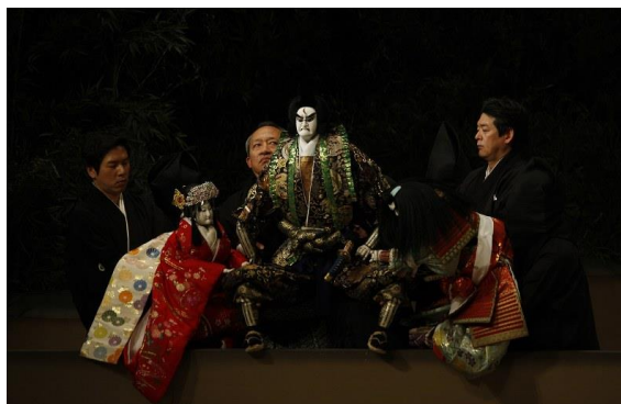
Fig. 7. Bunraku en la obra Ehon Taikoki.

Se manipulaban con tres titiriteros visibles por el público, de 100 a 135 cm de alto de madera hueca para instalar dentro los mecanismos.