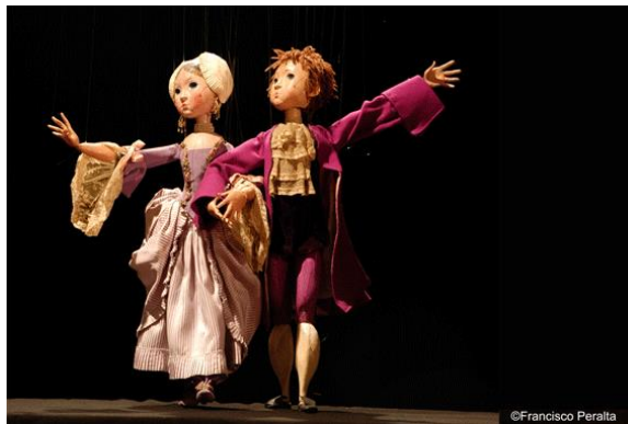
Fig. 13: Bastián y Bastiana.

Los títeres expuestos están fabricados con madera, escayola, tela o incluso con materiales reciclados. En su actual pose rígida custodian lo que un día fue puro movimiento. Este maestro titiritero perfecciona su técnica durante las representaciones que junto a su mujer e hijas realizaron por toda España. Con este museo, Segovia se afianza un poco más como la ciudad de los títeres.