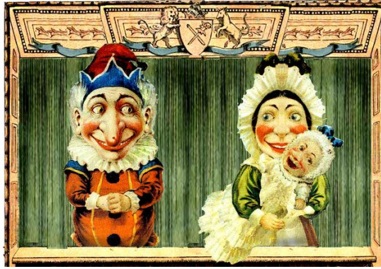
Fig. 2. Punch, Judy y Bebé.