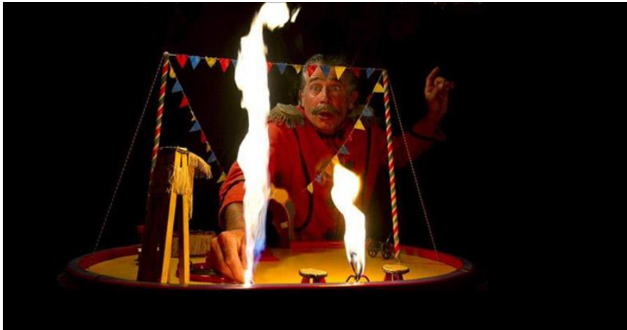
Fig. 12: Circo de las pulgas. Las pulgas salvajes.

Otra apuesta del festival apunta hacia el compromiso con el desarrollo, colaborando con organizaciones que trabajan en países que se encuentran en vías de desarrollo con el objetivo de hacer llegar hasta allí una ayuda social y promover la cultura. Esto se convierte en las dos caras de una moneda, pues al mismo tiempo que Titirimundi colabora con dichos países, estos mismos difunden su riqueza desde el festival. Las dos organizaciones con las que trabaja son la Casa África y la Fundación Hispano Africana para el intercambio cultural y artístico (HAIAC).