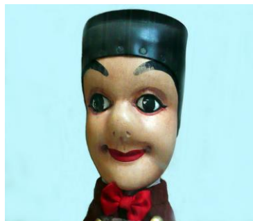
Fig. 3. Guignol.

Cara redonda, nariz pequeña hoyuelos en las mejillas y una pequeña sonrisa. Con ropa de clase obrera, chaqueta marrón con botones dorados y pantalones oscuros (gris o negro). Se dice que protestaba contra la explotación de los obreros pero no existe ningún documento que lo pueda corroborar,