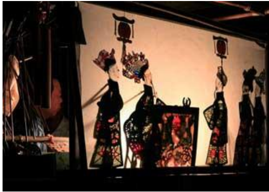
Fig. 6. Sombras chinescas.

Hoy en día sigue siendo un símbolo de la identidad cultural de China.