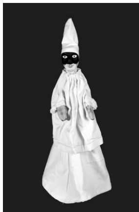
Fig. 1. Pulcinella, de Bruno Leone. Matriz de los polichinelas europeos. Museo del TOPIC de Tolosa.

Se compone de una cabeza de madera tallada y pintada, una bata blanca como vestuario, un gorro de tela y una característica máscara negra. De carácter vulgar e ignorante se representaban en teatrillos, barracas o castillos después de la puesta de sol y se les daba voz con ayuda de una “pivetta” (lengüeta).