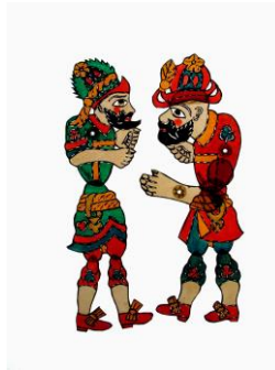
Fig. 4. Karagöz.