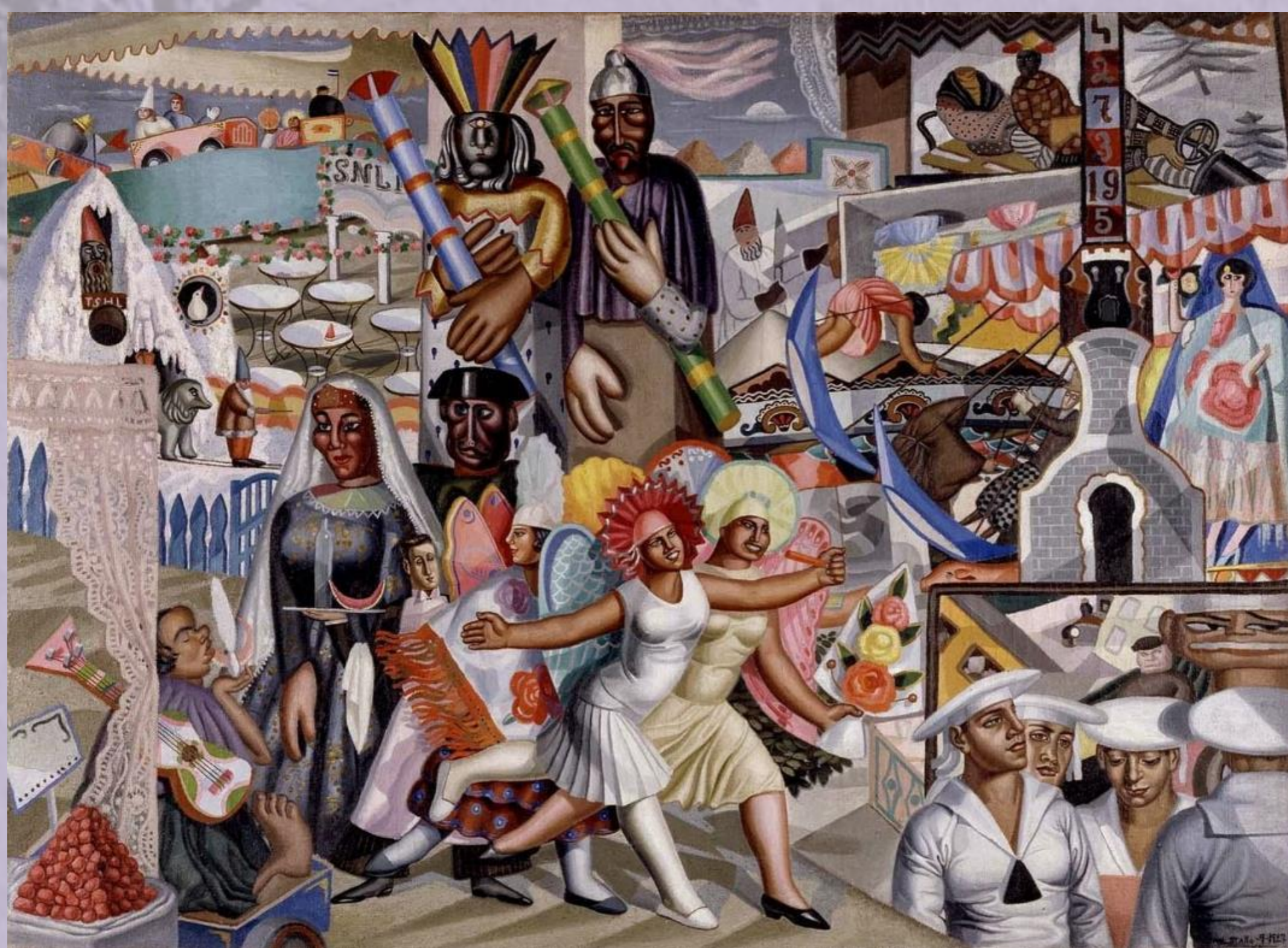
La verbena, 1927

Se convirtió en una de las figuras claves de la Generación del 27. Al estallar la Guerra Civil se marchó a Portugal, donde fue recibida por Gabriela Mistral, quien consiguió ayudarla a escapar. Así comenzó su exilio en Buenos Aires, el cual duraría veinticinco años. Durante su estancia se convirtió en colaboradora de la revista Sur , en la cual también participaba Borges. A finales de la década de los treinta publicó Lo popular en la plástica española a través de mi obra , lo que sirvió para que se decantase por pintar especialmente retratos de mujeres.