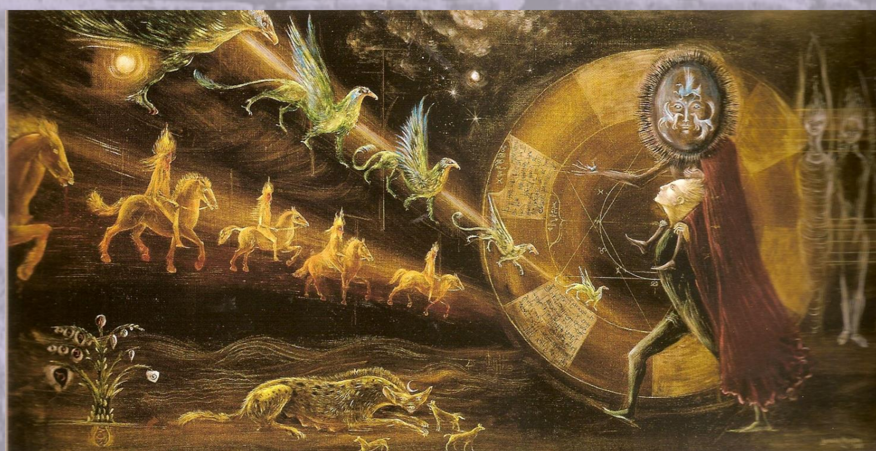
El Brujo, 1966

Artista surrealista inglesa que viajó durante su etapa de formación por París y Londres. Colaboró en un grupo intelectual antifascista. En 1941 se marchó a Lisboa, donde entró en contacto con la embajada de México, país al que se exilió.