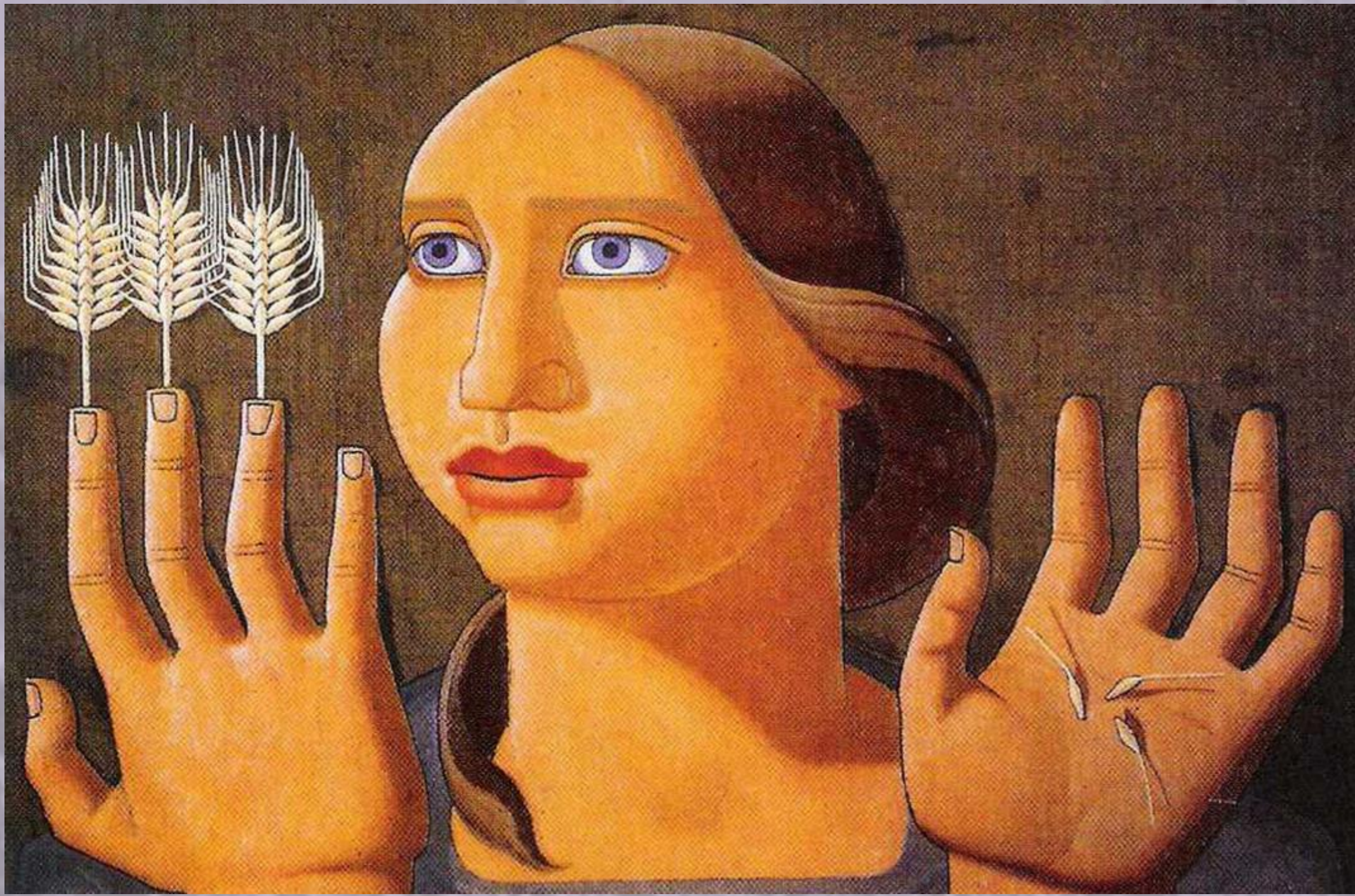
Canto de las Espigas, 1929

Se convirtió en una de las figuras claves de la Generación del 27. Al estallar la Guerra Civil se marchó a Portugal, donde fue recibida por Gabriela Mistral, quien consiguió ayudarla a escapar. Así comenzó su exilio en Buenos Aires, el cual duraría veinticinco años. Durante su estancia se convirtió en colaboradora de la revista Sur , en la cual también participaba Borges. A finales de la década de los treinta publicó Lo popular en la plástica española a través de mi obra , lo que sirvió para que se decantase por pintar especialmente retratos de mujeres.