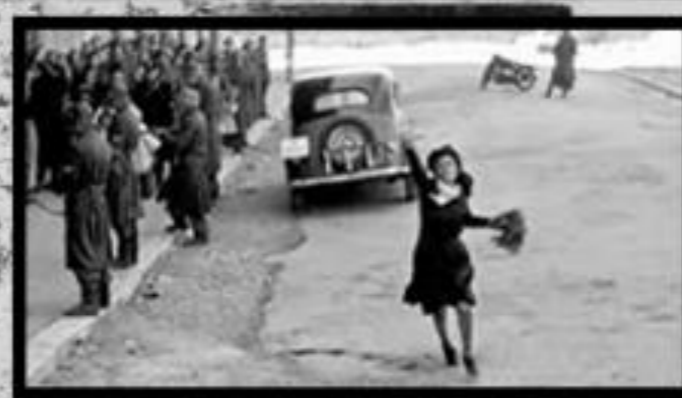
Roma Ciudad Abierta (1969) Roberto Rossellini