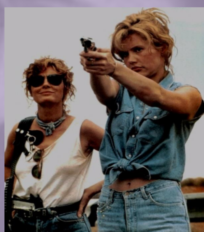
Thelma y Louise (1991) Ridley Scott