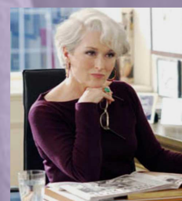
El Diabolo viste de Prada (2006) David Frankel

Asignatura: Historia del cine desde la II Guerra Mundial hasta nuestros días (Grado en Historia del Arte).