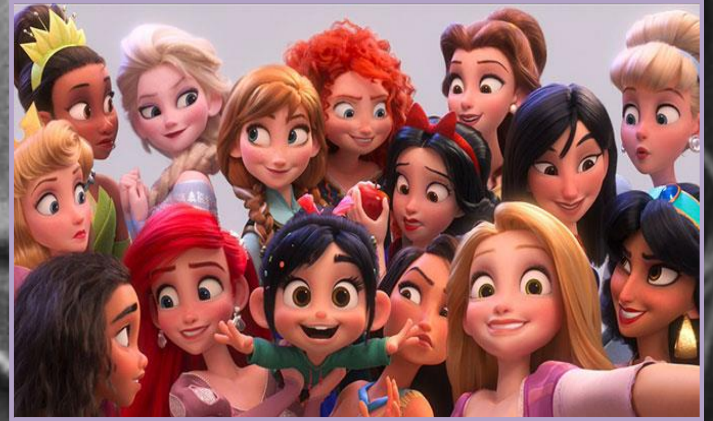
Ralph rompe Internet (Rich Moore y Phil Jhonston, 2018)

Las princesas Disney han sido un referente educativo para las más jóvenes, de tal manera que han evolucionado de forma simultánea al cambio en la mentalidad de la sociedad occidental. En la primera etapa primaba solo la belleza, saber hacer las labores domésticas y debían hallar su "príncipe azul": Blancanieves (1937), Cenicienta (1950) y la Bella Durmiente (1953). En la segunda encontramos a jóvenes rebeldes, que se lanzan a la aventura para luchar por lo que es correcto, hazaña que acaba siendo eclipsada por su relación amorosa: La Sirenita (1989), La Bella y la Bestia (1991), Pocahontas (1995), Mulán (1997). Actualmente, siguen luchando por el bien común, son fuertes y no necesitan de una figura masculina para conseguir sus objetivos tampoco precisan una trama romántica. En definitiva, pasan de ser salvadas a ser las heroínas de la historia. Brave (2012), Frozen (2013) o Vaiana (2016).