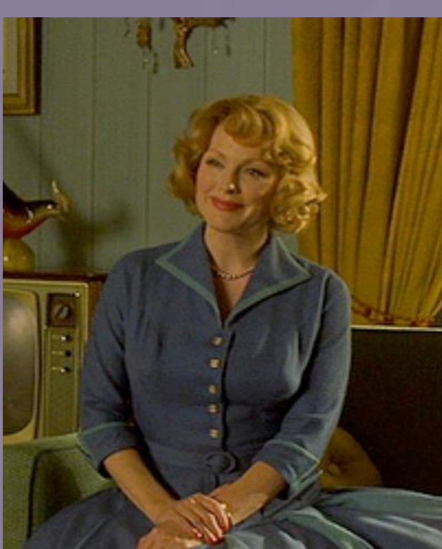
Far From Heaven (2002) Todd Haynes