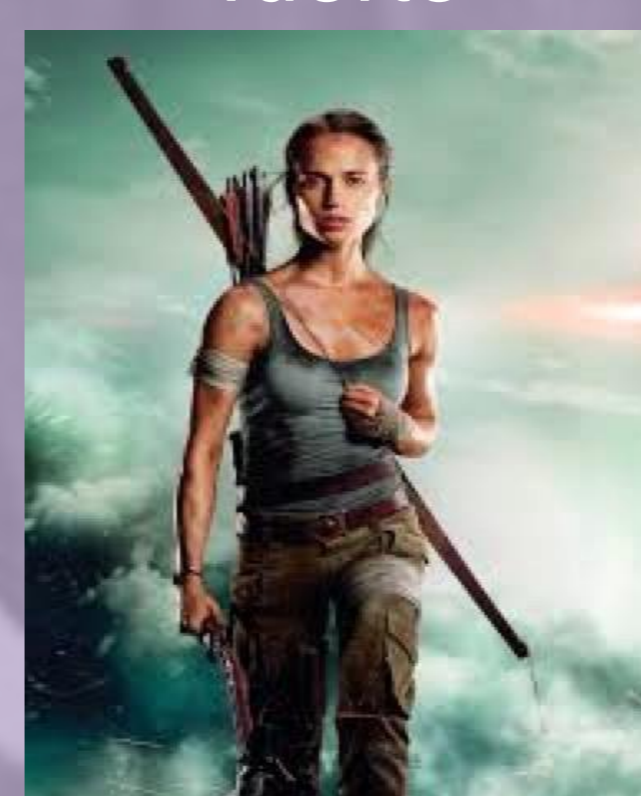
Tomb Raider (2018) Roar Uthaug