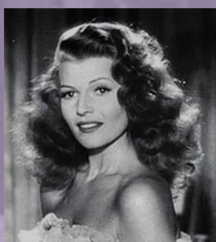
Gilda (1946) Charles Vidor