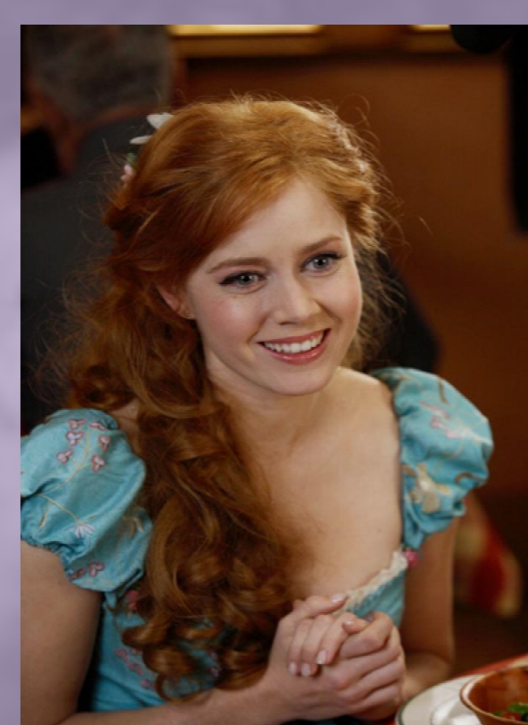
Encantada: La historia de Giselle (2007) Kevin Lima