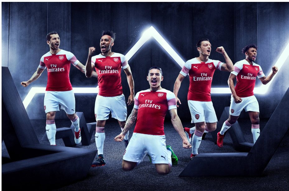
Ilustración 4.6. Campaña publicitaria para presentar la nueva camiseta del Arsenal 18-19. Recuperado en: 10/05/2019. Fuente: https://www.everyfutbol.co/2018/05/nueva-camiseta-del-arsenal-para-la-temporada-2018-2019.html

Fly Emirates se convirtió en el patrocinador principal del Arsenal en el año 2006. Se puede decir que desde el primer momento la aerolínea se volcó con el equipo inglés y un claro ejemplo de ello fue el apoyo económico que le dio para construir su estadio, el Emirates Stadium. El estadio lleva el nombre de la compañía porque compró los derechos del mismo durante los próximos quince años. Fly Emirates aportó el 75% del capital necesario para la construcción del estadio, es decir, una inversión de 115 millones de euros, que fue la más fuerte en el fútbol inglés hasta el momento. El acuerdo entre el Arsenal y Fly Emirates se firmó por 200 millones de libras por patrocinar el estadio y las equipaciones del club.