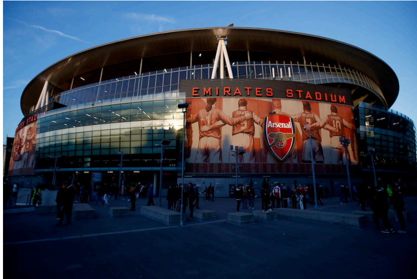
Ilustración 4.7. Emirates Stadium de Londres. Recuperado en: 11/05/2019.

cuenta con otros servicios, como, palcos privados, cafeterías, restaurantes, museo, cajeros automáticos y parking. El nombre del estadio seguirá perteneciendo a la aerolínea hasta el año 2028.