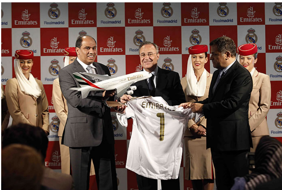
Ilustración 4.3. Presidente del Real Madrid con dirigentes de Fly Emirates. Recuperado en: 27/04/2019.

En la temporada 2012-2013 la entidad blanca terminaba contrato con Bwin , quien había sido su patrocinador principal desde 2007. Fue en 2013 cuando el Real Madrid firma un nuevo contrato de patrocinio con la aerolínea de Emiratos Árabes Unidos, Fly Emirates .