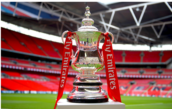
Ilustración 4.1. Trofeo de la Emirates FA Cup. Recuperado en: 19/05/2019.

Desde 2015 el principal patrocinador de esta competición es la aerolínea Fly Emirates, es la compañía la que da nombre a la nueva competición; Emirates FA Cup . La aerolínea tiene acuerdo hasta 2021 para ser el principal patrocinador de la competición. Desde que la compañía se ha hecho con los derechos de la competición se ha hecho muchas iniciativas para promocionarla, por ejemplo; en 2016 se hizo una gira del trofeo de la competición por África y en 2017 se volvió a llevar a nuevos países, durante este último año en el mes de abril la compañía presentó algunos de sus aviones decorados con motivo de la FA Cup.