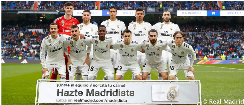
Ilustración 4.4. Plantilla del Real Madrid con la equipación oficial. Recuperado en: 02/05/2019. Fuente: https://www.realmadrid.com/noticias/2019/01/horarios-de-la-20a-jornada-de-liga

El éxito del contrato de patrocinio de Fly Emirates, además de los logros conseguidos en el terreno de juego por parte del conjunto blanco, también se debe en gran parte a las acciones y campañas realizadas por la aerolínea.