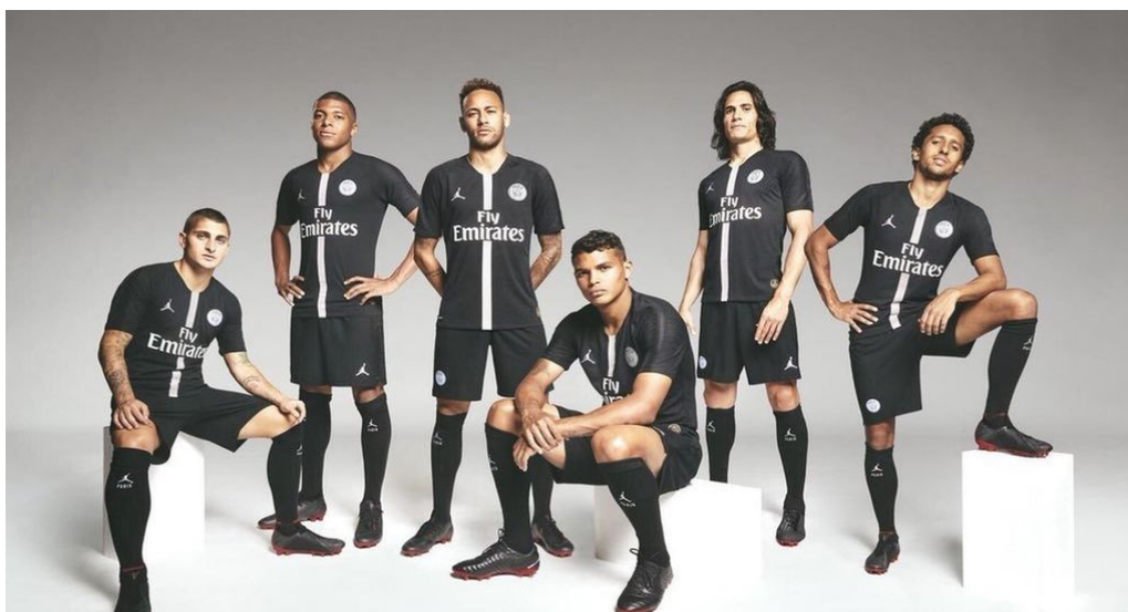
Ilustración 4.9. Campaña publicitaria para presentar las nuevas camisetas del PSG. Recuperado en 02/06/2019.

– Germain hasta el final de la presente temporada, la 2018 – 2019 y el equipo parisino recibe veinticinco millones de euros por temporada de la aerolínea por el patrocinio de su camiseta.