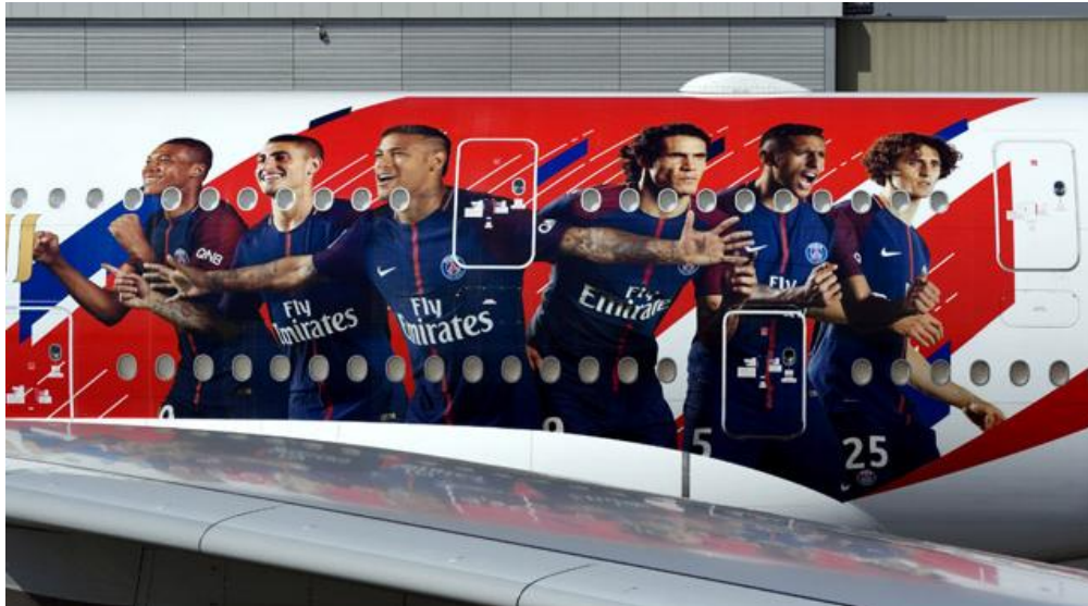
Ilustración 4.10. Avión de Fly Emirates personalizado con jugadores del PSG.

Una de sus últimas campañas ha sido lanzada por Fly Emirates y era un spot en el que se nos mostraba el interior del avión del Paris Saint – Germain. En el spot se podía ver a jugadores de la primera plantilla, como Thiago Silva y Neymar ejerciendo de pilotos y a otros como Cavani, Rabiot o Verratti como personal del avión junto a azafatas de la compañía.