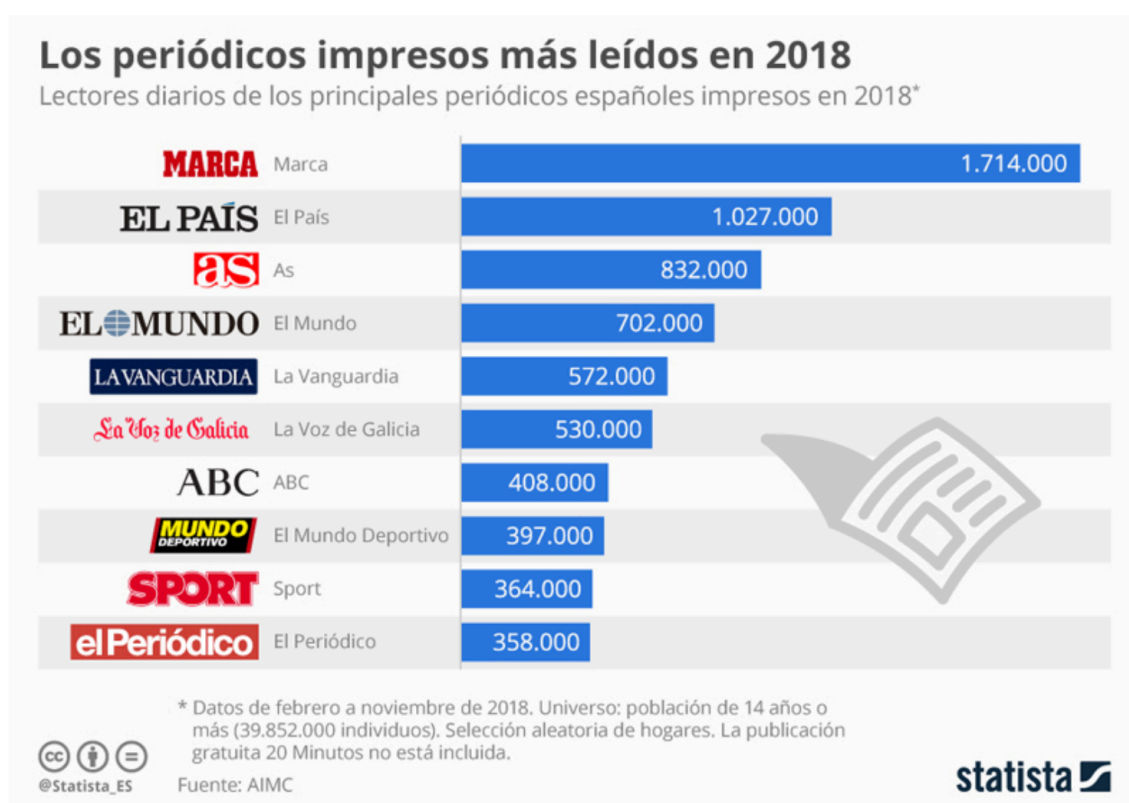
Gráfica 1.1. Fuente: EGM, Datos de febrero a noviembre de 2018

En el ámbito de la prensa, hay que destacar que cuatro de los diez periódicos más leídos en España son de información deportiva, según la Encuesta General de Medios. Dentro de este tipo de información, el fútbol ocupa más del 50% de las noticias deportivas. El diario con mayor número de lectores es el diario Marca, con una media de 1.714.000 seguidores diarios, lo que representa un 16% del total de lectores en España (16.124.000).