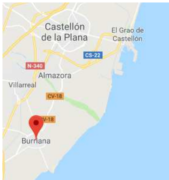
Imagen 1. Localización Burriana (Castellón)

El festival Arenal Sound tiene lugar cada año desde 2010 en la localidad de Burriana, al sur de la provincia de Castellón, perteneciente a la Comunidad Valenciana.