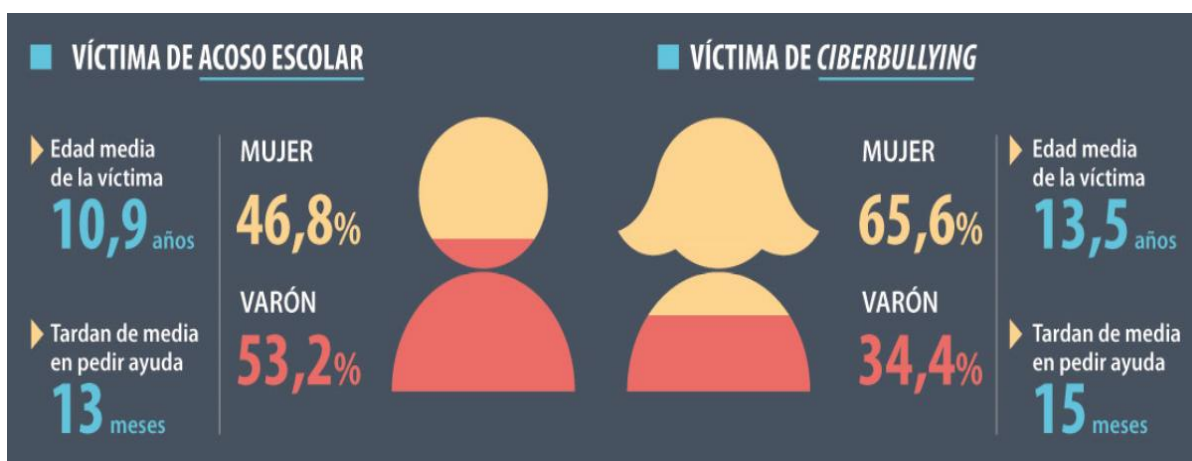
CUADRO 2. Estudio basado en 36.616 llamadas recibidas y atendidas en 2017 por el teléfono ANAR 2017 sobre acoso escolar y cyberbullying

Siguiendo con los datos estadísticos y teniendo en cuenta las conclusiones del III Estudio anual sobre Acoso Escolar y Cyberbullying (2017), realizado por la Fundación Mutua Madrileña y la Fundación ANAR, vemos que tal y como muestra la siguiente imagen, las mujeres son las que más sufren Cyberbullying y como en relación con el Acoso Escolar la edad media y el tiempo que tardan en pedir ayuda los agredidos es mayor.