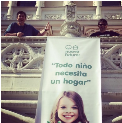
ANEXO 1. Logo Nuevo Futuro