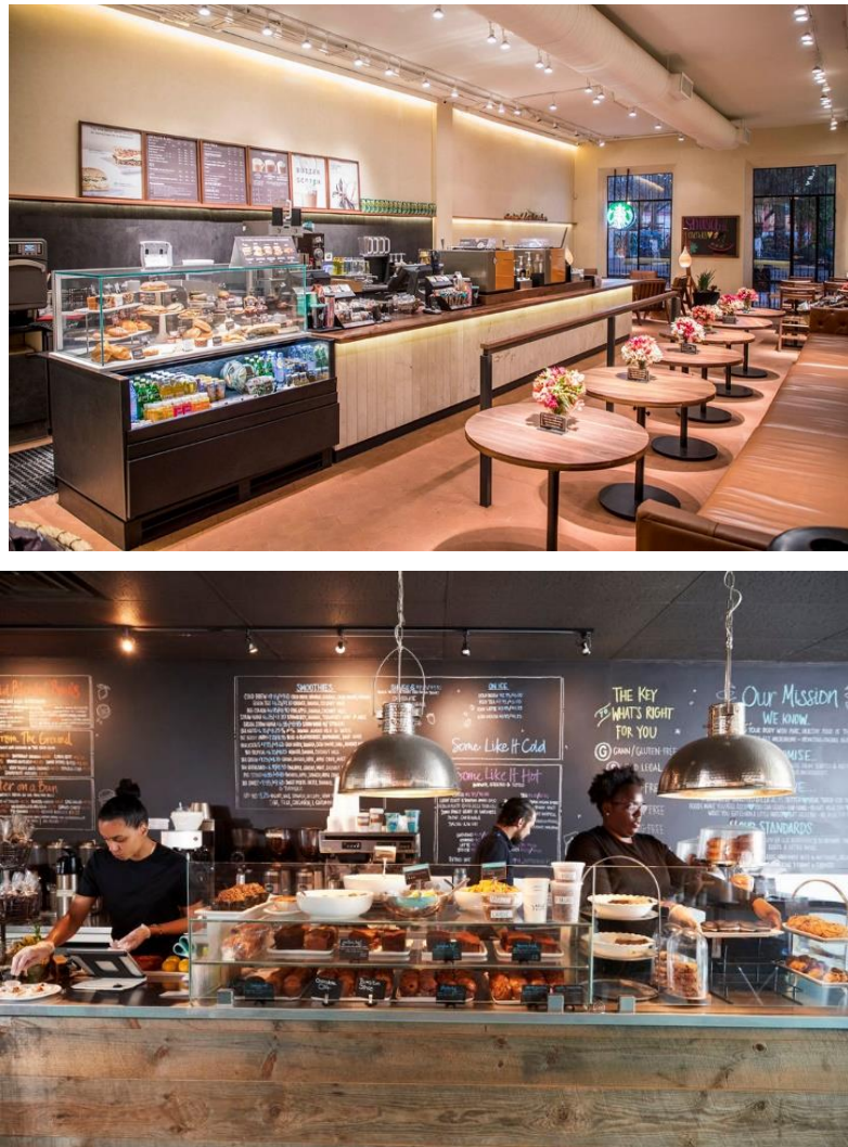
Ilustración 2: Imágenes de la cafetería para la elaboración del proyecto de señalización y prevención.