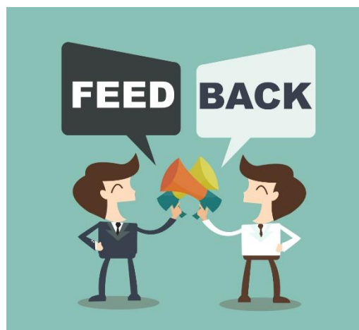
Ilustración 5: El feedback.

El feedback es un término que tiene que ver con la comunicación. Es una palabra inglesa que significa retroalimentación. En el contexto de este trabajo, se podría definir como la medida en la cual las personas reciben información sobre cómo están haciendo su trabajo. No se debe tomar nunca como un ataque o algo negativo, sino que se debe interpretar como un “regalo” que la otra persona nos da, ya que eso nos ayudará a mejorar la calidad del trabajo.