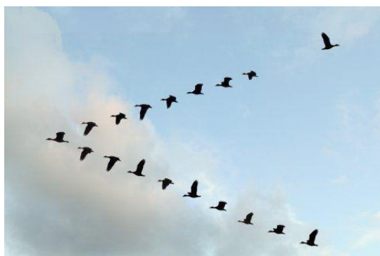
Ilustración 1: Forma de vuelo de gansos.

Cuando una gansa o ganso enferma o queda herido, dos de sus compañeros se salen de la formación y le siguen para ayudarlo o protegerlo. Se quedan con él hasta que esté nuevamente en condiciones de volar o hasta que muera. Sólo entonces los dos compañeros vuelven a la bandada o se unen a otro grupo.