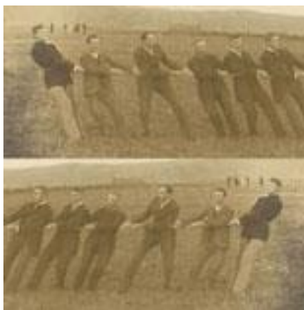
Ilustración 2: Juego de la soga.