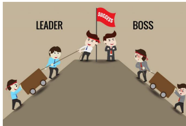
Ilustración 3: Diferencia entre líder y jefe.