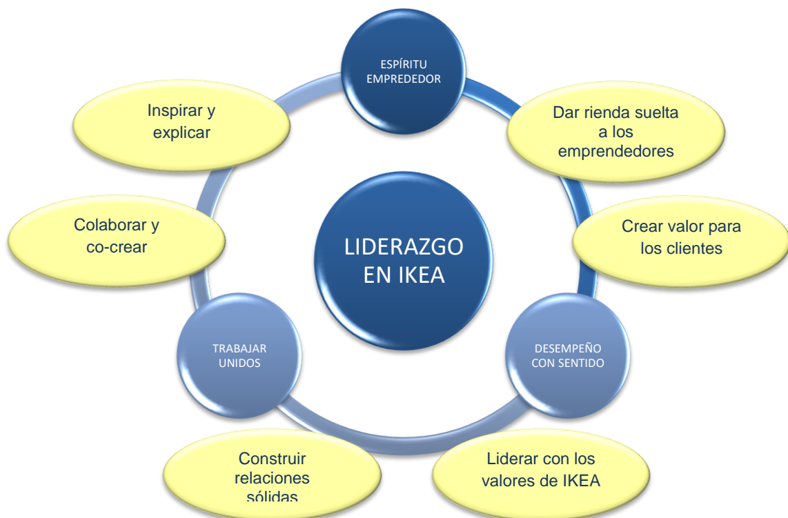
Ilustración 6: El liderazgo en IKEA.

Los líderes de IKEA se comprometen a crear un mejor IKEA para todos, tanto trabajadores como clientes. Para ellos, ser líder supone dar lo mejor de uno mismo en muchas situaciones. Los temas del liderazgo en IKEA son el espíritu emprendedor de la mayoría de las personas, desempeño con un sentido y trabajar unidos. Las capacidades de liderazgo de cada uno de estos temas son vitales para centrar todos los esfuerzos en la misma dirección.