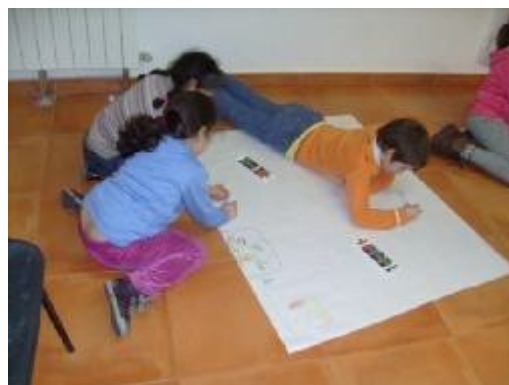
17. "Proceso", Autor: Creación colectiva.

Objetivos: Establecer un contrato grupal donde los niños y niñas se comprometerán a cumplir con unas pautas de convivencia armónica dentro del taller, estas putas en conjunto las definiremos y las trabajarán en grupo. Crear un ambiente de escucha y el respeto. Estimular en los niños valores positivos que nos llevarán la buena convivencia dentro del taller. Inicio: En un círculo sentado en el suelo cada uno de los niños y niñas este será un espacio de escucha donde cada uno podrá expresar como se encuentra en ese momento y también podrá compartir lo que les apetezca. Desarrollo: En conjunto definiremos las pautas de