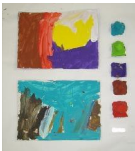
13. "Pintura y reciclaje", Autora: Mónica.

Tiempo de desarrollo: 45 minutos. Objetivo: Que los niños experimenten con materiales reciclados. Estimular su auto regulación al tener libertad de creación. Inicio: Se da el espacio para que comenten como han sido las vacaciones, luego