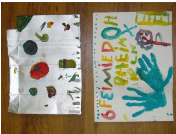
1. Creación en arcilla “fe i miedo”, Autora: Ana.

Por ello, las necesidades que fueron detectadas eran distintas a pesar de tener edades similares y que se realizaron actividades similares.