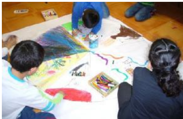
20. "Proceso Mándala", Autora fotografía: Almudena Toledano.

Mándala: Representación esquemática de un macrocosmos y del microcosmos. En el budismo e hinduismos es un espacio sagrado centro del universo y soporte de centro. La forma concéntrica, nos lleva a la idea de perfección. Objetivos: Que los niños desarrollen una creación colectiva. Genera una conciencia de la individualidad dentro de un grupo. Desarrollo de competencias sociales con respecto al trabajo en colectivo. Inicio: Momento de ponerse en situación, lograra la clama en el grupo para que estén receptivos con respecto al inicio de la actividad. Les preguntare si saben que es un mándala, y en función de lo que ellos ya saben les hablare sobre que es un mándala. Desarrollo: La actividad consiste en la realización de un mándala colectivo, generando así un espacio de creación grupal. Y de materialización de este grupo. Cada niño tendrá su sección del mándala. A la vez la creación de cada uno no funciona como si no existe la creación del otro. Cierre: Se comentará la actividad, se les preguntará que les ha parecido realizarla. Se trata de hacer un análisis sobre que cada uno es un pequeño mundo que es parte de otro mundo mucho más grande y a su vez es parte de un universo.