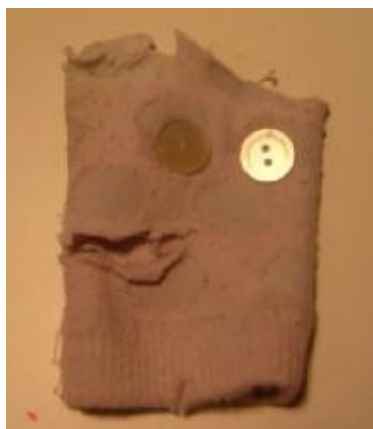
7. “Títere” Autora: Mónica.