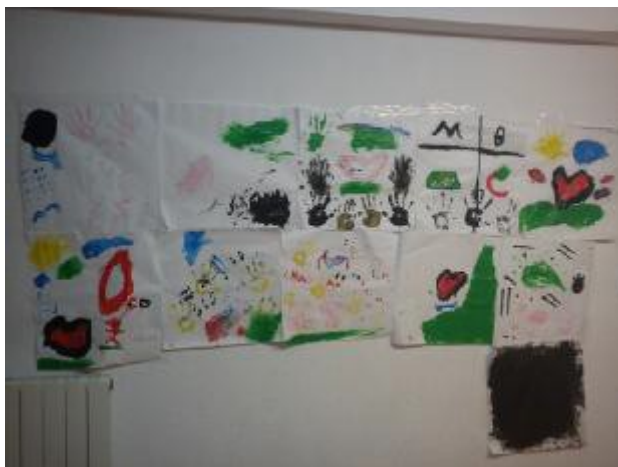
21. "Cierre", Autora de la fotografía: M.I. Zamorano.

Objetivos: Realizar un cierre del ciclo de talleres que hemos realizado. Generar una conversación en torno a que los procesos en la vida tienen un inicio y un fin. Inicio: Es el momento de usar la palabra tendrán que resumir en una palabra como se encuentran en ese momento. Desarrollo: Cada niño con un folio grande se expresaran pictóricamente con pintura de dedo, lo que más les ha gustado de los talleres y lo que menos les ha gustado. Con esta creación se despedirán del taller de Arteterapia. Cierre: en un círculo compartirán su creación con sus compañeros, uniremos todas las obras y en este acto simbolizaremos la unión del grupo.