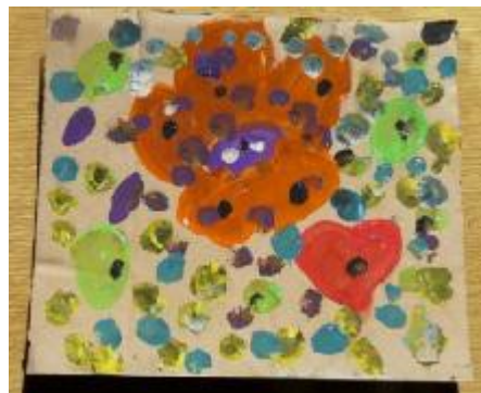
5. "Empatía", Autora: María