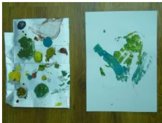
11. "Arcilla pintada", Autora: Andrea.

Tiempo de desarrollo: 45 minutos. Objetivo: Explorar la pintura pero desde una figura escultórica, que ellos mismos modelaron en la sesión anterior. Inicio: En un ambiente de calma los niños harán ejercicios un pequeño ejercicio de relajación, con una música de la naturaleza. Desarrollo: Sobre las figuras que realizaron la sesión anterior en arcilla, les pondrán color con temperas se les entregaran solo 3 colores con los cuales trabajar: rojo, amarillo y azul. Esto con el fin de al tener menos variedad puedan centrarse en el proceso más que en elegir un color, también que puedan experimentar mesclar los colores. Limitarlos para que puedan expandirse en otro plano. Cierre: se pretenderá que los niños le pongan una emoción a los colores que han utilizado en sus obras, y una emoción que les venga sobre el proceso de creación.