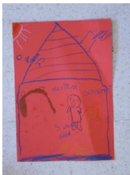
14. “La casa”, Autora: Sara.

Sesión 10: “Cierre final, material reciclado”