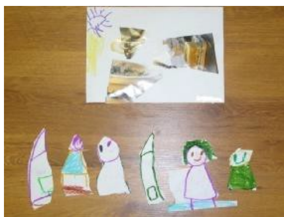
12. "Collage", Autora: Belén.