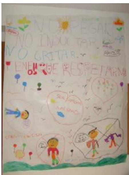
16. "Contrato", autor: Creación colectiva.

Sesión 2: "Pautas de convivencia armónica."