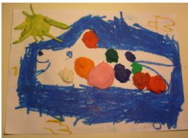
9. "Delfín", Autora: Estrella.

Tiempo de desarrollo: 45 minutos. En la sesión anterior se toma la decisión en conjunto con la psicóloga que el grupo se dividiera en dos para poder atender de mejor manera sus necesidades durante el taller y por lo tanto las sesiones tendrán menos duración. Objetivo: Que los niños puedan simbólicamente describir como es el entorno en donde viven de manera simbólica por medio de el animal que ya