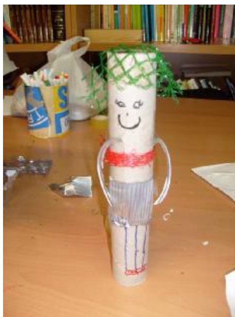
18. "Mi personaje, Autora: Carmen.

Objetivos: Hacer una reflexión sobre, como podemos crear desde la reutilización y la destrucción de un material para luego crear. Generar que desde la creación de un personaje ficticio, simbólicamente podrán expresar su mundo interno, su visión de sí mismos como niños. Inicio: Conversación grupal de lo que ha sucedido durante esta semana en que no se ha realizado taller. Este espacio es de ponerse en situación, y en disposición al trabajo. Desarrollo: Cada niño creará con materiales reciclados un personaje, al que tendrán que ponerle un nombre. Luego