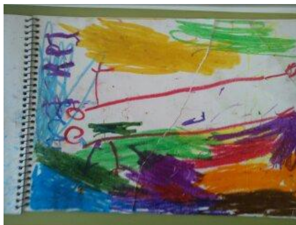
3. Imagen: "El dinosaurio pequeñito". Autora: Estrella.