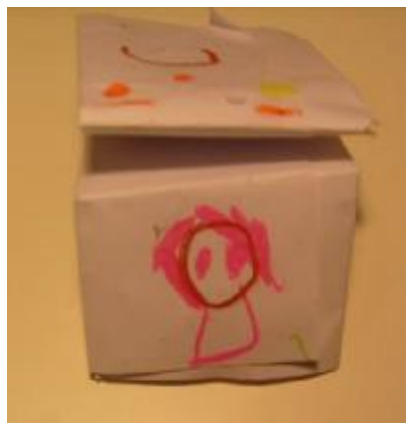
8. “Títere de Papel”, Autora: Mónica.

Tiempo de desarrollo: 1:15 minutos. Para seguir trabajando en la exploración de cada niño como persona independiente del grupo realizare una actividad continuando el trabajo de los animales de la primera sesión. Objetivo: Explorar el mundo interno de cada niño y su relación con su entorno. Inicio: En un círculo