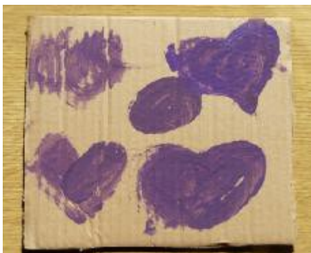
4. "Cariño", Autora: María