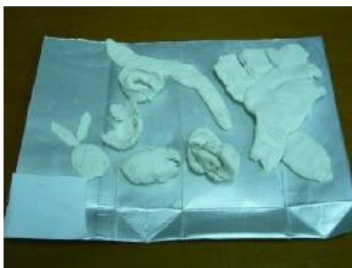
10. "Arcilla libre", Autora: Sara.

Tiempo de desarrollo: 45 minutos. Objetivo: Estimular la creatividad. Durante las sesiones anteriores he detectado que les cuesta en general crear libremente, están acostumbrados a que se les diga cada cosa que tiene que hacer, a modo de prueba, realizare esta actividad libre y no pauteada. Inicio: Sentados en un círculo cada niño tendrá un momento para hablar de cómo se siente, tienen el espacio de poder expresar verbalmente lo que quieran. Desarrollo: Con una música relajante, les hare un pequeño ejercicio de relajación, donde cerraran los ojos y la consigna es: oler la flor (para inspirar) y soplar la vela (para botar el aire). Con esta dinámica pretendo que los niños se relajen y se centren en el momento (duración 3 minutos). Luego les entregare un trozo de arcilla donde se podrán experimentar y expresase libremente. Cierre: A cada uno se le preguntará como se han sentido