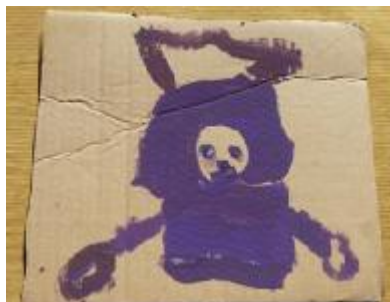
6. "Respeto", Autora: María

Tiempo de desarrollo: 1:15 minutos. La actividad se planificó con una modificación del encuadre se redujo el tiempo de la sesión a una hora y quince minutos. Objetivo: Desarrollar los siguientes tres valores: Empatía, Respeto, Cariño, con el fin que los niños comprendan la importancia de los valores ya mencionado, y se comprometan a llevarlos a cabo en el taller. Inicio: En un círculo sentado en cojines, se conversa sobre cómo han estado durante la semana que no hubo taller, les explico adecuado a su edad que es el Arteterapia. Desarrollo: se conversará sobre los tres valores y ellos dirán que entienden de ellos. Luego en un cartón pintarán tempera lo que entienden o sienten sobre cada uno de los valores. Cierre: Por medio de expresión corporal expresan cada uno de los valores, la dinámica será en grupo.