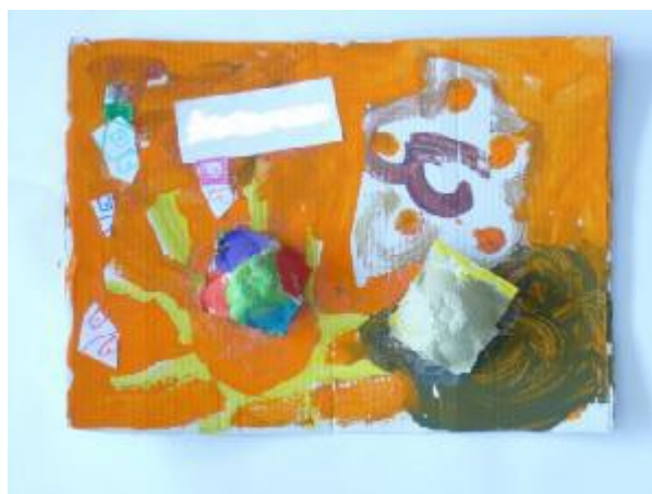
13. "Sol", Autor: Carlos.

Tiempo de desarrollo: 45 minutos. Objetivo: Iniciar el proceso de cerrar el ciclo de los talleres, haciendo un recorrido por los recuerdos de las actividades y materiales que más les ha gustado y las que menos les han motivado. Inicio: Comienzan hablando un poco de los trabajos que realizaron la sesión anterior, como se han sentido, con que han disfrutado mas y con el que menos disfrutaron. Desarrollo: En un papel continuo realizarán una creación colectiva donde los niños podrán expresar plásticamente lo que les ha gustado y lo que menos les ha gustado de los talleres. Cierre: Sentados en un círculo los niños podrán expresar verbalmente, que les ha parecido la actividad, que han sentido, como se han sentido en la realización de la actividad.