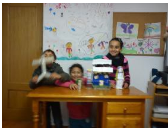
19. “La historia”, Autora de fotografía: Zamorano. M.I.

Objetivos: Que los niños creen una historia con los personajes que realizaron la sesión anterior. Estimular la capacidad de trabajo creativo en grupo. Generar una reflexión en torno a la importancia que tiene el ser creativos y la originalidad que tiene cada uno en sus creaciones, son reflejo de las individualidades de cada uno como seres especiales e irrepetibles. Inicio: Este momento es el de utilizar la