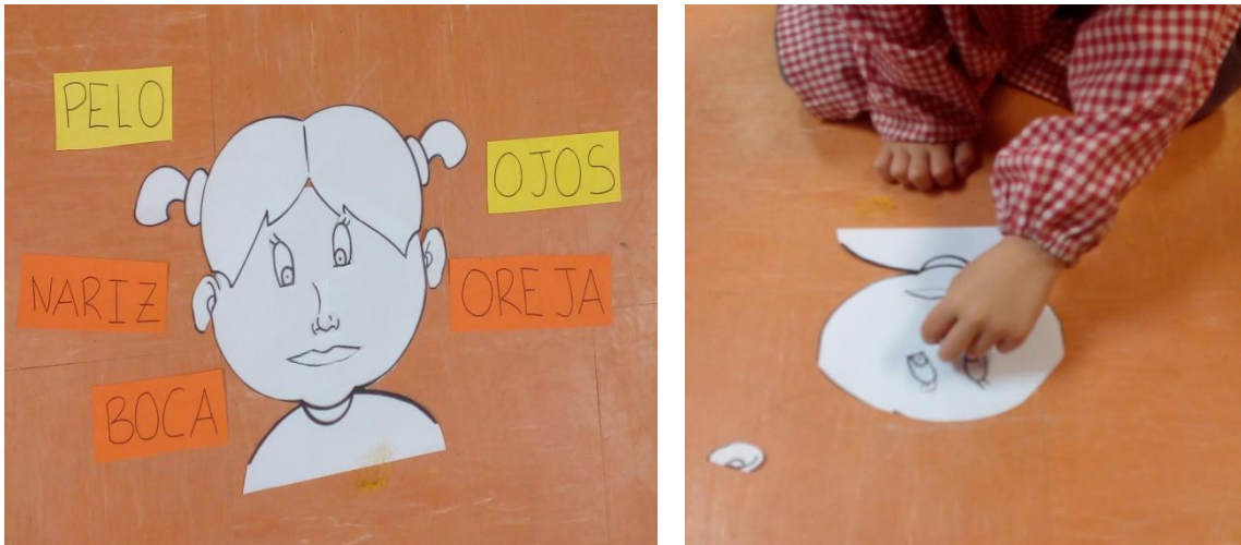
Figuras 3 y 4: muñeco desmontable de las partes de la cara.