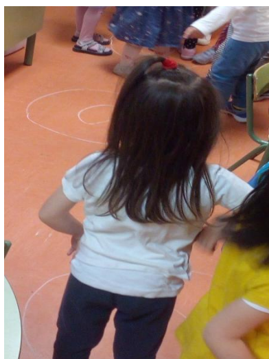
Figuras 12 y 13: realización de la actividad.