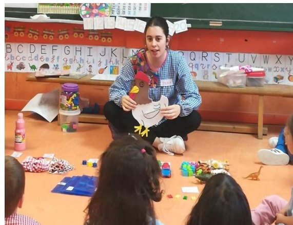
Figuras 7 y 8: realización del conteo.