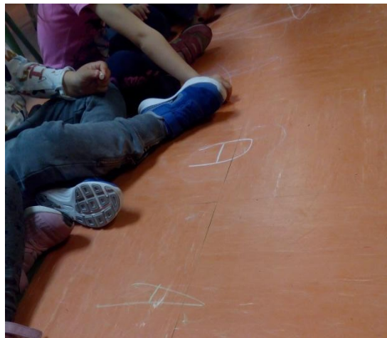
Figuras 9 y 10: muestras de escritura de vocales a partir de su vocalización.