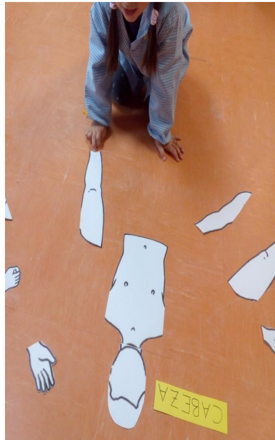
Figuras 1 y 2: muñeco desmontable de las partes del cuerpo.