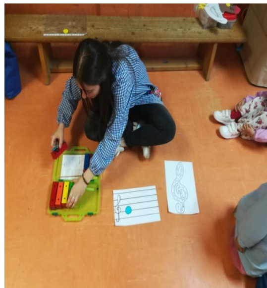
Figura 15: preparación de la actividad.