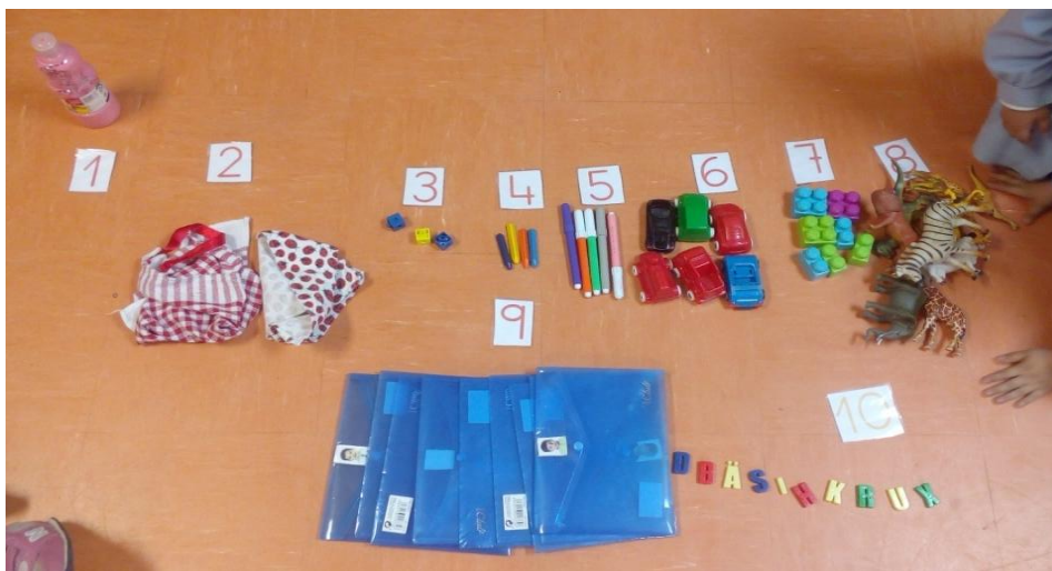
Figura 6: actividad previa al conteo del 1 al 10