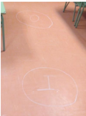
Figura 11: disposición de la clase para la actividad.