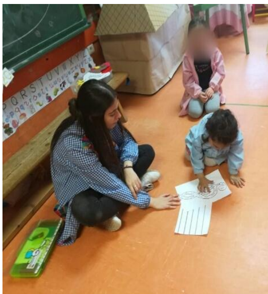
Figura 14: conociendo la clave de Sol.