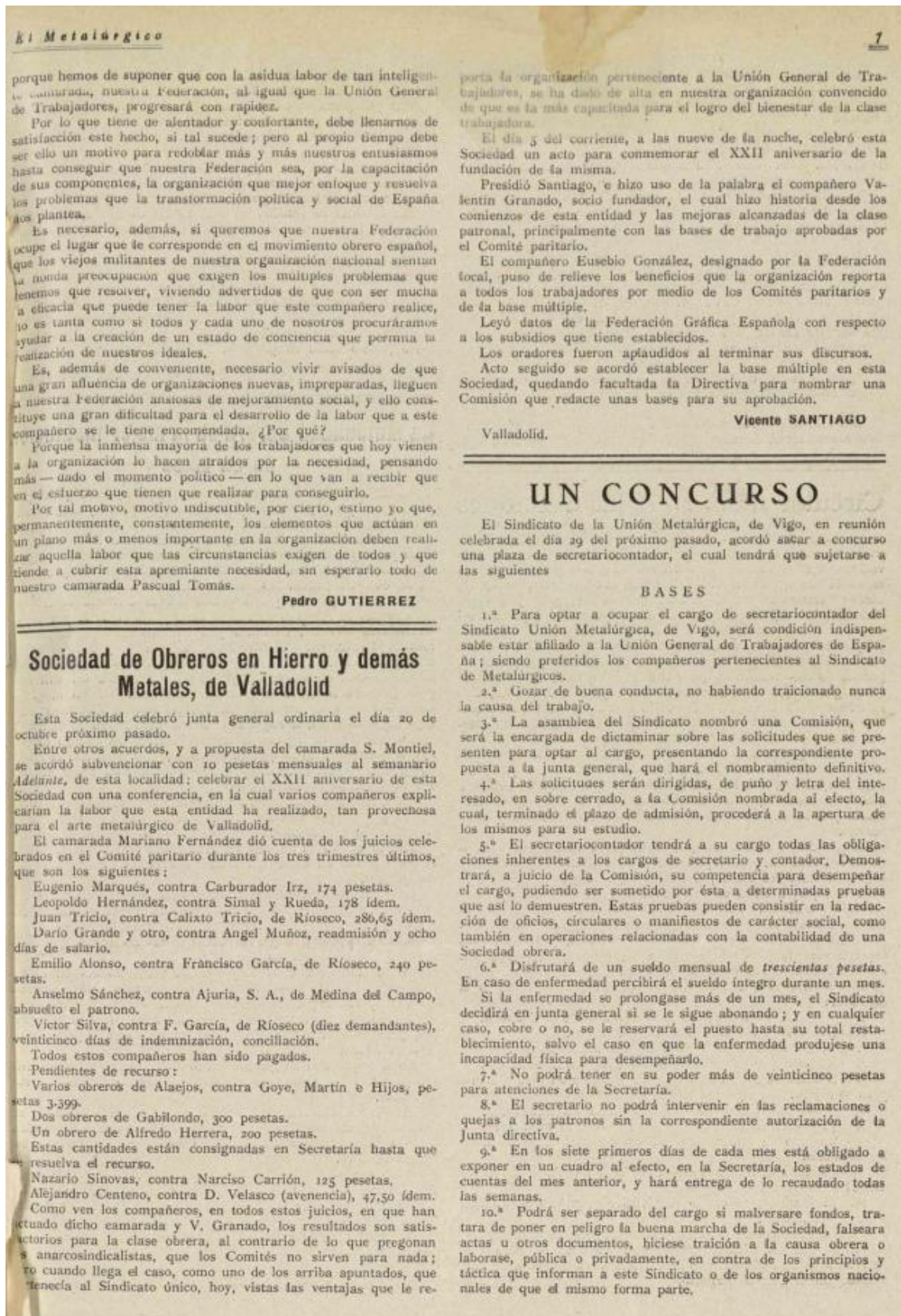
Figura 20: Periódico madrileño El Metalúrgico . Sociedad de Obreros en Hierro y demás Metales de Valladolid .