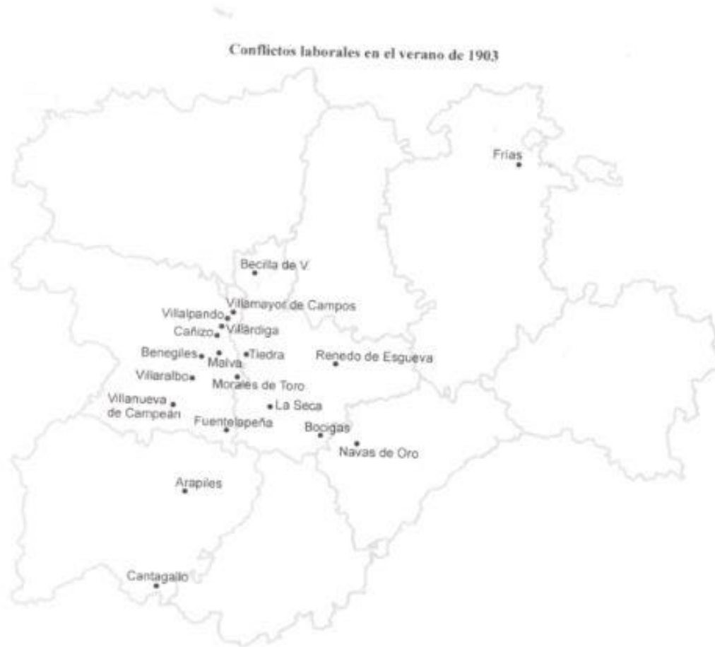
Figura 14: Conflictos laborales en el verano de 1903 en Tierra de Campos.

Fuente: REDONDO CARDEÑOSO, Jesús Ángel, 1904: Rebelión en Castilla y León , Valladolid, Universidad, 2013, p. 43.