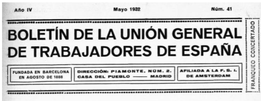
Figura 2: Boletín de la Unión General de Trabajadores , mayo de 1932 (número 41)