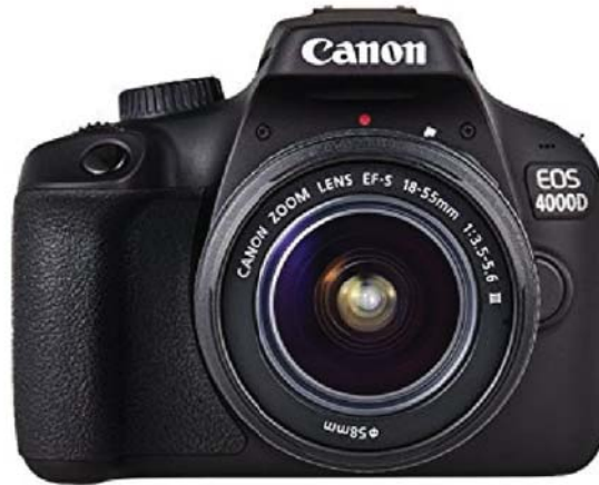
Figura 4. Cámara Canon 4000D