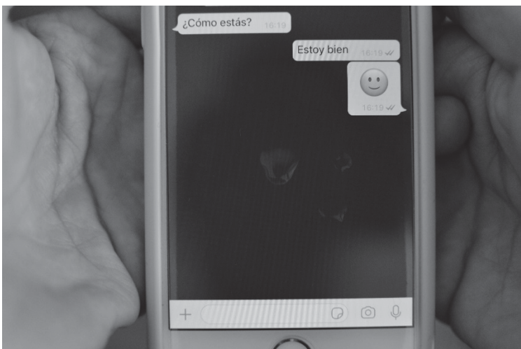
Figura 11. Emoticonos / sentimientos