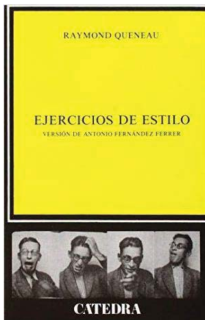
Figura 1. Portada de la obra Ejercicios de estilo 4

No se trata solo de los distintos estilos que en la obra se dan cabida, sino que en ocasiones el autor crea otros nuevos, ya sea jugando con las vocales, las consonantes, las rimas o el propio ritmo de los versos, a modo de deleite individual y colectivo. Gracias a esta obra pude corroborar las distintas piezas que componen un mismo fragmento y el abanico inmenso de posibilidades a la hora de querer mostrar algo al público. Un mismo arte, en este caso la literatura, puede resultar infinito si se profundiza lo suficiente.