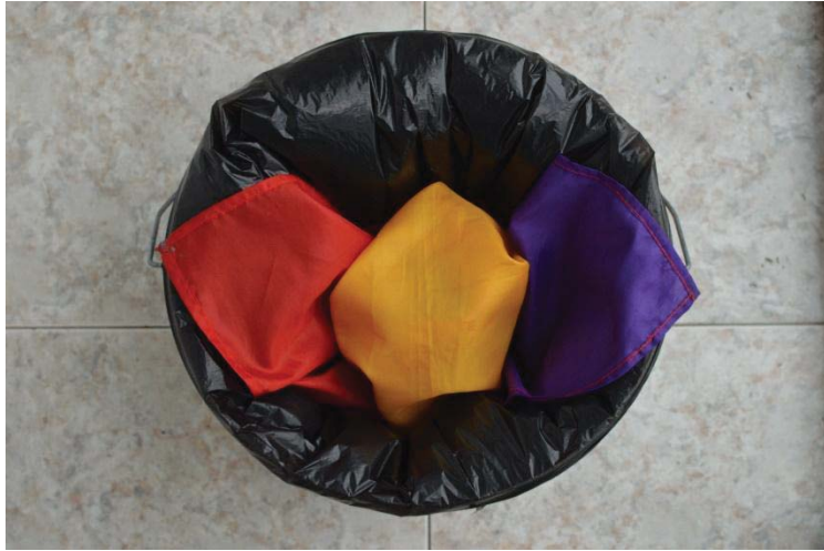
Figura 9. Diversidad de ideologías