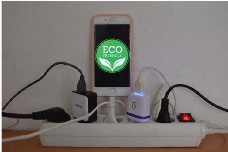
Figura 10. Consumo energético