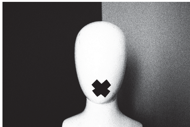
Figura 3. Imagen inicial del trabajo

La imagen inicial responde fundamentalmente a un criterio expresivo. Como he puesto por escrito anteriormente, mi fotoreportaje realizado para la asignatura de Fotoperiodismo abarcó los maniqués de los escaparates como sujetos de la acción. Se trata por tanto de una referencia-homenaje a un trabajo que figura como el punto de partido básico para este proyecto. Es la única fotografía de todo el trabajo que ha sido quemada o sobreexpuesta a través del menú de la cámara Canon 4000D por una cuestión de estética. Para su realización, la única descrita en este documento expresamente 8 , utilicé una cinta adhesiva de color negro y la empleé a modo de mordaza. El resultado es bastante tétrico, pues quería jugar con el contraste del busto blanco del maniquí y el color negro de la cinta, algo que he acentuado aún más con las opciones de la cámara.