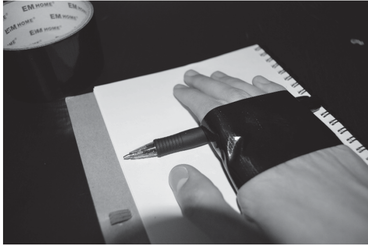
Figura 12. Autocensura