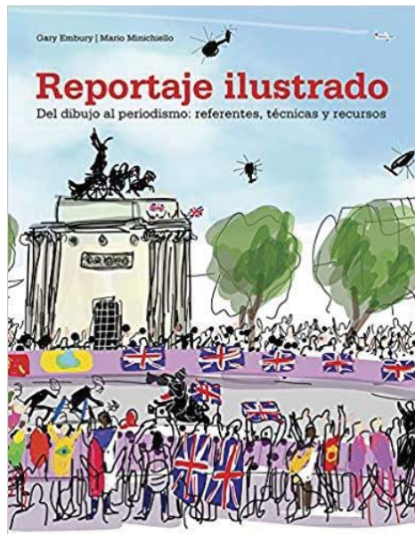
Figura 2. Portada del libro El reportaje ilustrado 6