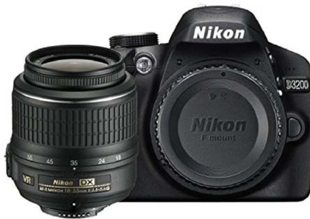
Figura 5. Cámara Nikon D3200