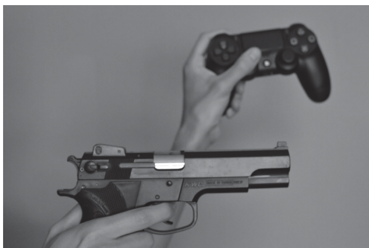
Figura 8. Censura a los videojuegos