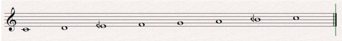
Ilustración 1. Maqām rāst . Información extraída de Scott (2002, p. 154). En esta notación se ha utilizado el símbolo del bemol invertido para indicar los cuartos de tono.