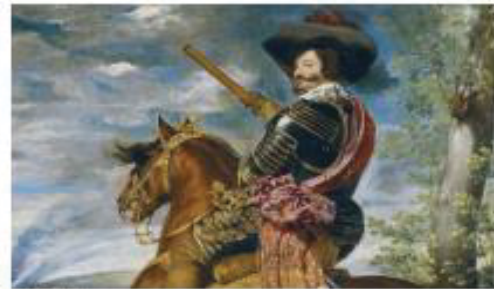
Pie de imagen

La política exterior del Conde-Duque tuvo repercusiones negativas en el ámbito nacional. Los reinos de la Corona de Aragón se rebelaron cuando se les reclamó una aportación para financiar las campañas europeas; en 1640, el Principado de Cataluña (los soldados congregados en Barcelona con motivo de la procesión del Corpus Christi se suble-