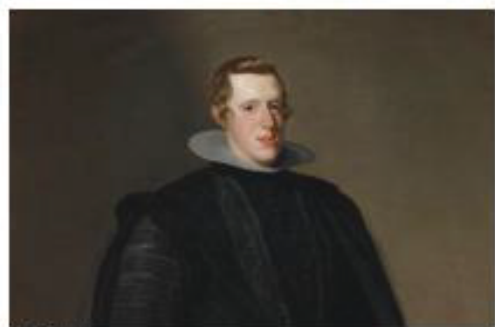
Pie de imagen

Nombre y apellidos de los 4 miembros del grupo