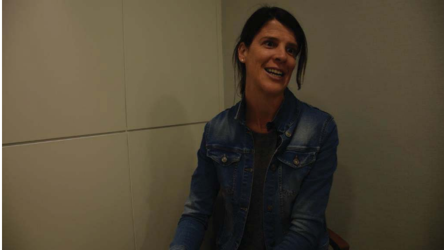
Ilustración 10: Ruth Beitia, exatleta olímpica