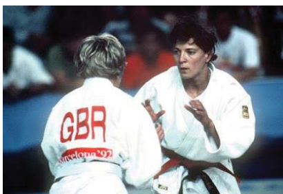
Ilustración 4: Miriam Blasco, JJOO Barcelona 92.

El gran año para el deporte español fue 1992, con la celebración de los Juegos Olímpicos de Barcelona, cuya repercusión en el deporte femenino otorgó medallas de Oro para Miriam Blasco y Almudena Muñoz en judo y para Theresa Zabell y Patricia Guerra en vela, consiguió la medalla de plata en gimnasia rítmica Carolina Pascual y en dobles femeninos de tenis Conchita Martínez y Arantxa Sánchez Vicario; además esta última logro también el bronce en tenis individual femenino. (Sánchez, 2016)