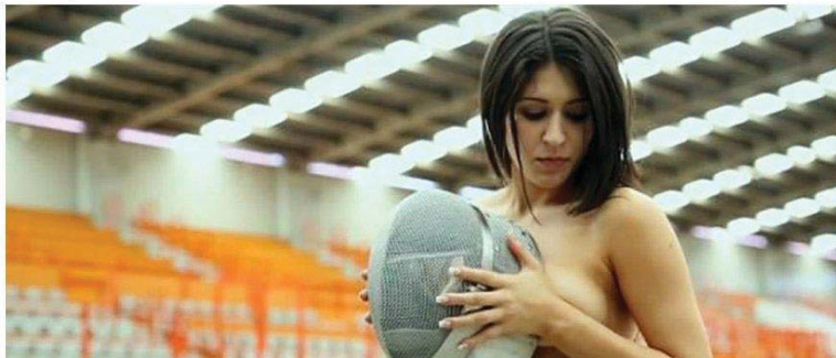
Ilustración 7: Noticia de la web TN.