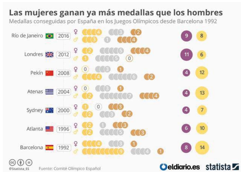
Ilustración 6:

A medida que ha ido pasando el tiempo, el deporte español ha alcanzado un notable desarrollo y con él las mujeres deportistas y sus logros. Durante los Juegos Olímpicos hemos podido ver como las mujeres iban consiguiendo más medallas, tal es así, que, en 2012 por primera vez en la historia, las deportistas españolas logran mayor número de medallas en los Juegos Olímpicos de Londres que los hombres. “Las 5 medallas de diferencias entre un sexo y otro (6 para hombres y 11 para mujeres) convierten este hecho, anteriormente no sucedido, en un hito señalado en la historia de la mujer deportista.” (Sánchez, 2016).