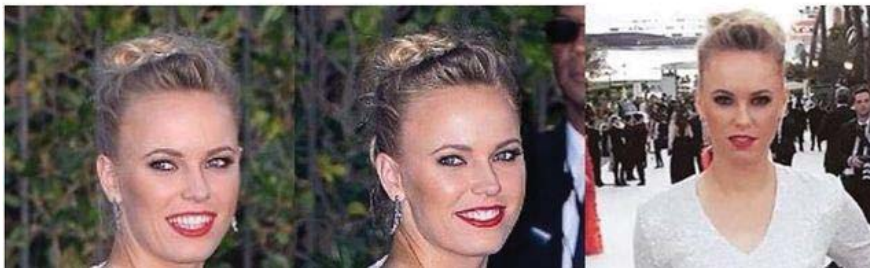
Ilustración 2:

• Ellas son algunas de las más bellas de la competición