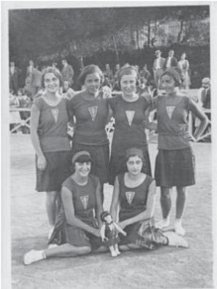
Ilustración 3: Equipo femenino de baloncesto del Club femenino d'Esports (1930).

En 1928 se fundó el primer club femenino de deporte en Barcelona: Club Femenino d'Esports. En 1931 ya contaba con 2000 socias y 10 equipos de baloncesto, fomentando también otros deportes como el balonmano, hockey, natación y atletismo. (Sánchez, 2016)