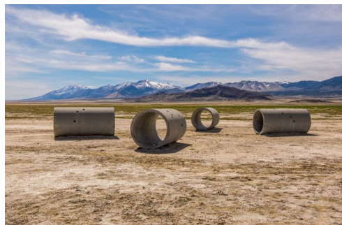
Figura 3. Nancy Holt, “Sun Tunnels”, Utah, 1973–1976.

Holt fue una gran historiadora del espacio y el tiempo, ha realizado bastantes proyectos con una gran repercusión en todo el mundo. A través de sus obras asociadas al Land Art, nos muestra una perspectiva diferente de lo que conocemos como el lugar y el espacio, desafiando de esta forma la comprensión que mostramos ante el paisaje y nuestro entorno, haciéndonos pensar sobre el lugar en el que vivimos.