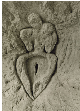
Figura 4. Ana Mendieta, Escultura Rupestre, 1981

Ana Mendieta, de origen cubano, tenía más cercano en sus sustratos mentales las interrelaciones entre feminidad y naturaleza y lo materializaba en obras como Escultura Rupestre , (1981) donde talla en una pared rocosa una figura femenina con reminiscencias paleolíticas. (p.109) (Figura 4)