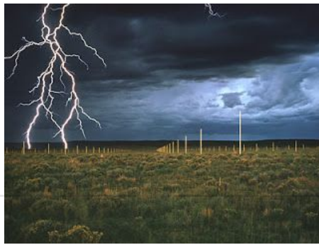
Figura 1. Walter de de María, Campo de relámpagos, Nuevo Méjico, 1974-1977.