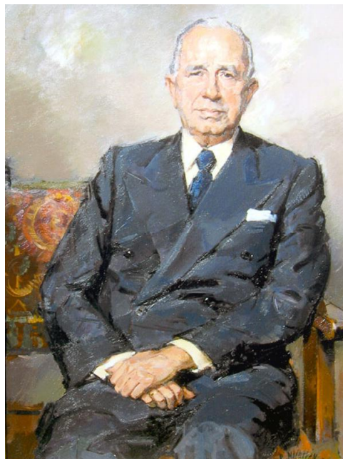
Imagen 2: Manuel Lora Tamayo