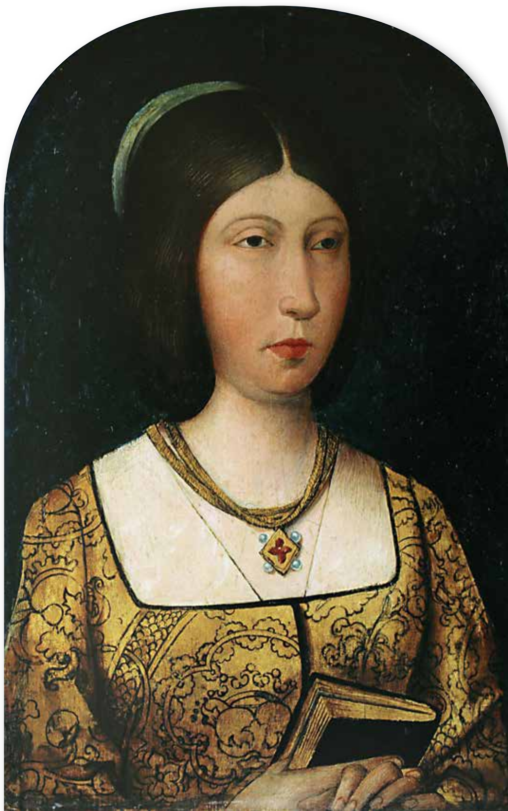
Isabel la Católica, Anónimo inglés, c. 1500-1510, óleo sobre tabla, 37,4 x 27 cm, Windsor Castle, Royal Collection Trust