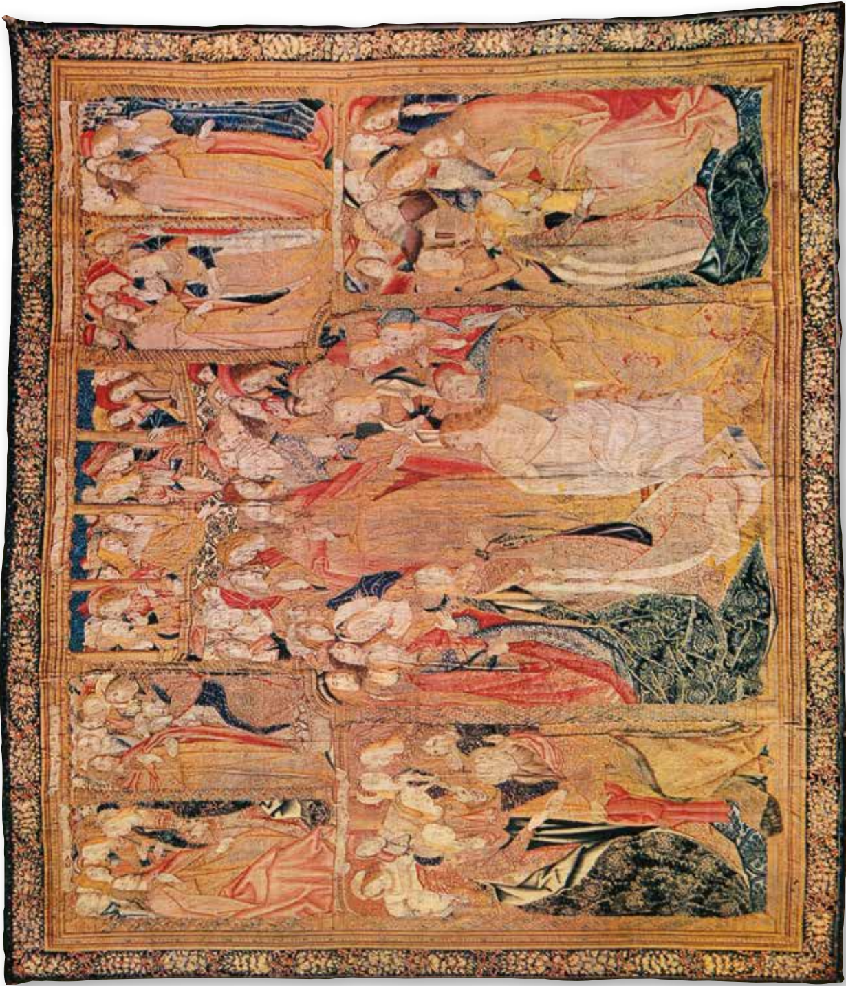
Resurrección de Lázaro, c. 1495, Manufacturado en Bruselas, lana, seda y oro, 393 x 466 cm, Zaragoza, Museo de Tapices de La Seo