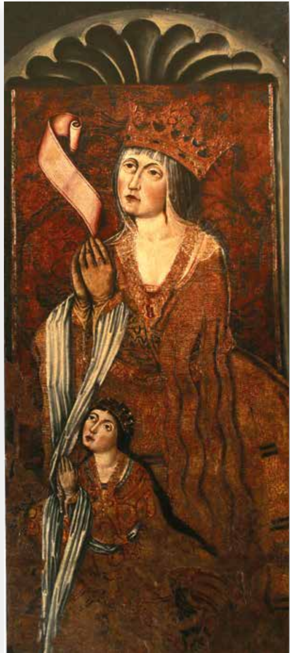
Los Reyes Católicos con el príncipe Juan y la infanta Isabel, Anónimo aragonés, óleo sobre tabla, c. 1488, Daroca (Zaragoza), Iglesia de Santa María