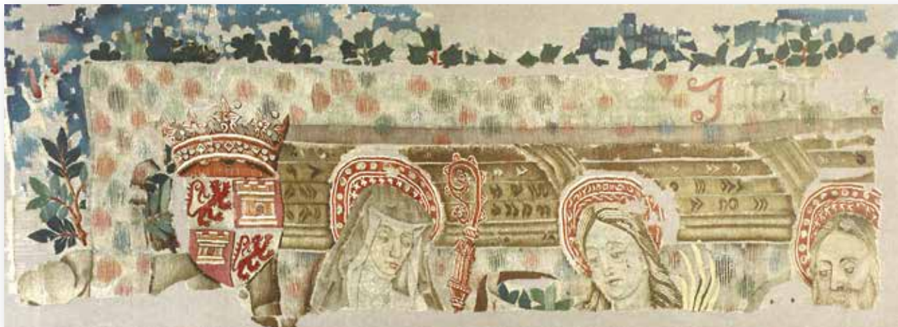
Santos de España, Fragmento de tapiz, lana y seda, Colección Mascort (Barcelona) c. 1440-1460

Fernando el Católico, como los príncipes de su época, gustó especialmente de los tapices. Así lo prueban los datos conocidos, sin duda incompletos, pero suficientes para saber que el rey de Aragón no desdeñó las artes visuales y que en su aprecio por los paños no se diferenciaba de otros personajes contemporáneos.