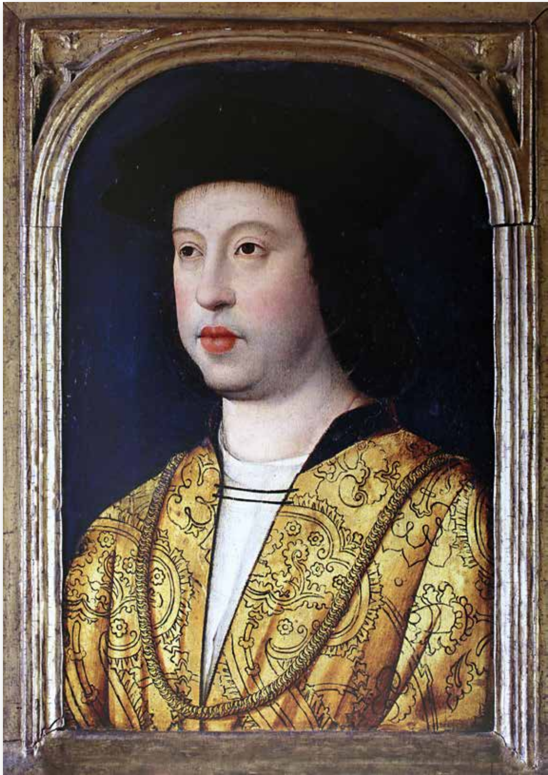
Fernando el Católico, Anónimo inglés, c. 1500-1510, óleo sobre tabla, 37,4 x 27 cm, Windsor Castle, Royal Collection Trust