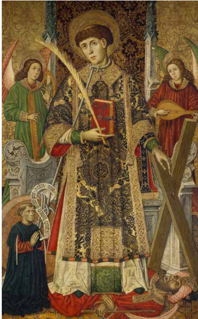
San Vicente diácono y mártir , Tomás Giner, 1468, óleo sobre tabla, 185 x 117 cm, Madrid, Museo Nacional del Prado

tólica 17 . Hasta la fecha no se han documentado más pintores en la casa de Isabel la Católica, a excepción de Pedro Ramírez, que aparece en las nóminas de corte en 1495-1496, con un salario muy reducido, 6.000 maravedís, del que no tenemos noticias de su quehacer 18 .