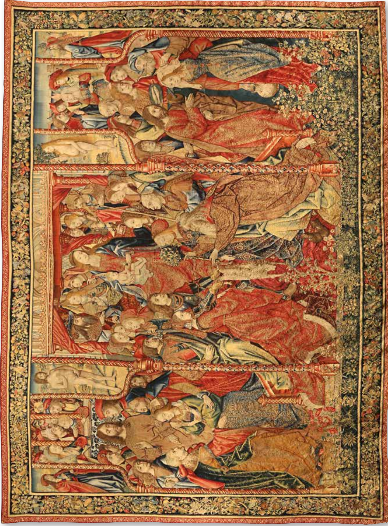
Vida de la Virgen. Cumplimiento de las profecías en el nacimiento de Cristo, c. 1502, lana, seda y oro, 340 x 400 cm. Zaragoza, Museo de Tapices de La Seo