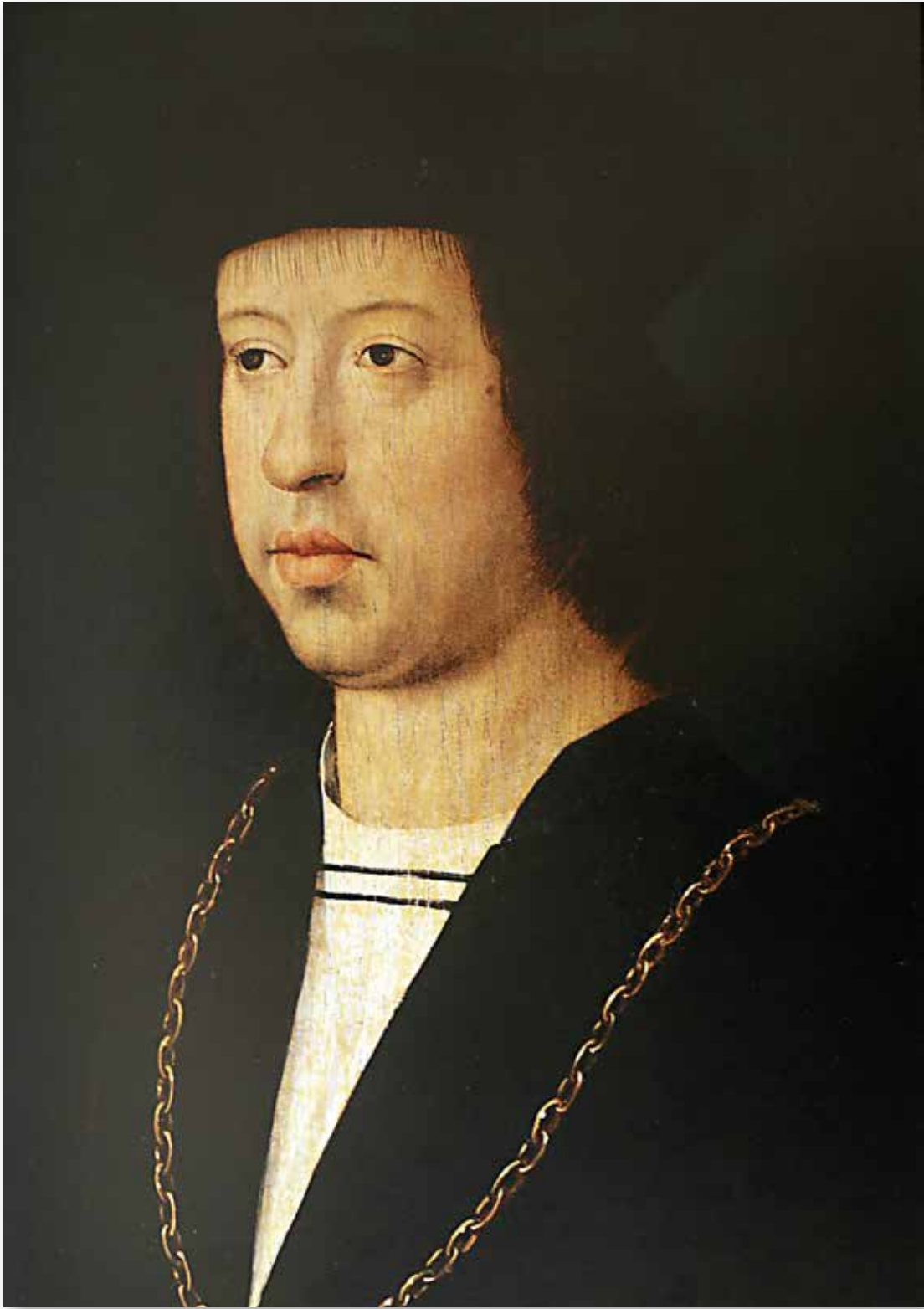
Fernando el Católico , Anónimo flamenco, fines de siglo XV, óleo sobre tabla, 55 x 45,5 cm, Poitiers, Musée Sainte-Croix