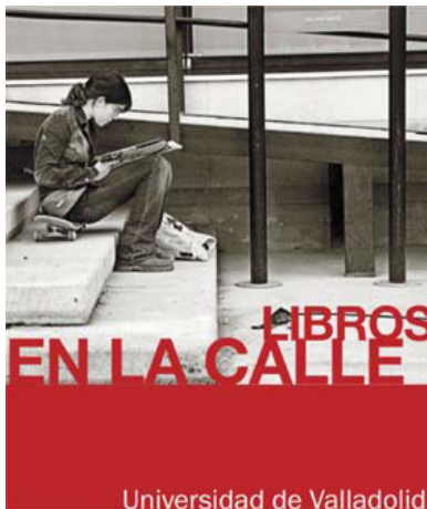
Figura 2. Carátula del proyecto

El hecho diferencial de este proyecto, frente a otras instituciones presentes en la plataforma, radicaba en que eran los propios alumnos los que generaban los contenidos. Debido al gran éxito de participación y consumo de los podcast , se estableció una estrecha relación con profesorado del Campus de Soria de la UVa, que también quisieron participar en el mismo. Libros en la calle se configuró como un proyecto colaborativo, un lugar para el encuentro de lectores donde se podían comentar todos aquellos libros que más nos habían gustado o que menos, porque también en el proyecto había sitio para la crítica, sea sutil o despiadada. Cada lector puede opinar libremente sobre lo leído y dejar a los futuros lectores sus impresiones de lectura. Es precisamente la lectura crítica una de las mejores herramientas en la promoción lectora de la Educación Superior (Alarcón Pérez y Fernández Pérez, 2006).