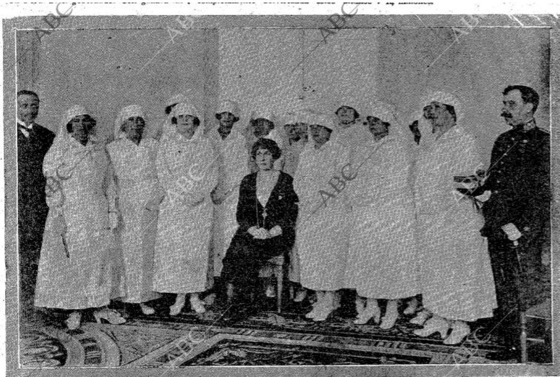
SANTANDER. EN EL PALACIO DE LA MAGDALENA

S. M. LA REINA DOÑA VICTORIA, CON LAS NUEVAS DAMAS ENFERMERAS DE LA CRUZ ROJA, DESPUES DE LA SOLEMNE IMPOSICION A ESTAS DE LOS BRAZALES Y LAS CRUCES.