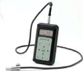
Modelo Brüel&Kjaer 4444.

Los dosímetros de ruido cumplen las normas UNE-EN 61252:2005 (Tipo 2) y son calibrados de acuerdo con las exigencias del artículo 6 del R.D. 286/2006, y los procedimientos de calidad de la Sociedad de Prevención Asepeyo.