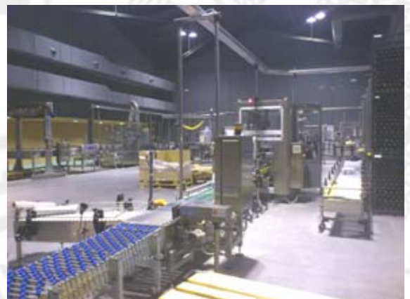
Imagen de la sala de embotellado-etiquetado.

En el momento de la visita la sección de embotellado está parada, pero no así el etiquetado, encapsulado y embalaje. Al entrar observamos que todos los trabajadores llevan colocados protectores auditivos (tapones). Tomamos nota del modelo de protector que emplean y que nos será de utilidad a la hora de comprobar la eficacia de la protección al ruido que soportan.