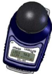
Modelo Casella Cel 350.

El dosímetro CEL 350 y el 4444 tienen dos circuitos de detección en paralelo para poder realizar simultáneamente la medición del nivel de presión acústica continuo equivalente ponderado A ( L_{Aeq,T} , que es una media energética de valores eficaces o RMS) y del valor de pico con ponderación C, ambos valores directamente comparables con los límites establecidos en el R.D.286/06 para niveles diarios equivalentes y para picos de ruido.