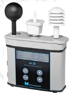
Monitor HS-32. Metrosonics.

Posibilidad de selección de escala de temperatura en °C y °F.