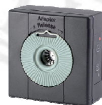
Modelo Brüel&Kjaer 4231

El calibrador es una fuente sonora portátil que sirve para verificar in situ el ajuste de los sonómetros, dosímetros y, en general, de cualquier aparato de medida del sonido.