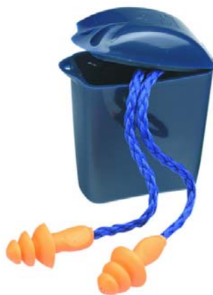
Tapón auditivo reutilizable de hule con cordón y con caja. 3M 1271.

Utilizamos una aplicación informática específica, llamada Víctor v.4, en la que introducimos los valores de los niveles acústicos equivalentes en dB(A) y en dB(C) y el modelo del protector auditivo que están utilizando, 3M 1271, para obtener la estimación del nivel de ruido con protector y la atenuación de los mismos.