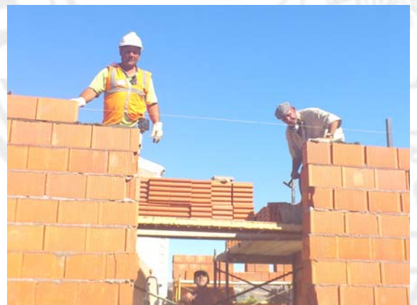
Imagen del trabajador con la bomba de muestreo.

Una vez que entramos en la obra observamos que los trabajadores no llevan puestos los EPIs necesarios. Los cascos de protección y los guantes de dos trabajadores se encuentran en el suelo, alejados del lugar en el que éstos están desarrollando su actividad.