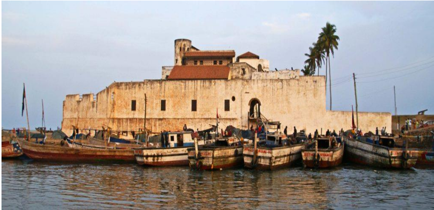
Imagen 2: Castillo de Elmina.

Este asentamiento estaba destinado para el comercio de armas, oro y demás enseres, pero posteriormente con la dominación de los holandeses e ingleses sobre esta zona en el siglo XVII también fue uno de los puntos más importantes para el tráfico de esclavos hasta la abolición de este tipo de comercio en el siglo XIX 3 .