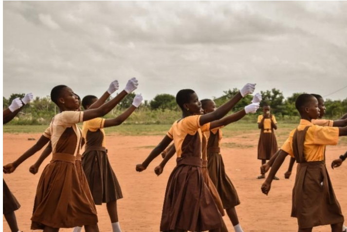
Imagen 4: Desfile del día de la Independencia de Ghana en la escuela “Atsiame-Helluwi Basic School”.