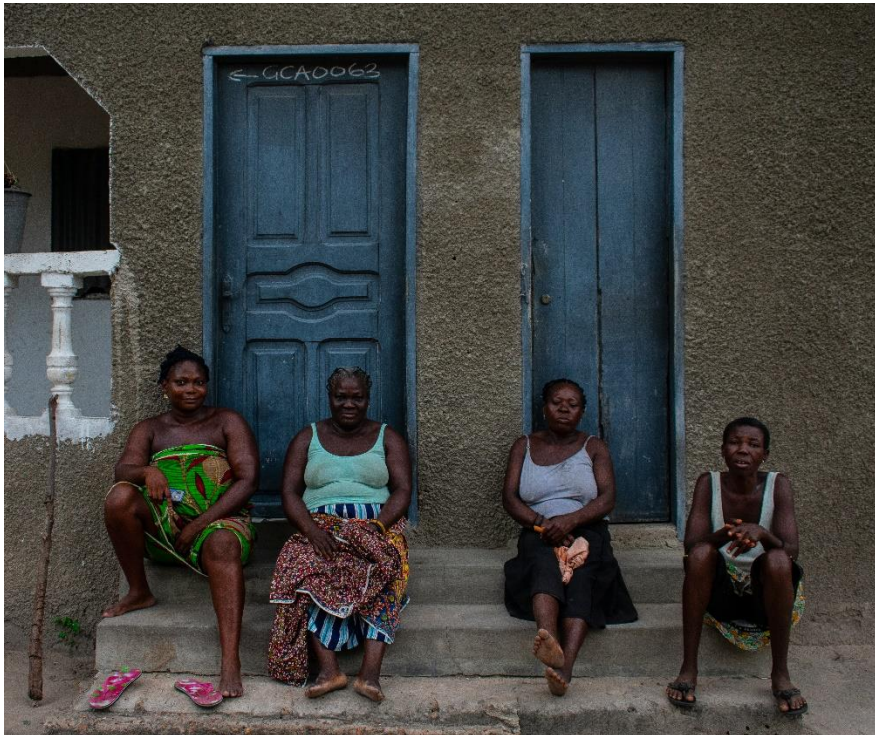
Imagen 8: Mujeres de Atsiame tras una dura jornada de trabajo.

“La mujer africana es el héroe olvidado de África. Porque no sólo es, aunque invisible, el motor del continente, sino que también es su pieza más fiable: una mujer africana jamás desaprovecha una oportunidad para sacar adelante a los suyos. África no está perdida, está esperando a que las mujeres ocupen el sitio que les corresponde”. (Aldekoa, 2014, p. 164) 14