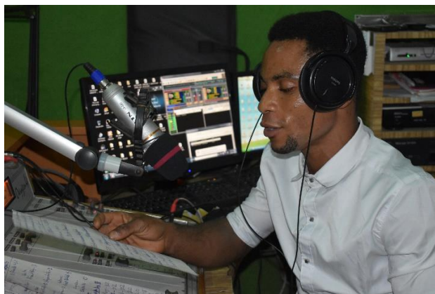
Imagen 1: Estudio radiofónico en la ciudad de Takoradi, (Volta Region, Ghana).

El enlace de los podcasts se emitirá de forma oficial a través de los perfiles de redes sociales de Adepu tanto en Facebook como Instagram, haciendo uso de herramientas de las propias redes para así definir mejor nuestro público.