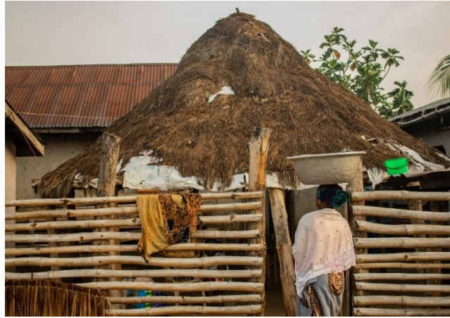
Imagen 7: Mujer realizando tareas para el hogar.

Ghana, a día de hoy sigue siendo una cultura machista, donde en el matrimonio, el hombre, se considera la figura de autoridad, poniéndose por encima de la mujer y llevando la voz cantante, ya que es el quien toma las decisiones importantes de la familia, sin tener en cuenta el pensamiento de la mujer, pues esta tiene la obligación de obedecer a su marido, muchas veces ejerciendo autoridad de forma ilimitada, llegando en muchos casos al abuso físico. La zona rural sigue con ese pensamiento tradicional y cultural de que la mujer debe ser quien se encargue de las tareas del hogar y es ese pensamiento el que hay que cambiar, mediante la educación.