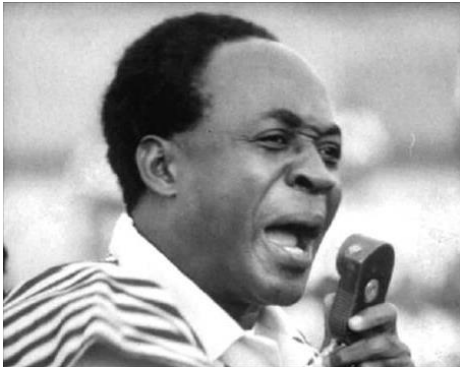
Imagen 3: Kwame Nkrumah en el discurso de Independencia en 1957.

Kwame Nkrumah, considerado como uno de los padres del panafricanismo 5 quien en 1949 funda el primer partido político de la colonia, Partido de la Convención Popular (CPP), en oposición a la corona británica, un partido que se autodeterminaba como nacionalista africano y anticolonialista, lo que le costó la prisión a Nkrumah en 1952 por promover un movimiento anticonstitucional.