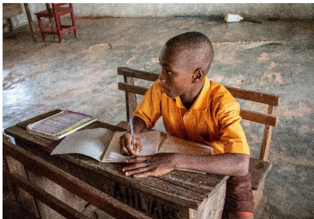
Imagen 5: Niño en una escuela de la zona rural de Atsiame, Ghana.

En 1961 el gobierno de la Convención Popular de los Pueblos, crea La Ley de Educación un sistema en el que la enseñanza educativa de primaria y secundaria pasa a ser obligatoria y totalmente gratuita, gracias a que el Estado controla y administra estas instituciones. También se llevó a cabo una fuerte Inversión para la captación de profesorado cualificado y así promover una educación de calidad en Ghana 9 .