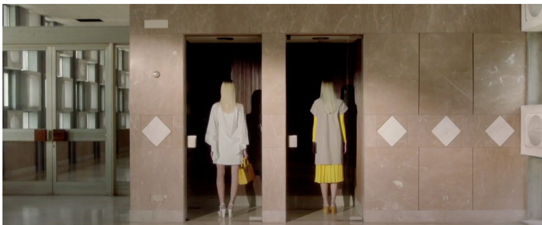
Fig 16: Ejemplo de escena con presencia de Mickey Mousing

El spot utiliza la versión original de la canción Ramalama (Bang bang), sin embargo, emplea únicamente la última frase del sexto párrafo y el séptimo párrafo completo de la canción original. Esta canción se clasifica como música pre - existente, correspondiendo a la categoría de fono. La música aparece de manera extradiegética, ya que no nace en el mundo del spot. Como efectos sonoros encontramos varios ruidos diegéticos como el sonido del ascensor, la risa de una mujer, el ruido de los tacones, los pájaros y la verja al subirse. Se trata de música incidental, pero existen varios momentos en los que nos encontramos con escenas donde música y acción se sincronizan, situación conocida como Mickey Mousing .