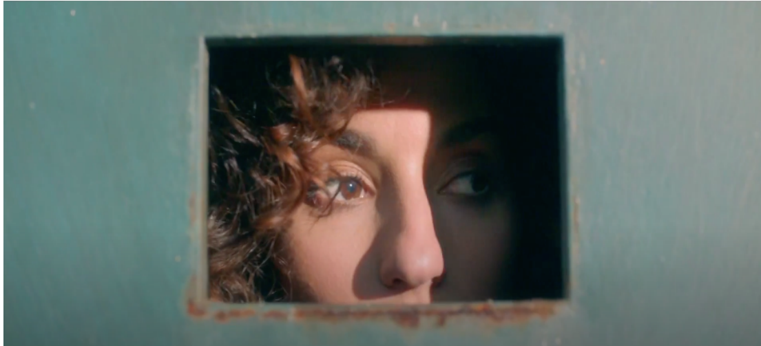
Fig 21: Ejemplo primer plano