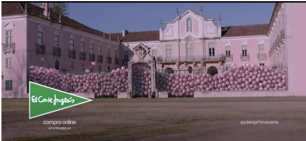
Fig 1: Último plano del spot “Ya es primavera” (2015)