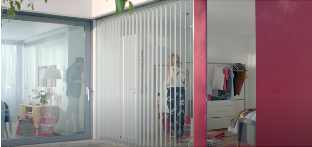
Fig 10: Ejemplo plano general “ Tampoco pido tanto ” (2016)