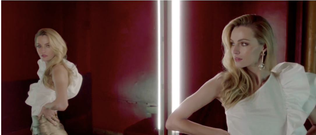
Fig 18: Uso del color corporativo dentro de una escena