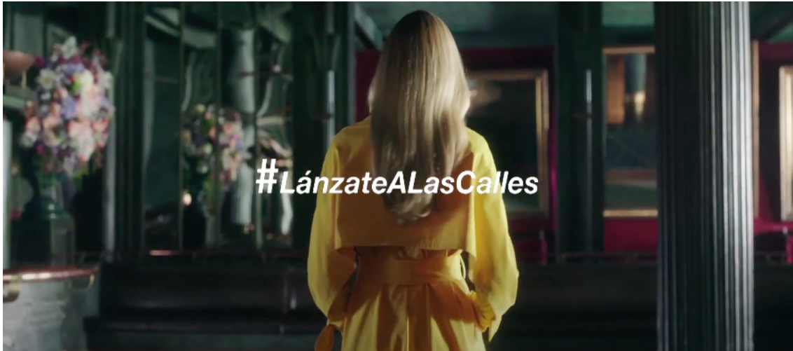
Fig 17: Escena #LánzateALasCalles

La fórmula utilizada en esta campaña consiste en mostrar cómo con la primavera las calles se llenan de color. Como se mencionaba anteriormente la marca no se muestra hasta los últimos segundos del spot, generando una sensación de intriga en el espectador. A los pocos segundos del spot, la marca nos muestra el hashtag de la campaña #Lánzatealascalles, de esta manera se introduce en la mente del espectador el concepto principal de la campaña y actúa como elemento para comprender que está pasando y que buscan las mujeres protagonistas.