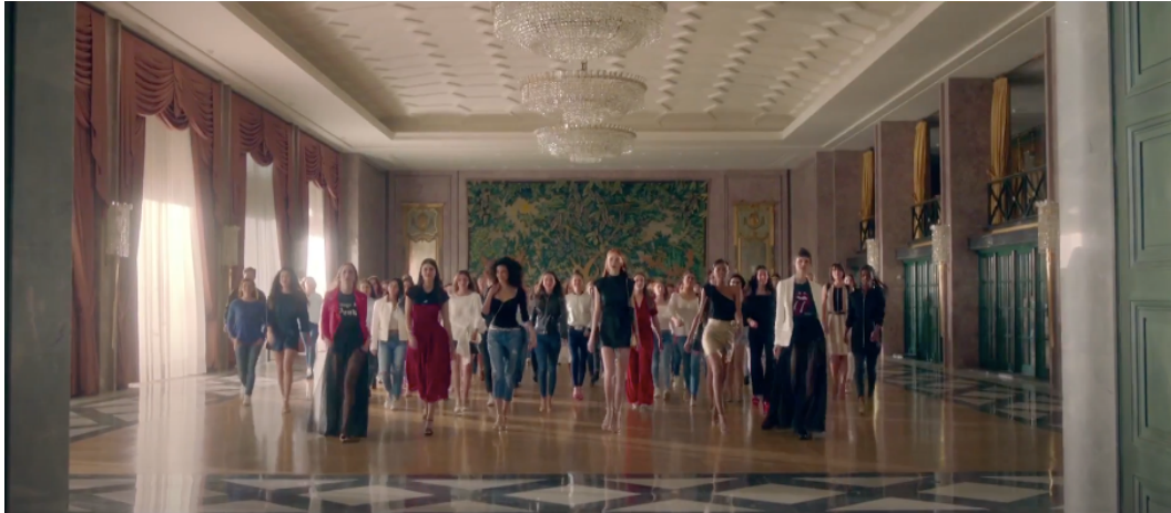
Fig 19: Ejemplo plano general