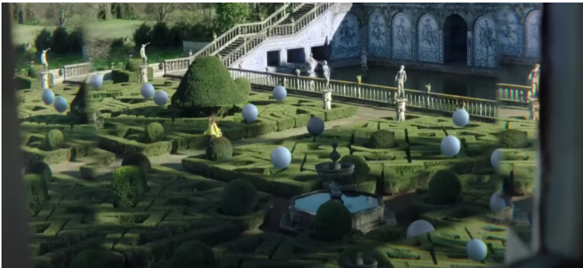
Fig 6: Ejemplo de gran plano general en el spot “ Ya es primavera ” (2015)