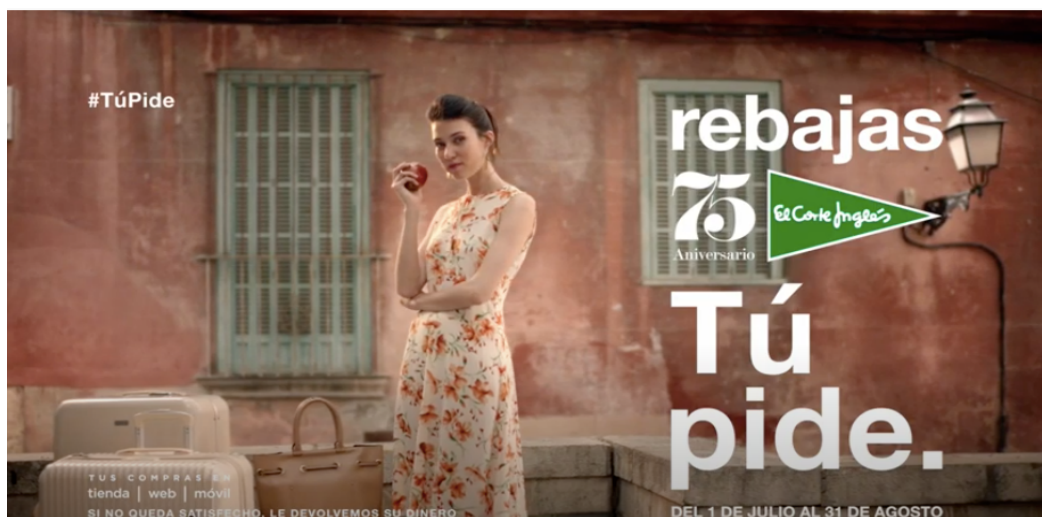
Fig 8: Plano extraído del spot “ Tampoco pido tanto ” (2016)

Como se comentaba anteriormente, el concepto clave de la campaña es “Tú pide”, resaltando cómo la marca tiene todo lo que tú necesitas. Ese mensaje vuelve a enfatizarse en el último segundo del spot, cuando encontramos un plano de una mujer luciendo un vestido, acompañada de un texto que repite todo lo mencionado antes: Rebajas 75 por ciento y el concepto “Tú pide”; tanto en la esquina superior izquierda como en la inferior derecha.