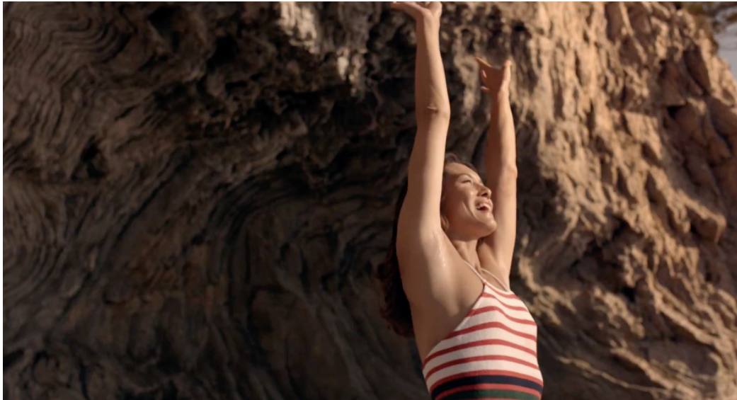
Fig 12: Ejemplo plano corto “ Tampoco pido tanto ” (2016)