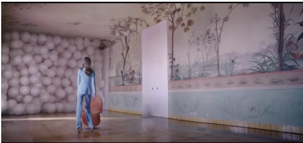
Fig 2: Ejemplo de escena con presencia de Mickey Mousing

La música es pre - existente, una canción original del DJ Aronchupa, lanzada en el año 2015. Corresponde a la categoría de fono, ya que se respeta la canción original. Aunque la mayor parte de la canción se clasifica como música incidental, cuya función es acompañar al spot, existen ciertos momentos donde nos encontramos ante una sincronización entre música y escena; Mickey Mousing .