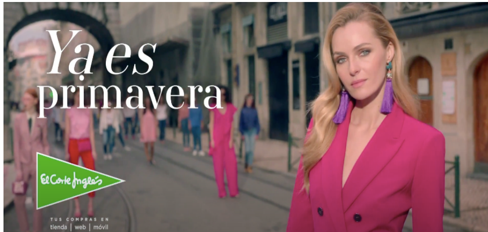
Fig 15: Última escena del spot “Ya es primavera” (2017)

El spot utiliza la versión original de la canción Ramalama (Bang bang), sin embargo, emplea únicamente la última frase del sexto párrafo y el séptimo párrafo completo de la canción original. Esta canción se clasifica como música pre - existente, correspondiendo a la categoría de fono. La música aparece de manera extradiegética, ya que no nace en el mundo del spot. Como efectos sonoros encontramos varios ruidos diegéticos como el sonido del ascensor, la risa de una mujer, el ruido de los tacones, los pájaros y la verja al subirse. Se trata de música incidental, pero existen varios momentos en los que nos encontramos con escenas donde música y acción se sincronizan, situación conocida como Mickey Mousing .