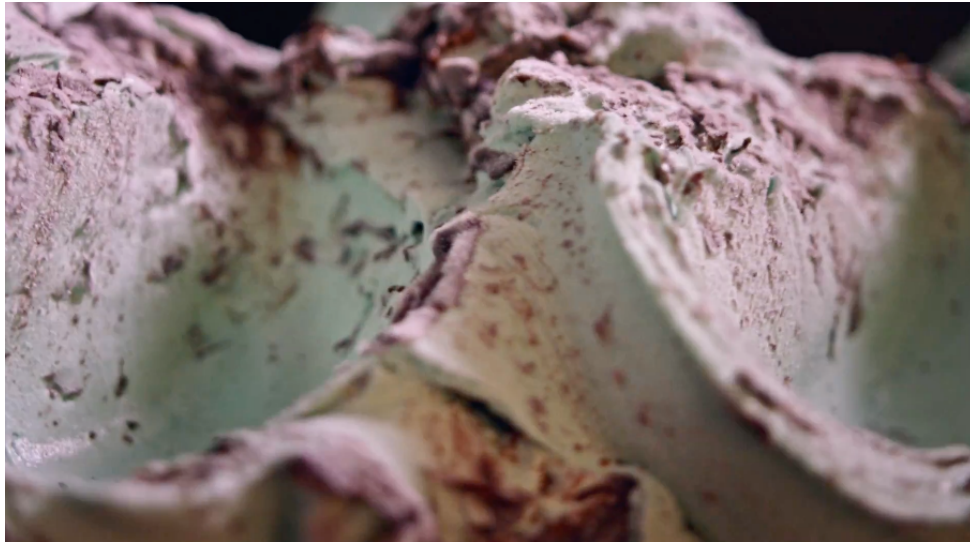
Fig 14: Ejemplo plano detalle “ Tampoco pido tanto ” (2016)

plano para mostrarnos pequeños detalles donde normalmente encontramos una prenda de ropa o algún detalle relevante.