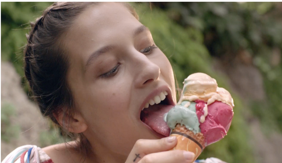
Fig 13: Ejemplo primer plano “ Tampoco pido tanto ” (2016)

Con el uso de primeros planos se busca aislar al personaje. Esto nos permite conocerlo aún más, descubrir cómo convive dentro de la escena, y en este caso nos muestra la belleza y los pequeños detalles de los protagonistas del spot.