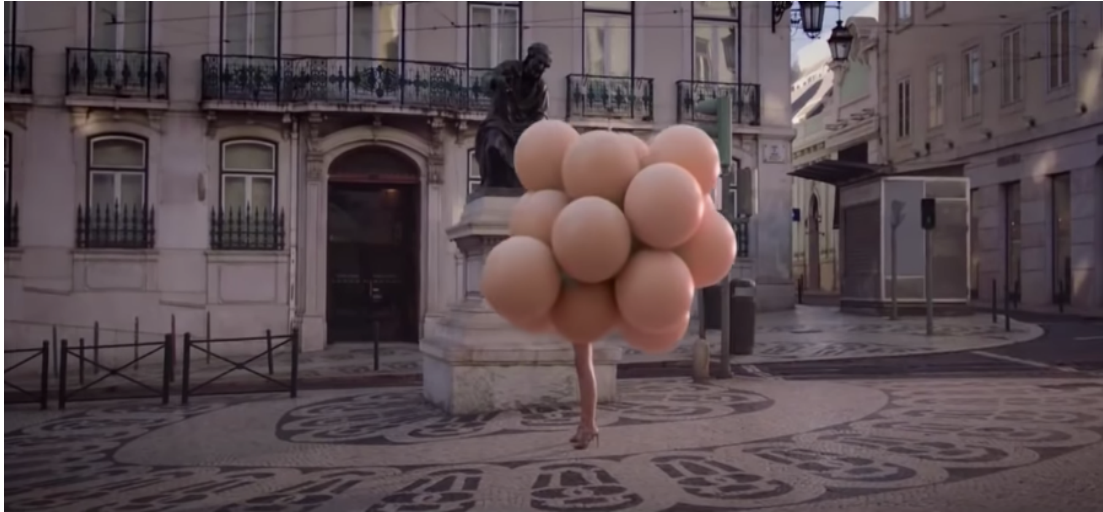
Fig 3: Ejemplo de plano general en el spot “Ya es primavera” (2015)