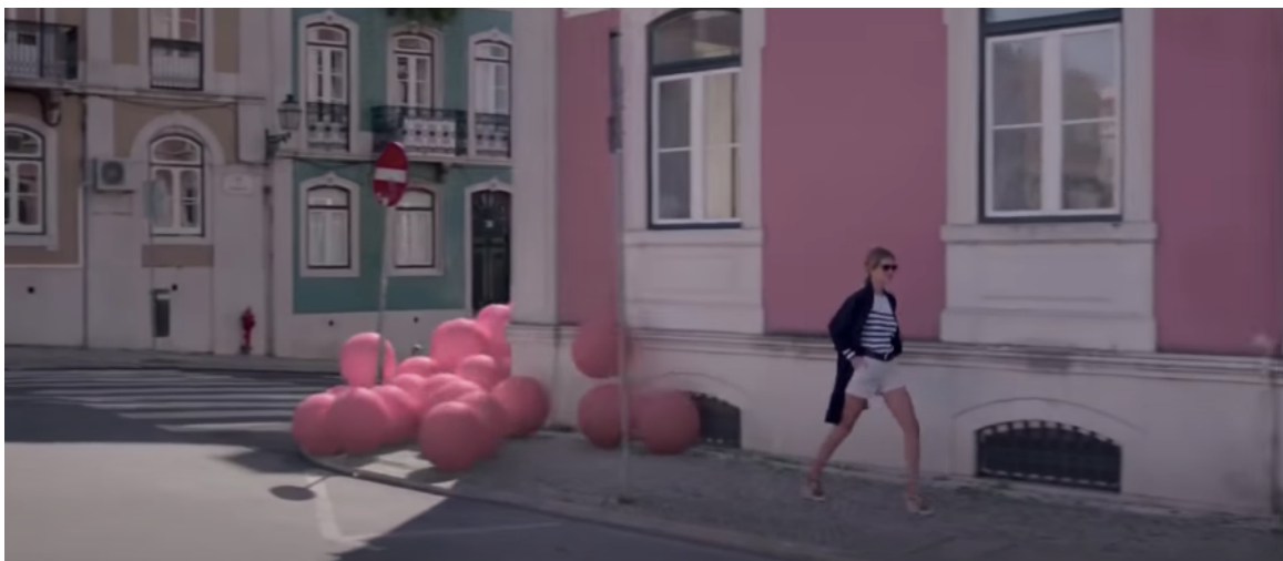
Fig 4: Ejemplo de plano general en el spot “Ya es primavera” (2015)