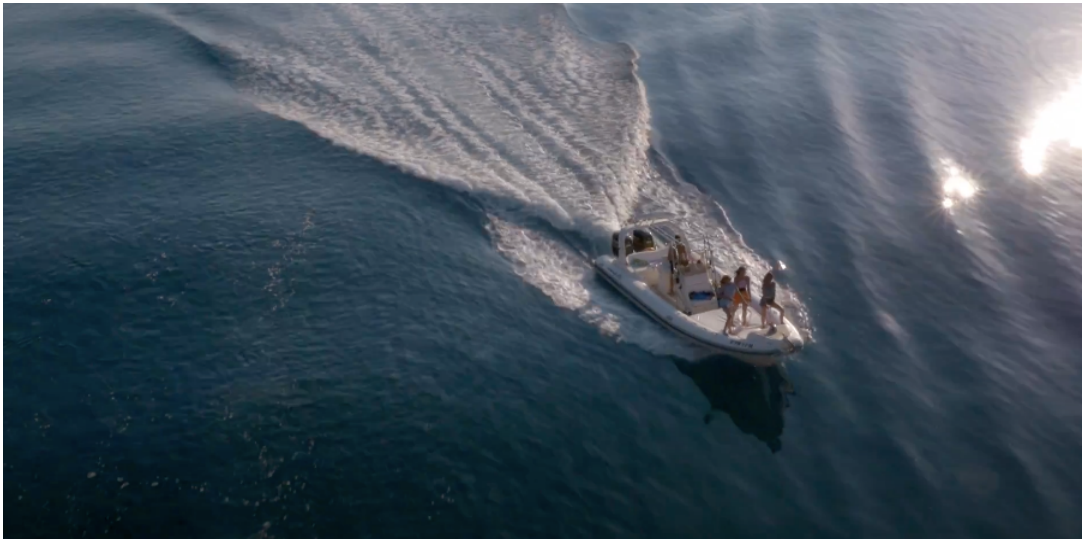
Fig 9: Ejemplo gran plano general “ Tampoco pido tanto ” (2016)

Los planos utilizados ayudan a enfatizar la idea que la música y el spot quieren transmitir. Encontramos grandes planos generales en aquellas escenas que buscan describir el lugar en el que ocurre la acción, y situar en el espacio a los personajes de una manera muy global.