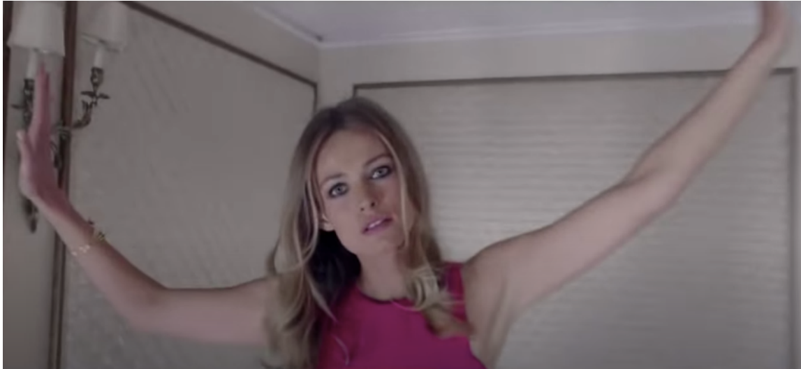
Fig 7: Ejemplo de plano medio corto en el spot “ Ya es primavera ” (2015)