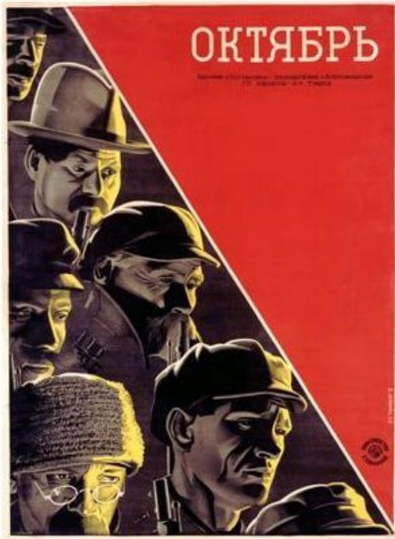
Fig. 3 Cartel de la película Octubre (1927)