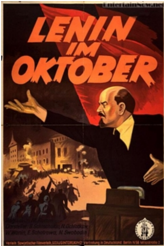
Fig. 5. Cartel de la película Lenin en octubre (1937)