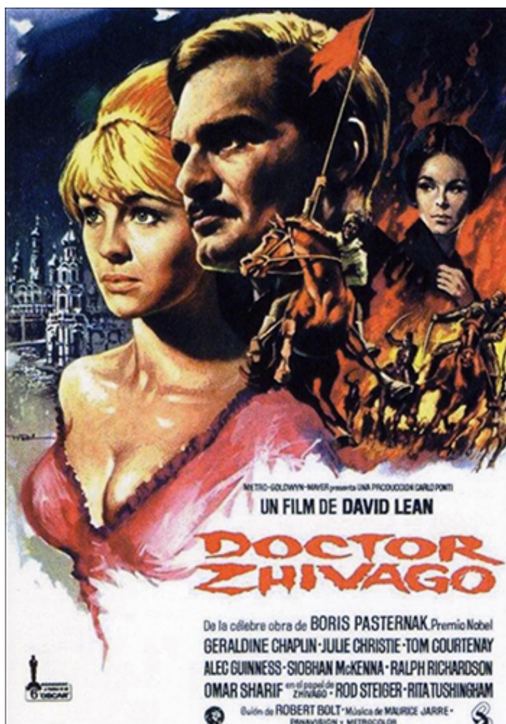
Fig. 6. Cartel de la película Doctor Zhivago (1965)