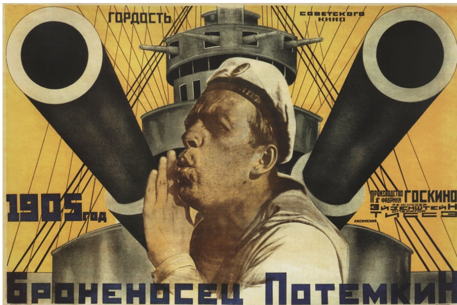
Fig. 2 Cartel de la película El Acorazado Potemkin (1925).