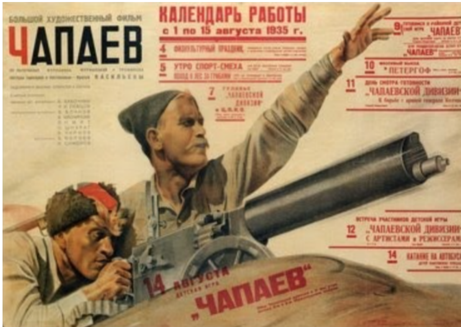
Fig. 4 Cartel de la película Chapaev (1934).