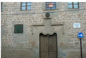
Convento de las Agustinas

Al salir de la Iglesia de San Miguel, nos dirigimos al Convento de las Agustinas, que se encuentra a mitad de camino entre dicha iglesia y el Palacio de los Castejones, realizaremos una breve parada para explicar su función y la causa de su desuso en la actualidad, y aprovecharemos para preguntar a los niños si alguno de ellos ha realizado la tradicional visita a la Virgen de los Corderillos.