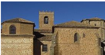
Iglesia de San Miguel

Posteriormente, nos pondremos en marcha hacia la Iglesia de San Miguel, tras bordear la entrada al barrio moro y el palacio. Se explicará a los alumnos la importancia de esta iglesia, que alberga la imagen de San Miguel, patrono de la localidad, al que se dedican las fiestas patronales, que tanto gustan a los niños. Introduciremos las palabras ábside, retablo y sepulcro en esta visita.