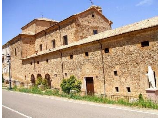
Convento de las concepcionistas