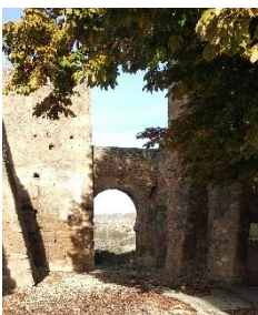
Puerta de la Herradura

Una vez dentro del “barrio moro”, visitaremos la “Puerta de la herradura”, junto a la cual se encuentran restos de la antigua muralla que delimitaba este, junto a ella está situado el centro de interpretación, que será visitado en último lugar.