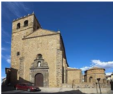
Iglesia de San Juan