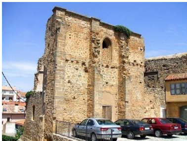
Iglesia de Nuestra Señora de Yanguas