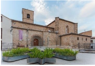
Iglesia de Nuestra Señora de la Peña

Tras finalizar la visita a la Basílica, nos dirigiremos por la calle de los Zapateros, que está empedrada, hacia la Iglesia de Nuestra Señora de la Peña, donde además de ver el exterior, recorreremos el interior para admirar la exposición de arte sacro que alberga.