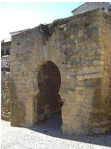
Puerta Árabe o Califal

Tras finalizar el tiempo de descanso, y con él la visita a la zona cristiana, a las 11:50 nos dirigiremos al llamado “barrio moro”, al cual accederemos por la Puerta Árabe o Califal, que se sitúa al lado de los muros del Palacio de los Castejones, y explicaremos el tipo de construcción (arco) y el material (piedra) que se usó para su construcción.