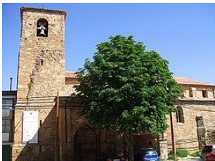
Iglesia de la Virgen de Magaña

A las 9:20 aproximadamente tendrá lugar el comienzo de la salida del centro hacia los restos de la Iglesia de la Virgen de Magaña, que es el primer monumento que se va a visitar, donde explicaremos que es la más antigua de la localidad y que fue destruida a causa de un incendio.