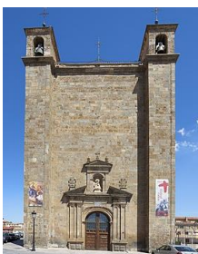
Basílica de nuestra señora de los milagros.

Después, nos dirigiremos hacia la Basílica de Nuestra Señora de los Milagros, situada en la plaza del centro del pueblo, los alumnos podrán visitar tanto el exterior como el interior de la misma, y se les explicará que actualmente es la parroquia principal de la localidad de Ágrede.