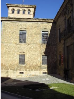
Palacio de los condes de Castejón

Yanguas, que actualmente se encuentra derruida y cerrada al público, pero que servía a los señores del Palacio para la realización del culto cristiano. Aprovecharemos los jardines renacentistas situados en el Palacio para dejar un tiempo libre de unos 30 minutos a los alumnos y que así puedan almorzar.