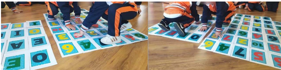
Imagen 5. Puesta en práctica del twister.