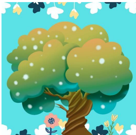
Imagen 8. El árbol del Hada de las galletas.