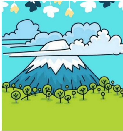
Imagen 7. La montaña Vocalita.