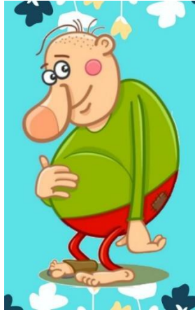
Imagen 6. El gigante Comilón.