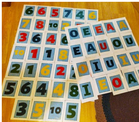
Imagen 4. Twister de letras y números.