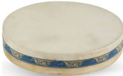
Imagen 10. Ocean Drum.