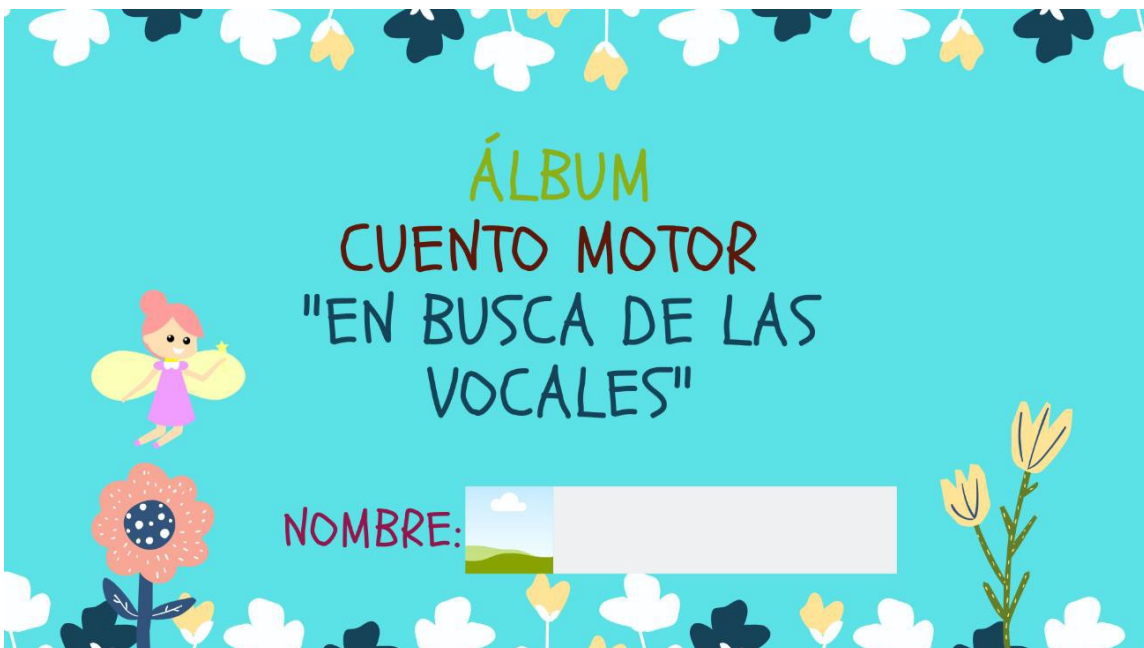
Imagen 11. Cara A del álbum del cuento motor "En busca de las vocales".