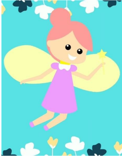
Imagen 9. Hada de las galletas.