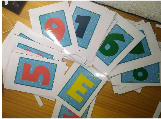
Imagen 3. Elaboración del twister de letras y números.