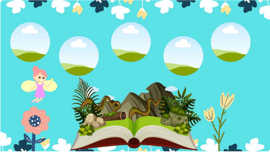
Imagen 12. Cara B del álbum del cuento motor "En busca de las vocales".