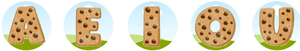
Imagen 13. Pegatinas para el álbum del cuento motor "En busca de las vocales".