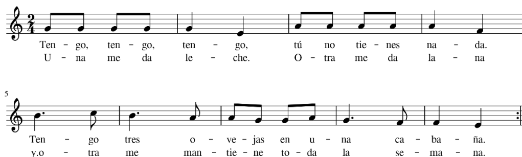
Figura 3. Partitura “Tengo, tengo, tengo”.

Enlace a la canción: https://www.youtube.com/watch?v=FMJNa13wywQ