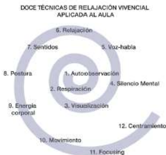
Figura 1. Técnicas TREVA. Figura recuperada de López (2013).

Los contenidos que se trabajan con dicho programa corresponden a doce técnicas: como indica el autor, nueve de ellas son fundamentales, dos son resultantes y la técnica denominada “focusing” se considera base del programa. En la siguiente figura se encuentra, de modo esquemático, las doce técnicas TREVA.