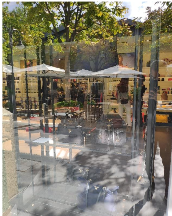
Ilustración 20. Ventana 8, parte 1.

En este caso, podemos apreciar el juego cromático de azul y negro entre los artículos, creando una sensación de contraste y, gracias a la disposición espacial, una