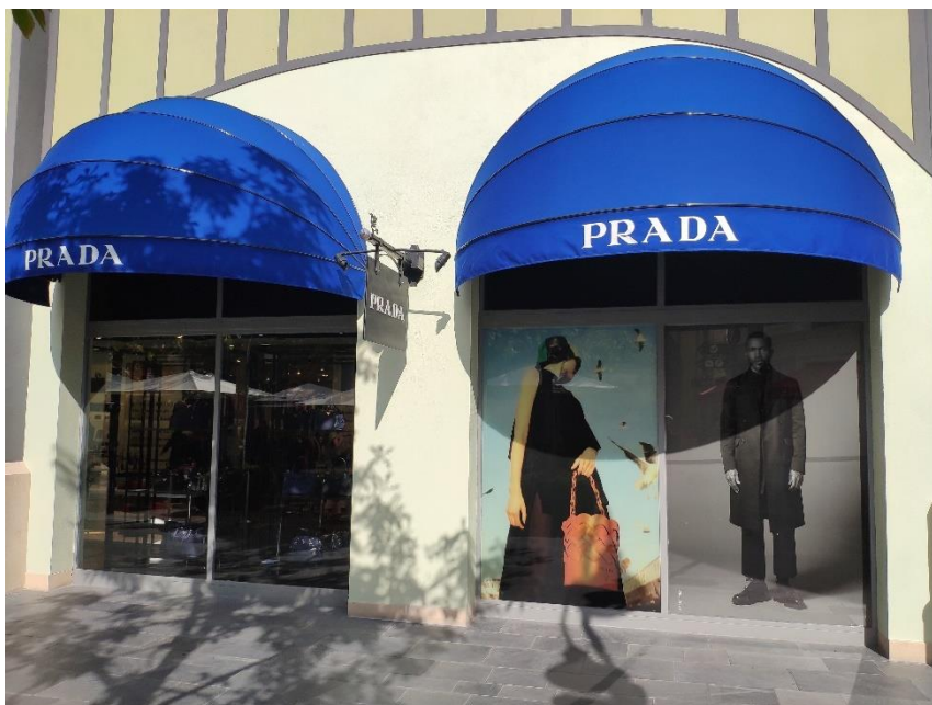
Ilustración 22. Ventana 9.

Situada en la parte del “ back office ” de la tienda, esta ventana usa el grafismo fotográfico para ocultar de la vista al público el vaivén de cajas característico de una tienda de ropa. Las imágenes escogidas, así como las expuestas en las ventanas 2 y 3, representan a una mujer asiática de entre 20 y 30 años de edad, y a un hombre de raza negra de entre 30 y 50. Podemos suponer que la marca simboliza e intenta atraer así al segmento turístico del mercado, a la vez que deja clara su posición como marca internacional en la mente del consumidor.