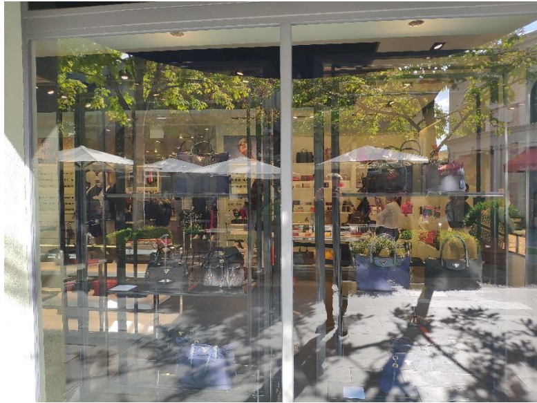
Ilustración 19. Ventana 8.

De tamaño significativamente mayor que las anteriores, esta ventana se divide en dos secciones contiguas formadas por los mismos elementos visuales. De nuevo, se emplea la estantería metálica negra de tres baldas para sostener los artículos. Los productos expuestos, así como en las ventanas 5 y 7, son únicamente accesorios de la firma (bolsos y carteras).