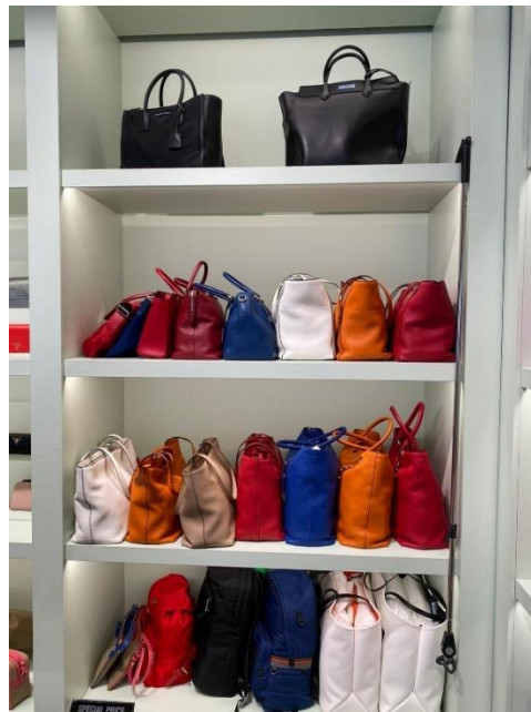
Ilustración 17 Interior 2.