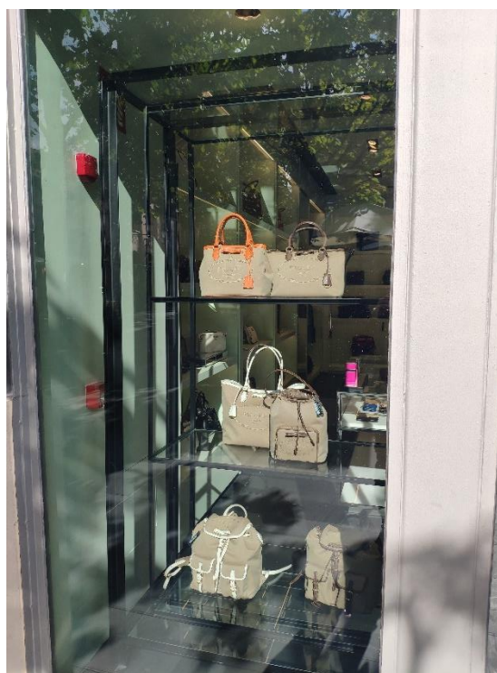
Ilustración 15. Ventana 5.

Sobre una estantería de metal negro de 3 baldas, se exhibe una misma línea de accesorios. Usando una gama de color monocromática basada en el marrón/beige, la vitrina toma una presencia más atrayente con una fuerte sensación de cohesión. Se puede apreciar que se utilizan técnicas del diseño como es la repetición (de color) y la reticencia en miras al minimalismo. Asimismo, podemos observar una secuencialidad entre los productos expuestos, siendo éstos de