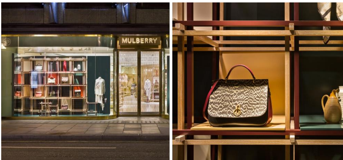
Ilustración 8. Escaparate tienda Mulberry.