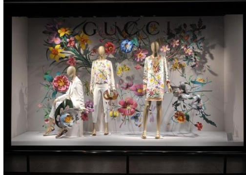
Ilustración 1. Escaparate tienda Gucci.