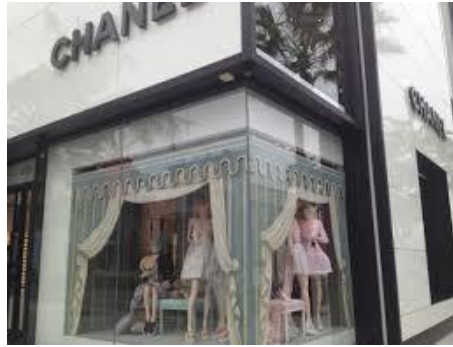
Ilustración 5. Escaparate tienda Chanel.