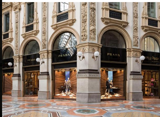
Ilustración 11. Escaparate "Corners by Martino Gamper", Galleria Vittorio Emanuele, Milán.