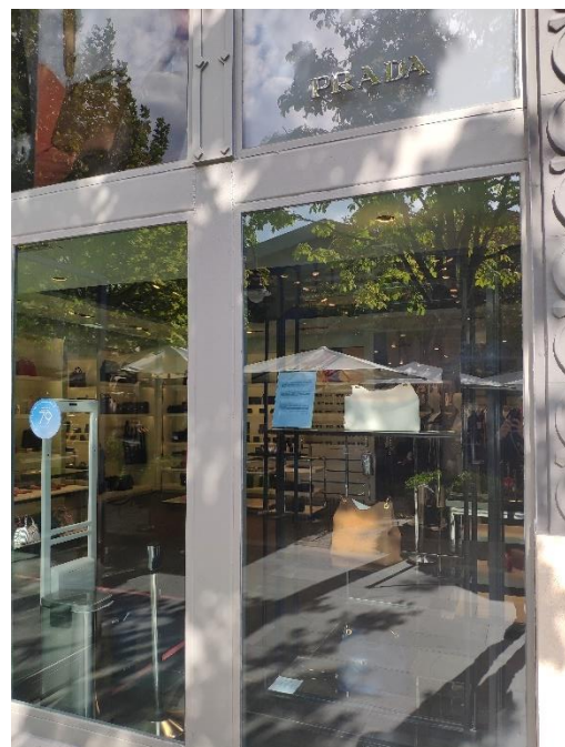
Ilustración 18. Ventana 7.

De dimensiones idénticas a la ventana 5, esta ventana también expone accesorios a lo largo y ancho de una estantería metálica negra de tres baldas. Sin embargo, el número de accesorios es menor (1 por balda), aunque todos ellos pertenecen a la misma línea de productos. También se exhibe una carta de presentación de la firma, situada a la altura de la cabeza. Lo primero que acapara la atención del espectador es la sucesión ordenada de color, ya que, por medio de la repetición, se exhibe el mismo bolso en distintos tonos según la