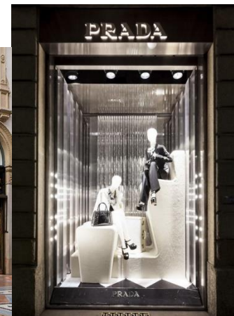
Ilustración 10. Escaparate monocromático de Prada, temporada de Navidad.