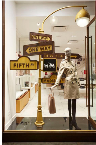
Ilustración 3. Escaparate desconocido.