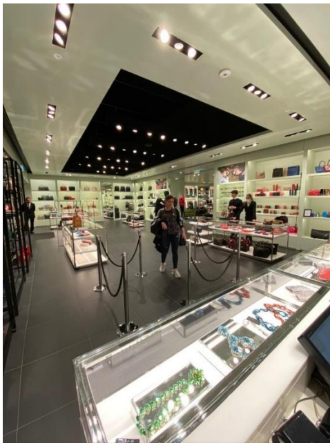
Ilustración 16. Interior 1.

el brillo y el color de la luz exterior en el escaparate. A pesar de su clara visibilidad al exterior, este espacio no suele ser usado para exhibir los bienes debido a la sensación de sobrecarga que genera. En todo caso, se situarán maniqués a los lados de la puerta, pero nunca más de uno a cada lado.