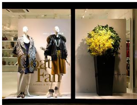
Ilustración 2. Escaparate tienda Coat Fair.