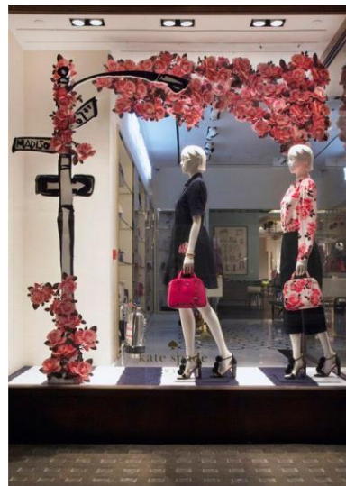
Ilustración 4. Escaparate tienda Kate Spade, complementos.