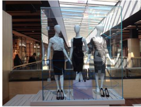
Ilustración 7. Escaparate desconocido.