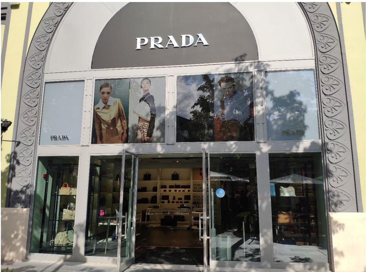
Ilustración 13. Entrada Prada Outlet.

El edificio en el que se sitúa es un almacén comercial expresamente dedicado a la venta de ropa, en el que conviven dos marcas: Prada y Brooks Brothers. Su arquitectura emula un estilo modernista, basando su eje central en una gran puerta principal situada bajo un gran arco gris que se extiende por lo alto y ancho de la fachada principal. Cabe destacar el uso de toldos en su arquitectura, un elemento de uso recurrente en los escaparates de la firma italiana.