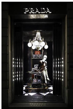
Ilustración 12. escaparate monocromático de Prada.

Algunas marcas han empleado el uso de escaparates monocromáticos, una técnica que genera un gran impacto en los consumidores, y atrae la atención sobre un producto o un elemento importante en la ventana, gracias a la sensación de contraste. Generalmente los escaparates siguen las tendencias y rara vez crean nuevas.