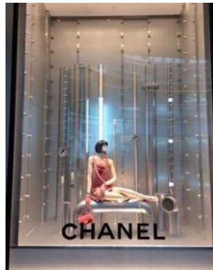
Ilustración 6. Escaparate tienda Chanel.