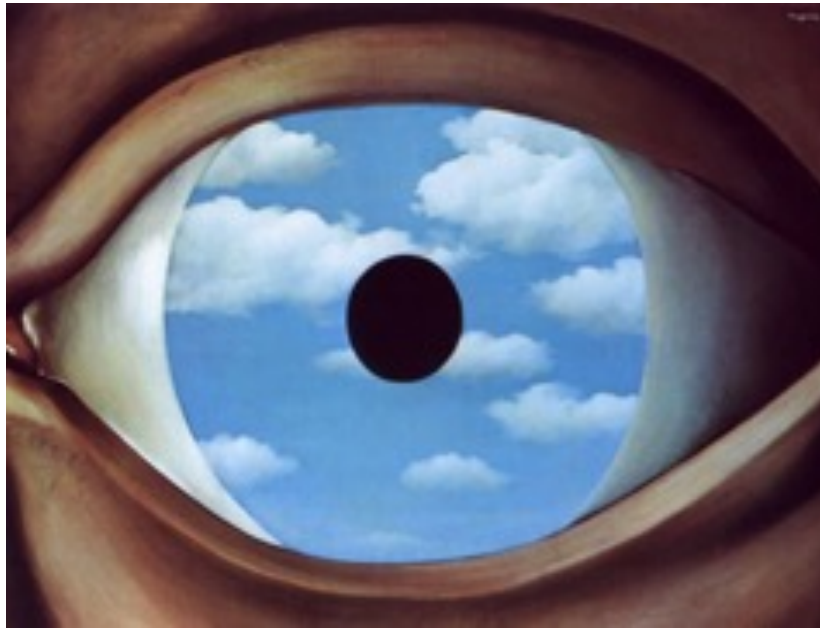
Imagen 5. René Magritte, Le faux miroir, 1950.