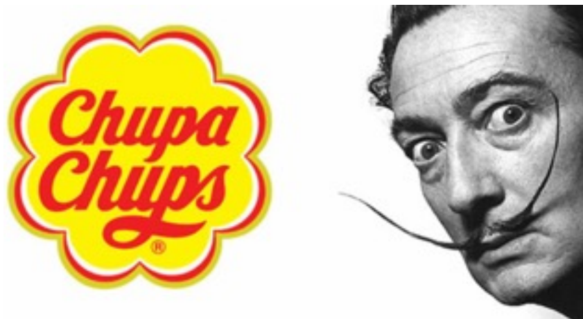
Imagen 9. Salvador Dalí, Salvador Dalí y su logotipo para Chupa Chups , 1969.