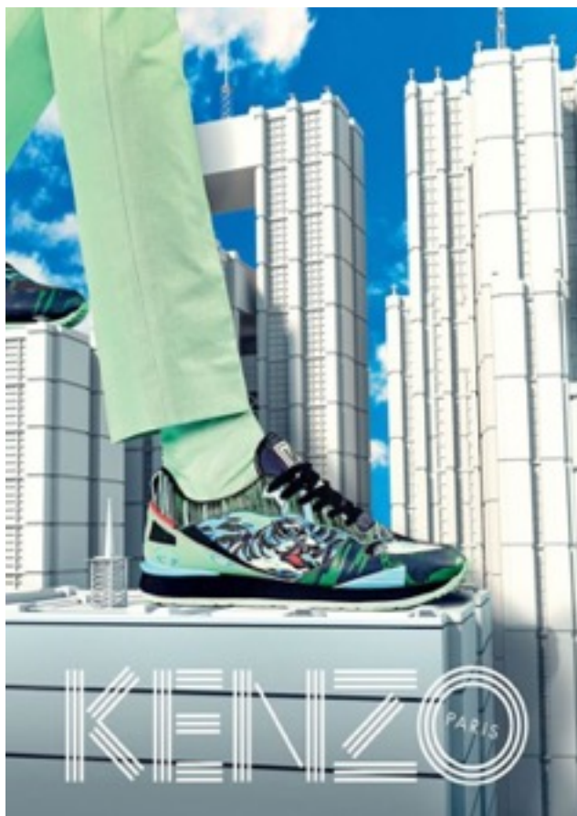
Ilustración 24. Kenzo París, The Spring/Summer 2015 Campaign – Part #2, 2015.

TÍTULO. The Spring/Summer 2015 Campaign – Part #2.