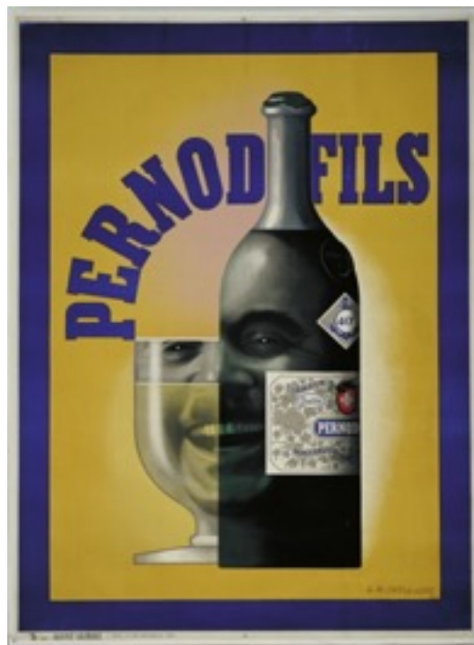
Imagen 3. Cassandre, Pernod Fils, 1934.

Resulta impactante si se hace una comparativa entre sus obras, pero a su vez un paralelismo cobra sentido durante el mismo periodo cuando Cassandre decide dar un giro a su estilo artístico. El porqué de su cambio tiene que ver con la progresión de la corriente artística. Adolphe empleó otros medios que cogió de Magritte, fue el famoso cartel para el aperitivo Pernod, en el cual se refleja un hombre fusionándose con la botella de aperitivo y la copa. El fin de esta disposición es la vinculación del producto con el consumidor, es en lo que se basa principalmente el objetivo publicitario.