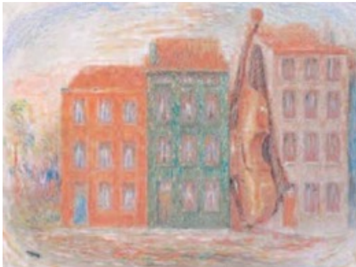
Ilustración 14. René Magritte, Image à la maison vert , 1944.

El objetivo de Magritte era utilizar la altura de los edificios para que los transeúntes que paseaban por las calles se fijaran siempre en el producto publicitado (Roque, G., 2008).