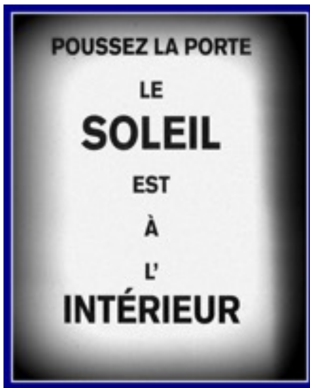
Imagen 6. Paul Nougé, Poussez la porte, le soleil est à l'intérieur, 1925.