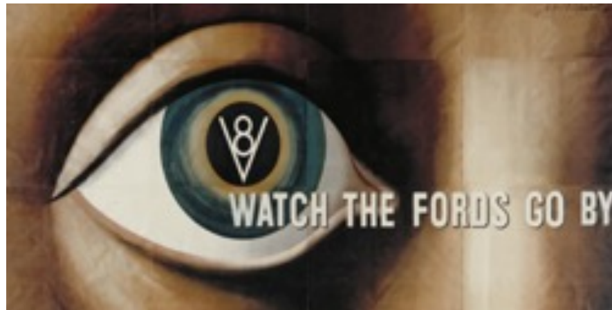
Imagen 4. Cassandre, Watch the Fords go by , cartel para el nuevo Ford V8, 1938.

El ojo es el órgano a través del cual se puede apreciar la realidad tangible. Para el artista supone una unión no perfecta entre la materia y la existencia. Desempeña un papel importante debido a que a través de él, el hombre capta la idea y la representa a su entendimiento. Se podría llegar a decir que es una de las partes más importantes del ser humano.