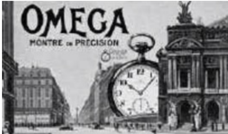
Ilustración 15. René Magritte, Omega, montre de précision , 1930. Fuente: https://www.academia.edu/8104866/La_subversi%C3%B3n_surrealista_de_la_publicidad?email_work_card=view-paper

Del mismo modo se refleja en el anuncio de relojes Omega, en el cual el consumidor se queda fijamente impactado al ver semejante exageración, la idea es extraer de su contexto habitual el objeto. Este es el motivo primordial de contraposición entre publicidad y surrealismo, llamar la intención a través de una figura retórica.