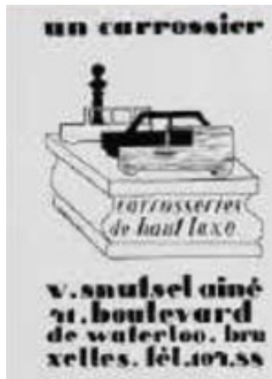
Imagen 2. René Magritte, Un carrossier . Anuncio para una carrocería, 1926.

Sus obras muestran características comunes con su trabajo publicitario: la simetría, la licitud...está presente en todos ellos. Siempre quiso buscar su “estilo universal”. El objetivo de este, era desvincular la actividad innata de un ojo conforme a una regla general. Su formación como artista publicitario se pone de manifiesto en su pintura a través de la claridad de líneas, su impecable dibujo realista y una pincelada pulida y lisa, que se anticipa al arte pop.