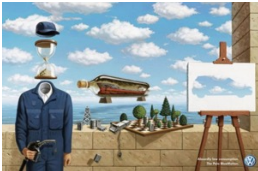
Ilustración 18. DDB Worldwide Communications Group Inc, Polo BlueMotion .

La campaña promociona la línea de coches de la marca con bajo consumo en gasolina a través del empleo de piezas visuales que tanto caracterizan a las obras surrealistas. Fue una campaña que tuvo prestigio pero ciertos críticos opinaron que el mensaje no era claro y que los elementos expuestos hacían que el consumidor se distrajera y se perdiese la esencia de la idea (Museo de Arte Contemporáneo de Alicante, 2007).