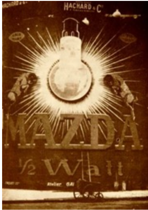
Ilustración 1. Jacques-André Boiffard, L'affiche lumineuse de "Mazda" sur les grands boulevards , 1927.

Cuando años más tarde le preguntaron sobre su opinión acerca de la corriente artística en escaparates y carteles mostró su desinterés absoluto. A través de su postura puede reflejarse el estudio de la relación entre el surrealismo y la publicidad. Para críticos cercanos al grupo surrealista, esta línea artística se trataba de una pérdida de tiempo (Roque, G., 2008).