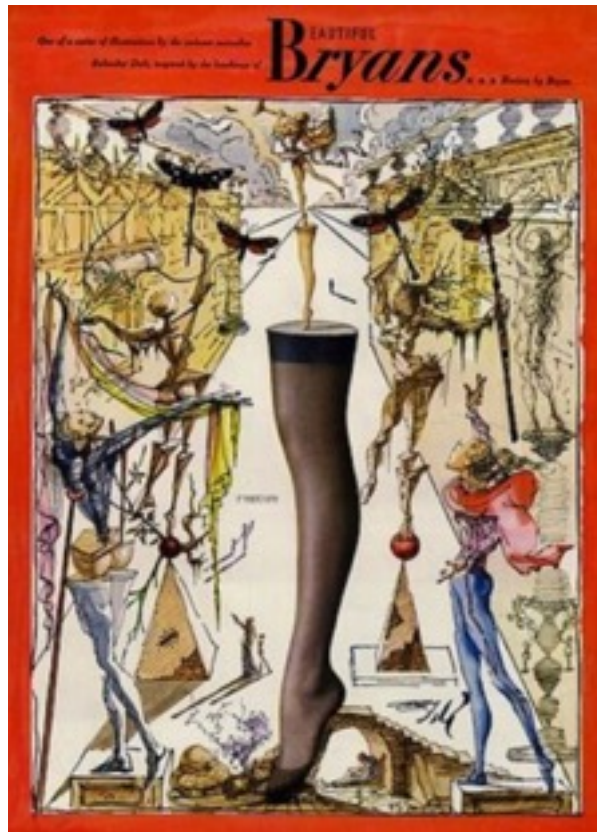
Imagen 8. Salvador Dalí, Campaña para la marca Pantys Bryans, 1940.