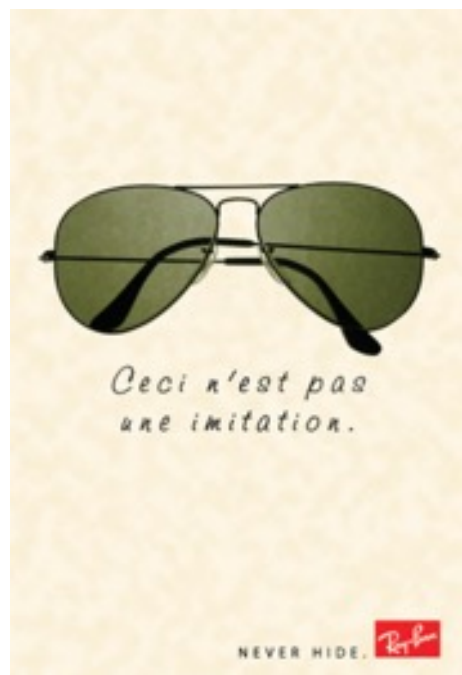
Ilustración 21. Ray-Ban, Ceci n'est pas une imitation . Campaña publicitaria Never hide .

Se muestra la disimilitud entre la falsificación y lo único, exponiendo mensajes en torno a la marca como, “Sé tú mismo, no pretendas ser lo que no eres sólo para agradar a otros, no escondas tu verdadera personalidad...” (Museo de Arte Contemporáneo de Alicante, 2007).