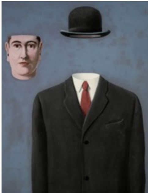
Ilustración 20. René Magritte, Le Pelerin, 1966.