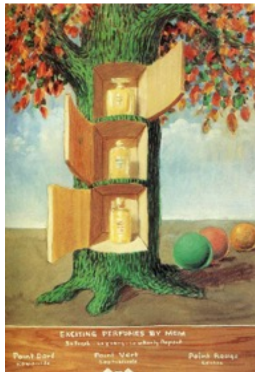
Ilustración 16. René Magritte, Exciting perfumes by Mem, 1946.

Visualmente los elementos no tienen ningún punto en común. Esto conlleva a apreciar lo extraño que parecen los nichos “mágicos” como los nombró Magritte. Dichos elementos han sido extraídos de su contexto y se han posicionado en otro dónde se muestran solitarios o simplemente relacionados sin una unión habitual. A este proceso, René Magritte lo llamó efecto poético turbador (Pompidou, G., 1990).