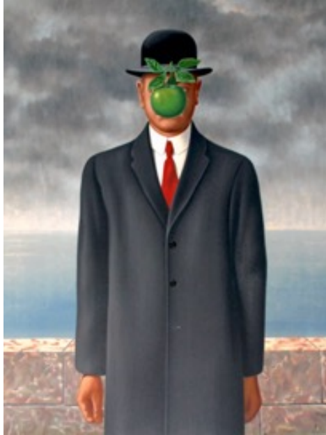
Ilustración 19. René Magritte, Le Fils de l'Homme , 1964. Colección particular, óleo (116 cm x 89 cm).