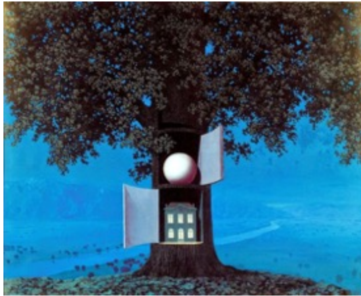
Ilustración 17. René Magritte, La voix du sang, 1948.

Magritte afirmaba que en sus cuadros “colocaba objetos allí donde nunca los encontramos”, un procedimiento destinado a desconcertar la voluntad perceptiva del espectador.