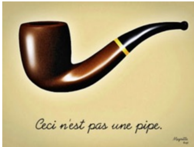
Ilustración 22. René Magritte, Ceci n'est pas une pipe , 1929.