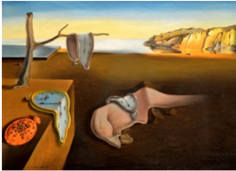
Imagen 10. Salvador Dalí, La persistencia de la memoria , 1931. Óleo sobre lienzo 24 x 33 cm, expuesto en el Museo MoMA.