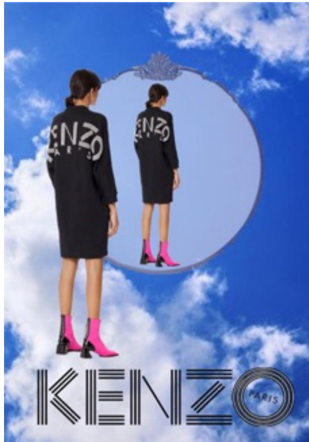
Ilustración 25. Ángela García, The Spring/Summer 2020 Campaign , 2020.

Con motivo del análisis llevado a cabo, me ha parecido interesante hacer una aportación personal con un diseño inspirado en la campaña de primavera verano.