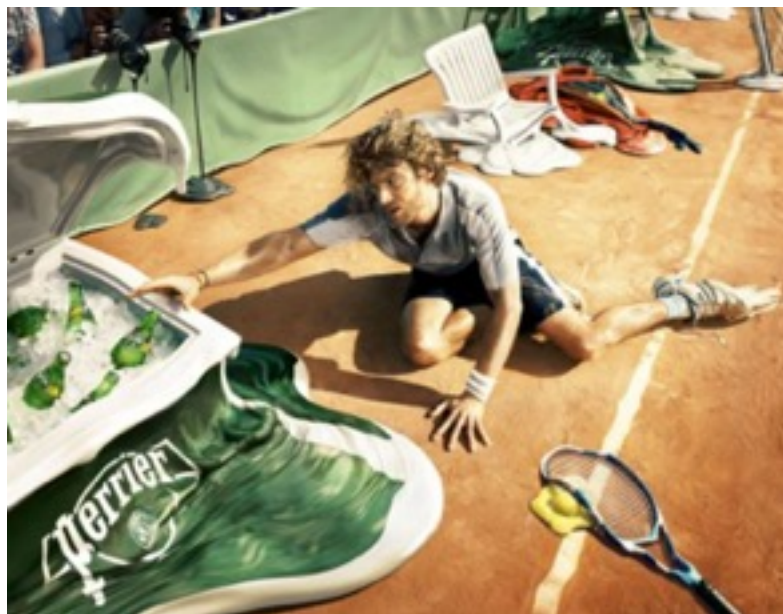
Imagen 11. Ogilvy & Mather París, Melting Campaign , campaña publicitaria para Perrier, 2009.