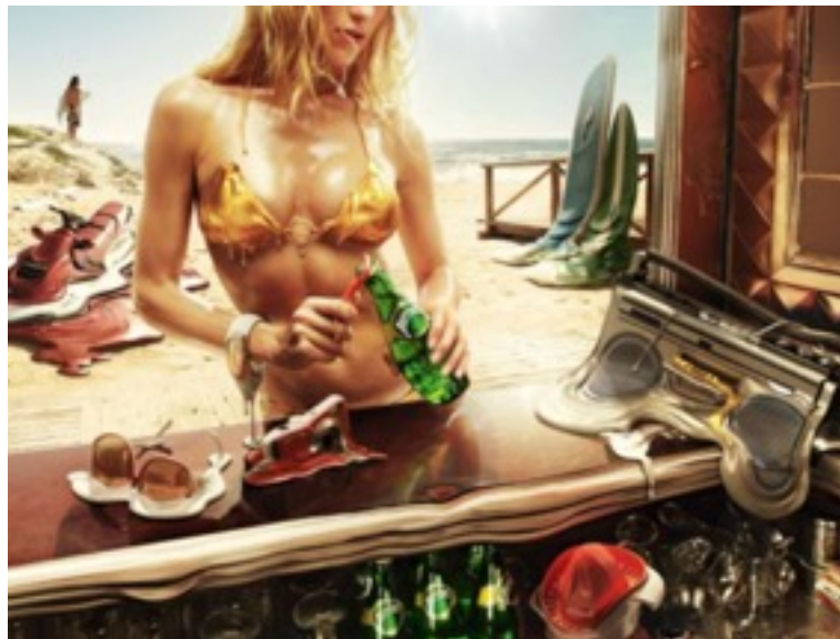
Imagen 13. Ogilvy & Mather París, Melting Campaign , campaña publicitaria para Perrier, 2009.