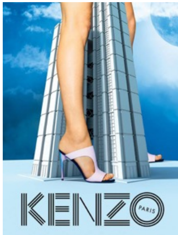
Ilustración 23. Kenzo París, Kenzo S/S 15 Campaign, 2015.