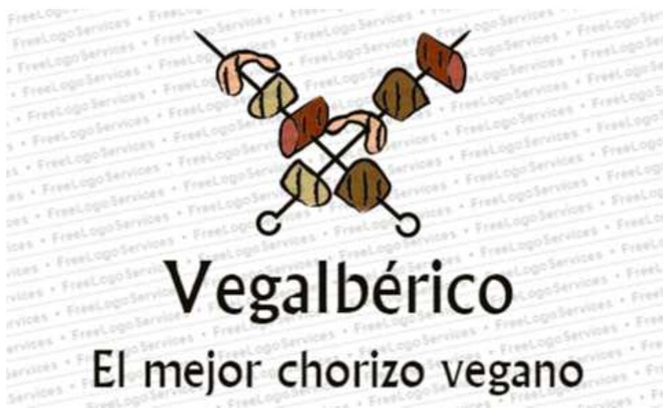
Figura 2. Imagen de la empresa.

A continuación, se muestra la imagen de Vegalbérico, una imagen moderna y creativa que hace referencia a la carne vegana. Se ha decidido hacer mención a la brocheta como imagen para transmitir la versatilidad del producto y potenciar su consumo en eventos sociales como barbacoas.