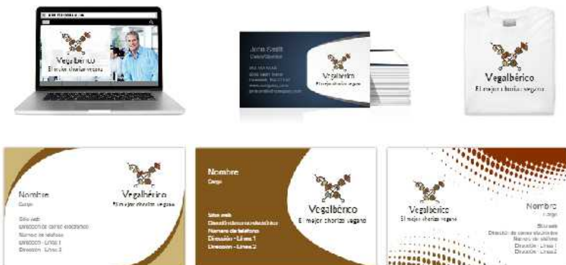
Figura 3. Imagen de la marca en los diferentes productos y web de la empresa.