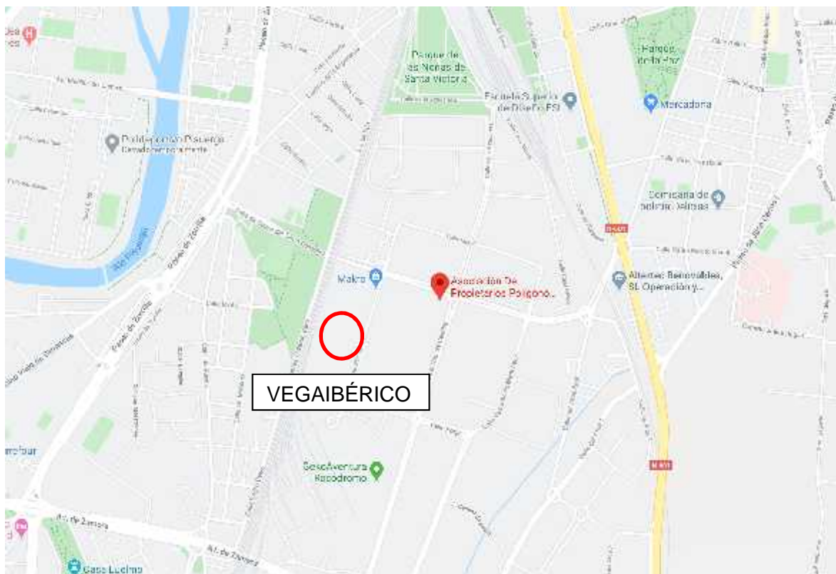
Figura 1. Localización de la empresa.

La localización de la empresa será Valladolid, concretamente el polígono industrial de Argales.