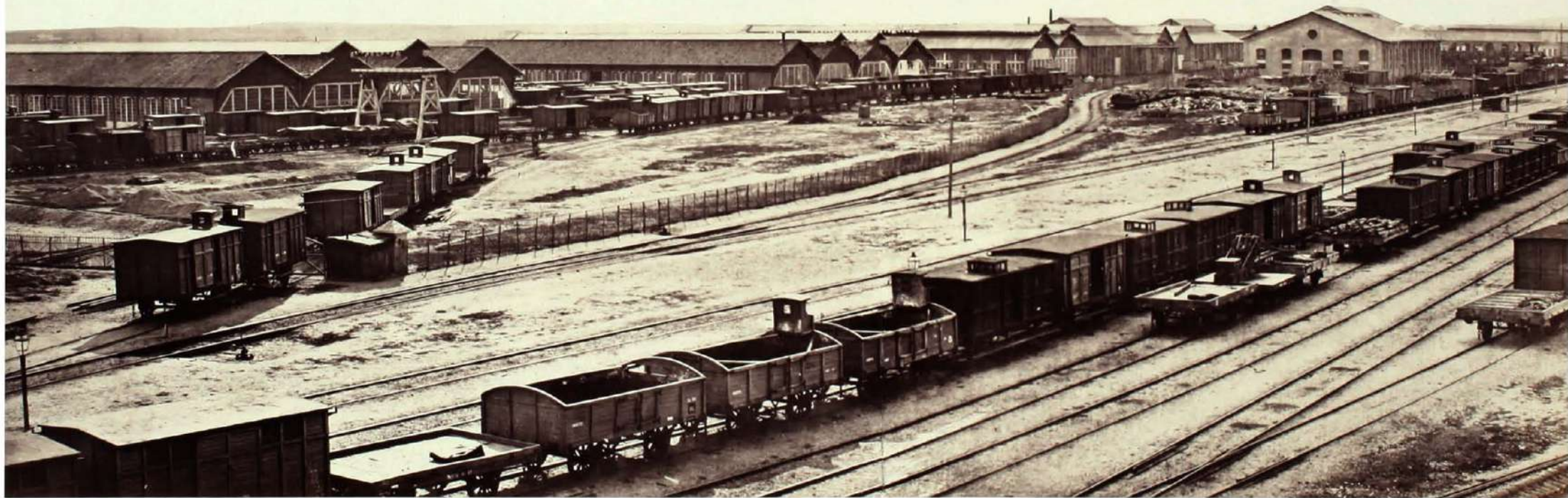
Gare et ateliers à Valladolid