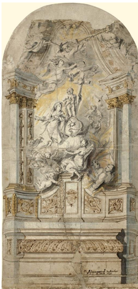
Fig. 7. Diseño de altar para la capilla de Francisco Marcos de Velasco. Pieter Scheemaeckers. 1697. Rijksmuseum, Prentenkabinet, RP-T-1987-29. Ámsterdam

Amberes y Londres en 1765, 64 mencionándose como una magnífica obra de mármol negro y blanco —calificada de obra maestra de la escultura del país—, con una amplia y variada decoración de bronce dorado, figurando en el centro la Trinidad, flanqueada a la derecha por la Virgen con ángeles, y, a la izquierda, las ánimas del purgatorio; “toutes ces Figures sont travaillées en Marbre blanc, dans le derniere delicatesse”. 65 Este retablo de la capilla fue llevado a Holanda hacia 1820 y hoy está en paradero desconocido. Sin embargo, se conserva el diseño del escultor —firmado y fechado en 1697— que está detalladamente dibujado con bizarra inventiva (fig. 7). 66