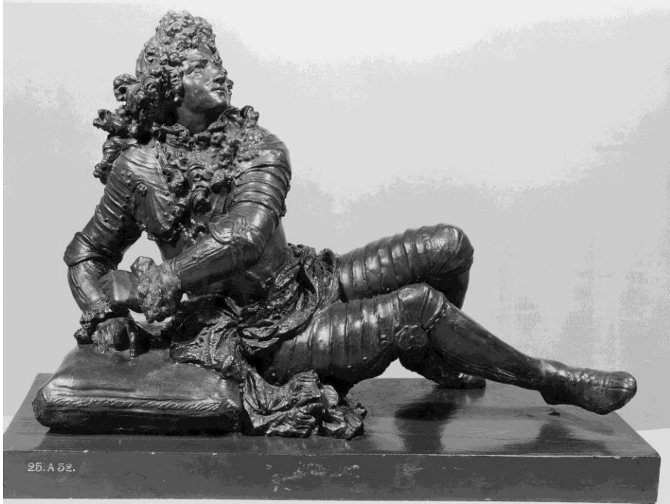
Fig. 16. Modelo en terracota pintada para la figura de Francisco Marcos de Velasco. Pieter Scheemaekers. H. 1696. Museum aan de Stroom, AV. 5531. Amberes.

Bussers 95 ha remarcado que en la imagen de Francisco Marcos de Velasco “la curieuse position en spirale du personnage ajoute un élément dramatique à la scène”. El protagonista parece huir del Tiempo y de la Muerte y se revuelve frente a ellos.