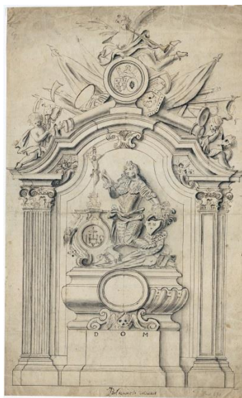
Fig. 11. Proyecto para la tumba de Charles Florentin de Salm. J. B. Carnoncle. H. 1700. Museum Plantin-Moretus, Prentenkabinet, PK.OT. 00670. Amberes