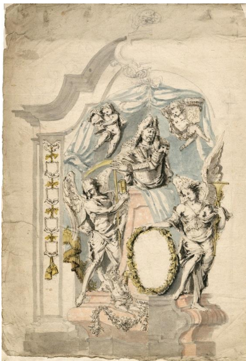
Fig. 14. Diseño para entierro monumental. Pieter Scheemaeckers. H. 1695. Museum Plantin-Moretus, Prentenkabinet, PK.OT. 01460. Amberes