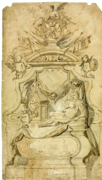
Fig. 15. Diseño para el entierro de Francisco Marcos de Velasco. Pieter Scheemaeckers. H. 1695. Victoria & Albert Museum, E.278-1973. Londres

En el Gabinete de Estampas de Amberes se conserva un dibujo (fig. 9) 87 que se ha considerado como un proyecto, luego muy modificado, para el sepulcro de Francisco Marcos de Velasco. Carece de la intensidad dramática de la obra definitiva pues el yacente permanece indiferente a la presencia de la Muerte. 88 En el remate, el Tiempo y la Fama flanquean las armas del difunto que aparece recostado, vuelto hacia el espectador y señalando la escena del fondo, con la Muerte, un amorcillo con la celada del caballero y otros dos con la inscripción funeraria. Otro dibujo 89 que se ha relacionado con el monumento de Francisco Marcos “montre le buste du défunt sur un socle entouré par le vieillard Temps et la Renommée tenant un médaillon destiné aux inscription” (fig. 14); 90 pero las armas que sujeta un amorcillo no le corresponden. Este