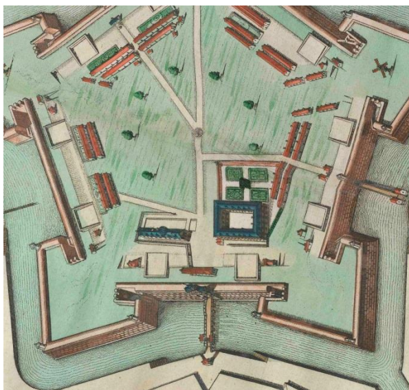
Fig. 4. Castillo de Amberes, detalle . Joan Blaeu, Toonneel der steden van 's Konings Nederlanden . 1652

Flandes. 22 A continuación, fue teniente general de la caballería de este territorio. Fueron años de dificultad militar ante el empuje francés aunque tuvo algún protagonismo en el intento de socorrer Cambrai. 23 En 1678 fue nombrado gran maestre y capitán general de la artillería del ejército de Flandes, 24 hasta que el 6 de julio de 1679 tomó posesión como castellano de Amberes, lo que se consideraba el máximo rango entre las castellanías de Países Bajos (fig. 4).