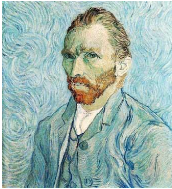
sus cuadros. Figura 5

efectos parecidos debido a su maleabilidad* Ver figura 5 . Además es un pintor muy conocido y con cuadros muy coloridos y atractivos para los niños, incluso su vida y la curiosidad de que se cortó una oreja, también resulta entretenido para los niños/as.