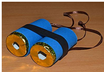
Imagen I. Prismáticos