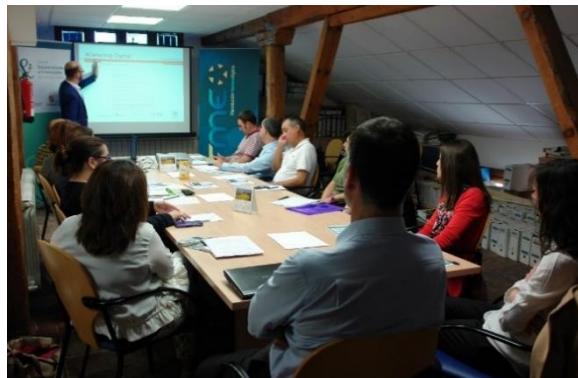
Imagen 4: “Jornada de digitalización empresarial”