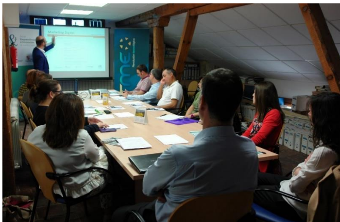
Imagen 7: “Jornada de digitalización de la empresa”

Fuente: ADEMA. “Jornada de digitalización de la empresa”