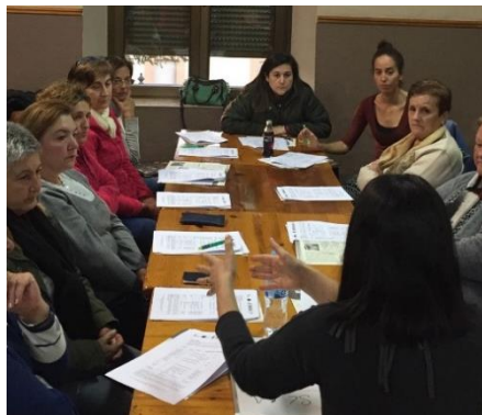
Imagen 3: “Curso de industrias agroalimentarias”