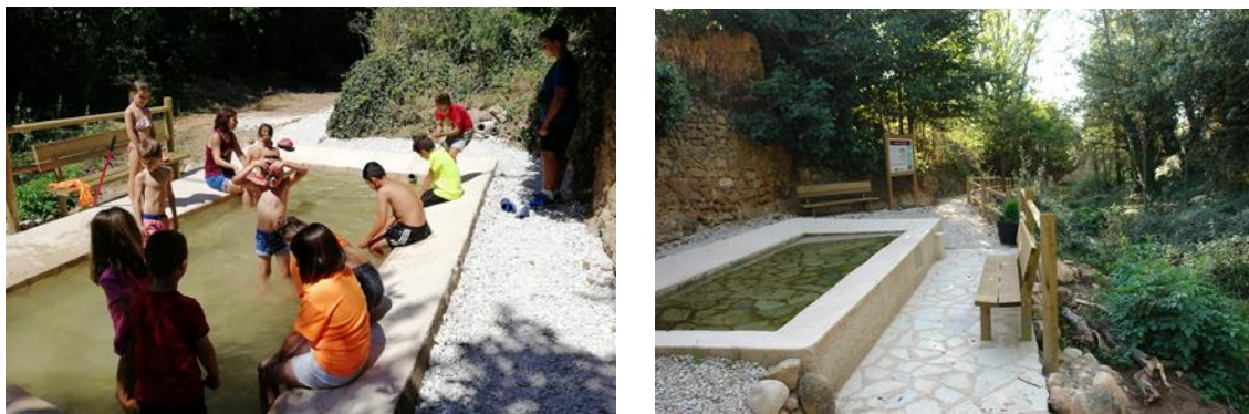
Imagen 6 "Lavadero de Torlengua."

Otro de los ejemplos más destacados es la recuperación del lavadero en Torlengua, el cual se ha convertido en una alternativa de ocio para los más pequeños.