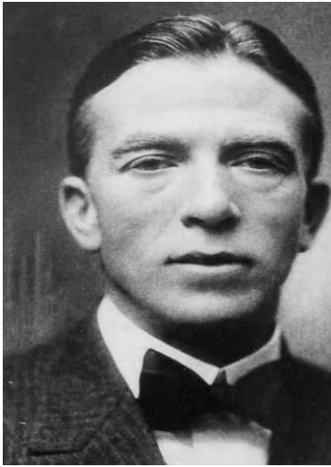
Fig.1. José Goyanes Capdevila

La primera mitad del siglo XX a nivel mundial y también en España existieron brillantes cirujanos que realizaron grandes aportaciones y muy especialmente en el campo de la técnica quirúrgica. Sin embargo lo largo de la historia muchas relevantes personajes de la medicina han podido inicialmente pasar desapercibidos porque sus aportaciones científicas o su obra fueron realizadas en medios de comunicación de reducida difusión o incluso los mismos no fueron publicados desde el punto de vista científico.