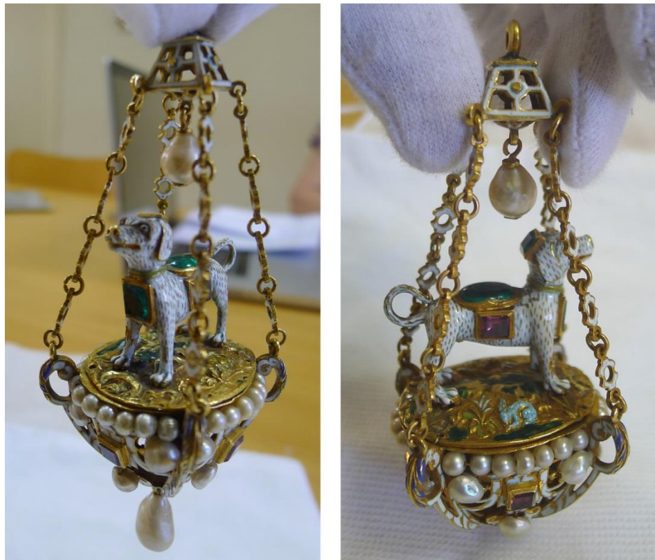
Figs. 11-12. Pinjante de perrillo suspendido entre cuatro cadenas. Ca. 1580-1600. Fundación Lázaro Galdiano (nº inv. 4229). Madrid.

(figs. 11-14). 26 Tal como veremos, el número de gemas que contiene, su naturaleza, forma y disposición coinciden exactamente con las descripciones de los inventarios de la Santa Capilla del Pilar.