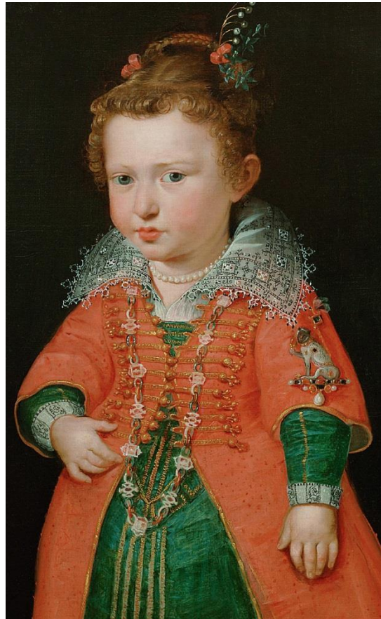
Fig.6. Retrato de Eleonora Gonzaga (detalle). ¿Pedro Pablo Rubens? Ca. 1601. Kunthistorisches Museum (nº inv. GG_3339, 76 x 49,5 cm). Viena.

No obstante, este segundo perrillo, todavía no documentado en los inventarios pilaristas es sin duda, un ejemplar francamente interesante, debido a que nos permite constatar esta moda revitalizada en el siglo XIX. Es muy similar al pinjante, seguro original del siglo XVI, que se conserva en Londres, pero con sutiles variaciones. Ya hemos citado cómo a mediados del siglo XIX, producto de la sucesión incesante de “neos” y revivals historicistas (algunos de ellos absolutamente vacíos de significado y auténticos pastiches), se produce una acusada fiebre en Centroeuropa por conseguir ejemplares de orfebrería de época renacentista. Este segundo ejemplar de perrillo sobre cornucopia parece ser exponente de esa “fiebre neo-renacentista”. En las conclusiones ahondaremos en esta cuestión. Sí adelantamos que es curioso que Miró intuyera este perrillo como del siglo XVII, frente al 336-1870, considerado del siglo XVI. 17 Evidentemente, tanto para el tasador como para el Cabildo era una joya