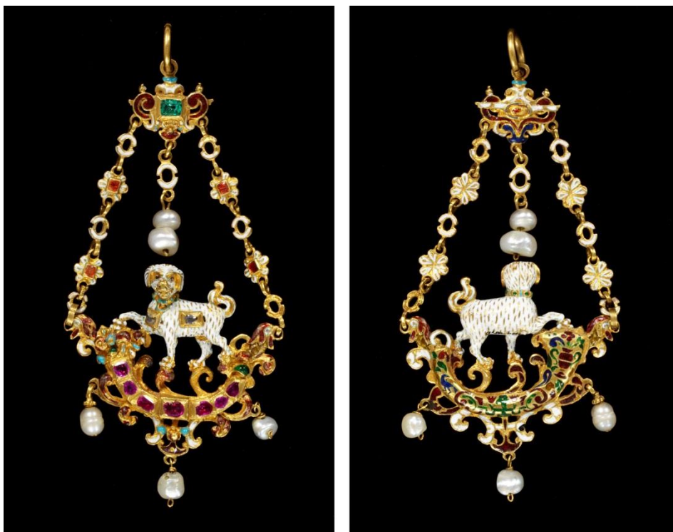
Figs. 1-2. Anverso y reverso del pinjante de cadenas en forma de perrillo apoyado sobre una cornucopia. Ca. 1580-1600. Victoria & Albert Museum (nº inv. 336-1870). Londres.