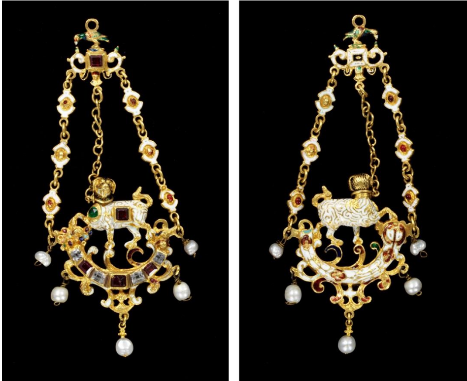
Figs. 3-4. Anverso y reverso del pinjante de perrillo sobre cornucopia en oro esmaltado y gemas preciosas. Ca. 1860. Victoria & Albert Museum (nº inv. 334/1870). Londres.

aparece) y antes de la subasta de 1870, lo cual induce ciertamente a pensar que incluso podría ser producto de la factoría de Vasters.