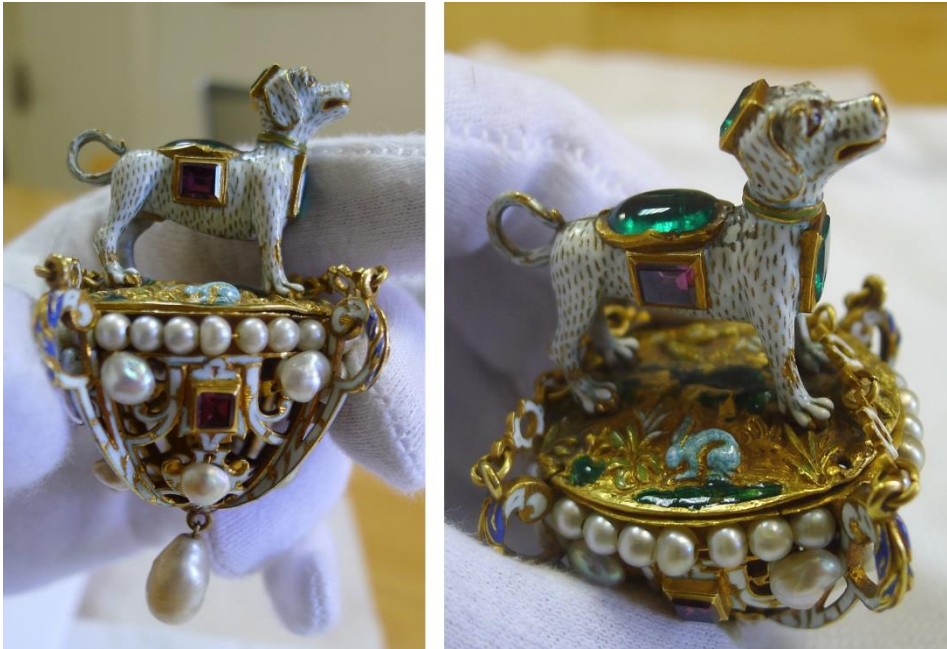
Figs. 13-14.- Detalles del pinjante de perrillo suspendido entre cuatro cadenas. Ca. 1580-1600. Fundación Lázaro Galdiano (nº inv. 4229). Madrid.

un joyel de oro sostenido por cuatro cadenitas y adornado con rubíes, perlas y esmeraldas, en cuyo centro hay un perrito. Lo delicado de sus esmaltes, caprichosos dibujos y artística ejecución lo recomiendan, como también la época del trabajo ejecutado en el siglo XVI.